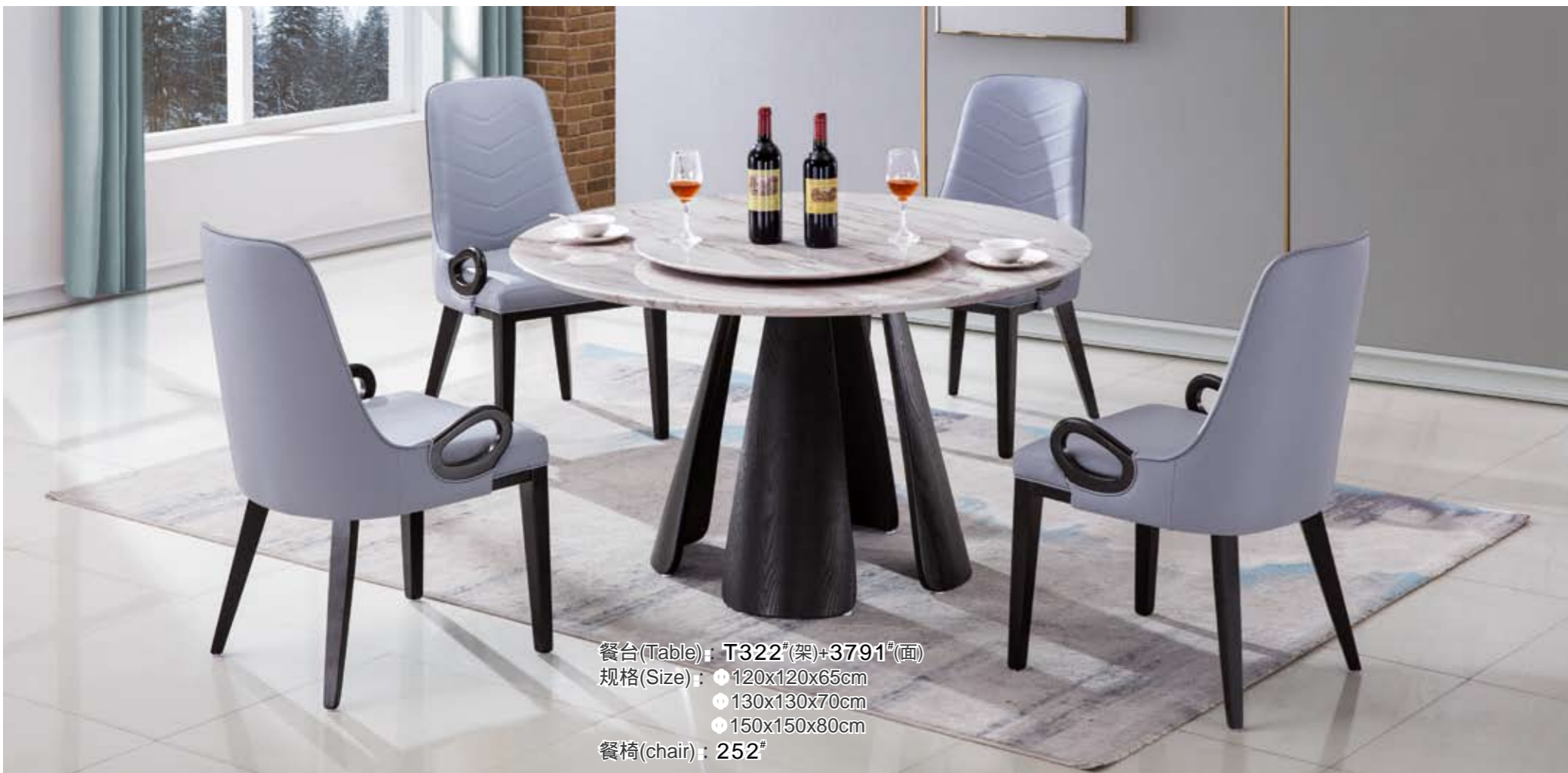
餐台(Table) : T322 # (架)+3791 # (面) 规格(Size) : ● 120x120x65cm ● 130x130x70cm ● 150x150x80cm 餐椅(chair) : 252 #