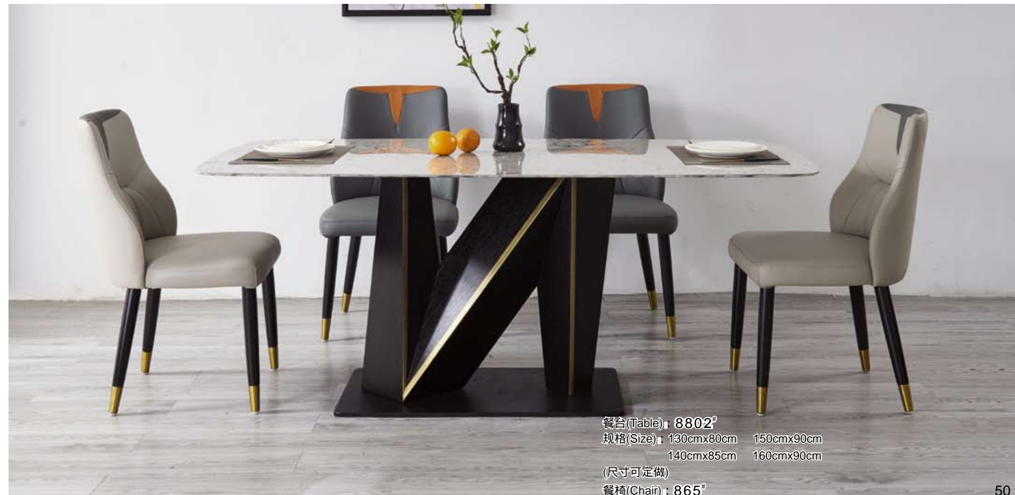
餐台(Table) : 8802 # 规格(Size) : 130cmx80cm 150cmx90cm 140cmx85cm 160cmx90cm (尺寸可定做) 餐椅(Chair) : 865 #