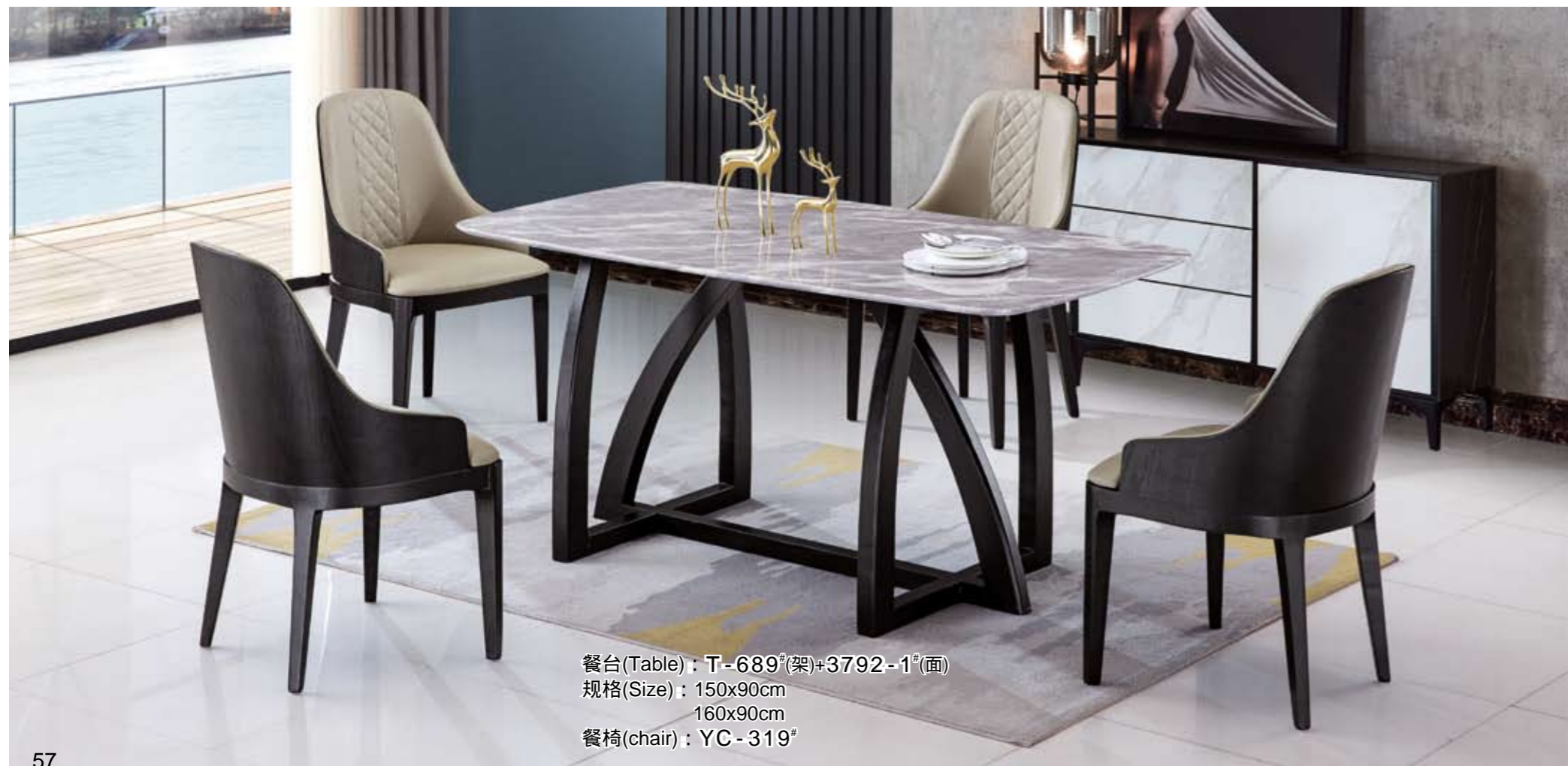
餐台(Table) : T-689 # (架)+3792-1 # (面) 规格(Size) : 150x90cm 160x90cm 餐椅(chair) : YC-319 #