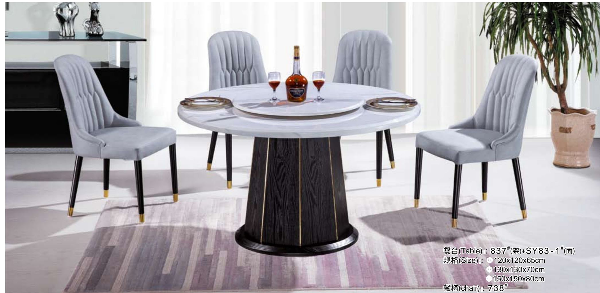
餐台(Table) : 837#(架)+SY83-1#(面) 规格(Size) : \phi 120x120x65cm \phi 130x130x70cm \phi 150x150x80cm 餐椅(chair) : 738#