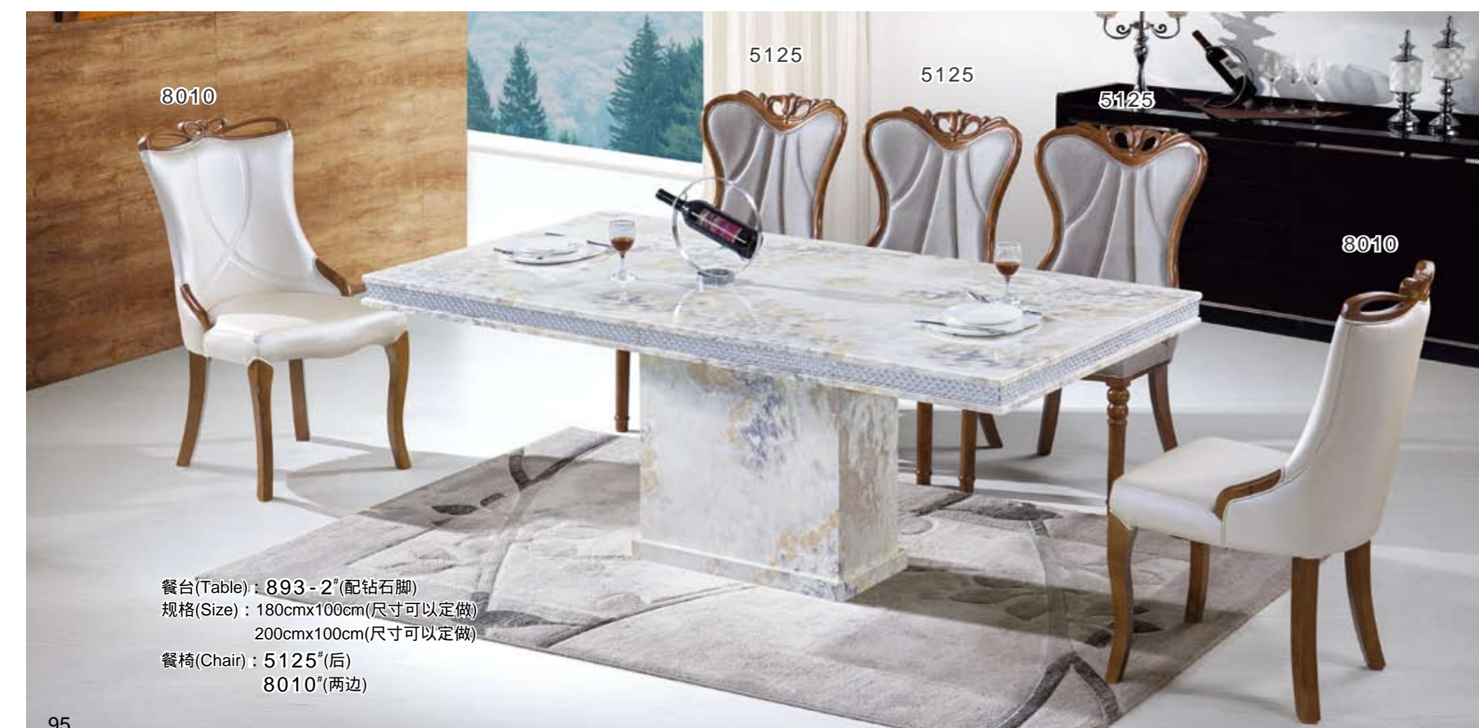
8010 5125 5125 5125 8010 餐台(Table) : 893 - 2"(配钻石脚) 规格(Size) : 180cmx100cm(尺寸可以定做) 200cmx100cm(尺寸可以定做) 餐椅(Chair) : 5125"(后) 8010"(两边)