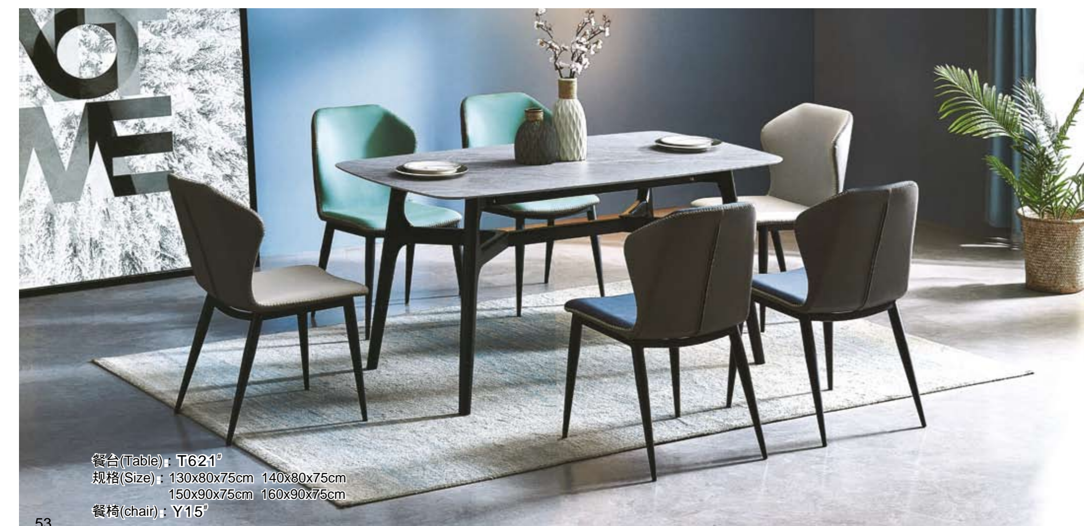
餐台(Table): T621 # 规格(Size): 130x80x75cm 140x80x75cm 150x90x75cm 160x90x75cm 餐椅(chair): Y115 #