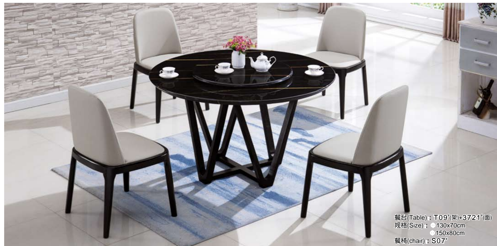
餐台(Table) : T09 # (架)+3721 # (面) 规格(Size) : ● 130x70cm ● 150x80cm 餐椅(chair) : S07 #