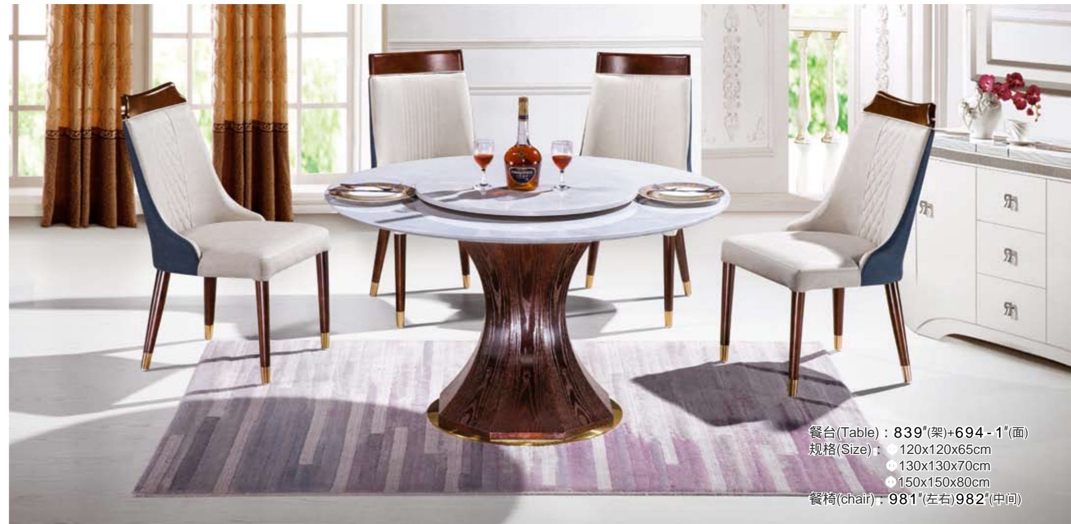
餐台(Table) : 839 # (架)+694-1 # (面) 规格(Size) : ● 120x120x65cm ● 130x130x70cm ● 150x150x80cm 餐椅(chair) : 981 # (左右)982 # (中间)