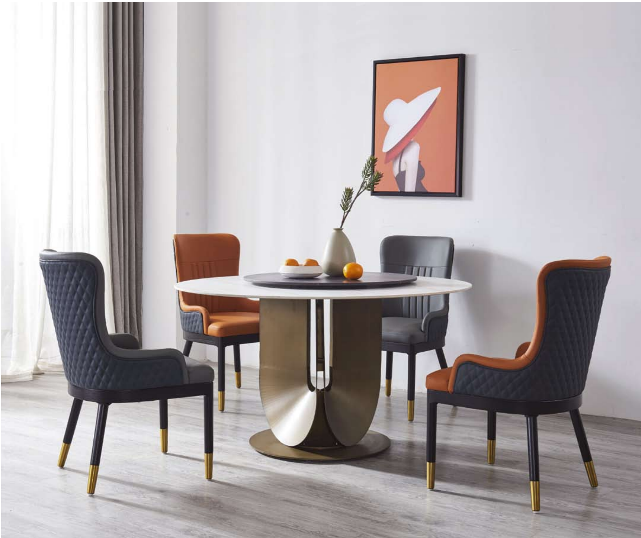
餐台(Table) : 雪山石+9803#(台脚) 规格(Size) : 120cmx65cm 150cmx80cm 130cmx70cm (尺寸可定做) 餐椅(Chair) : 867#