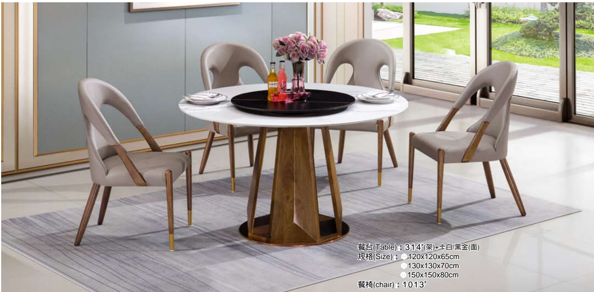
餐台(Table) : 314#(架)+卡白/黑金(面) 规格(Size) : \phi 120x120x65cm \phi 130x130x70cm \phi 150x150x80cm 餐椅(chair) : 1013#