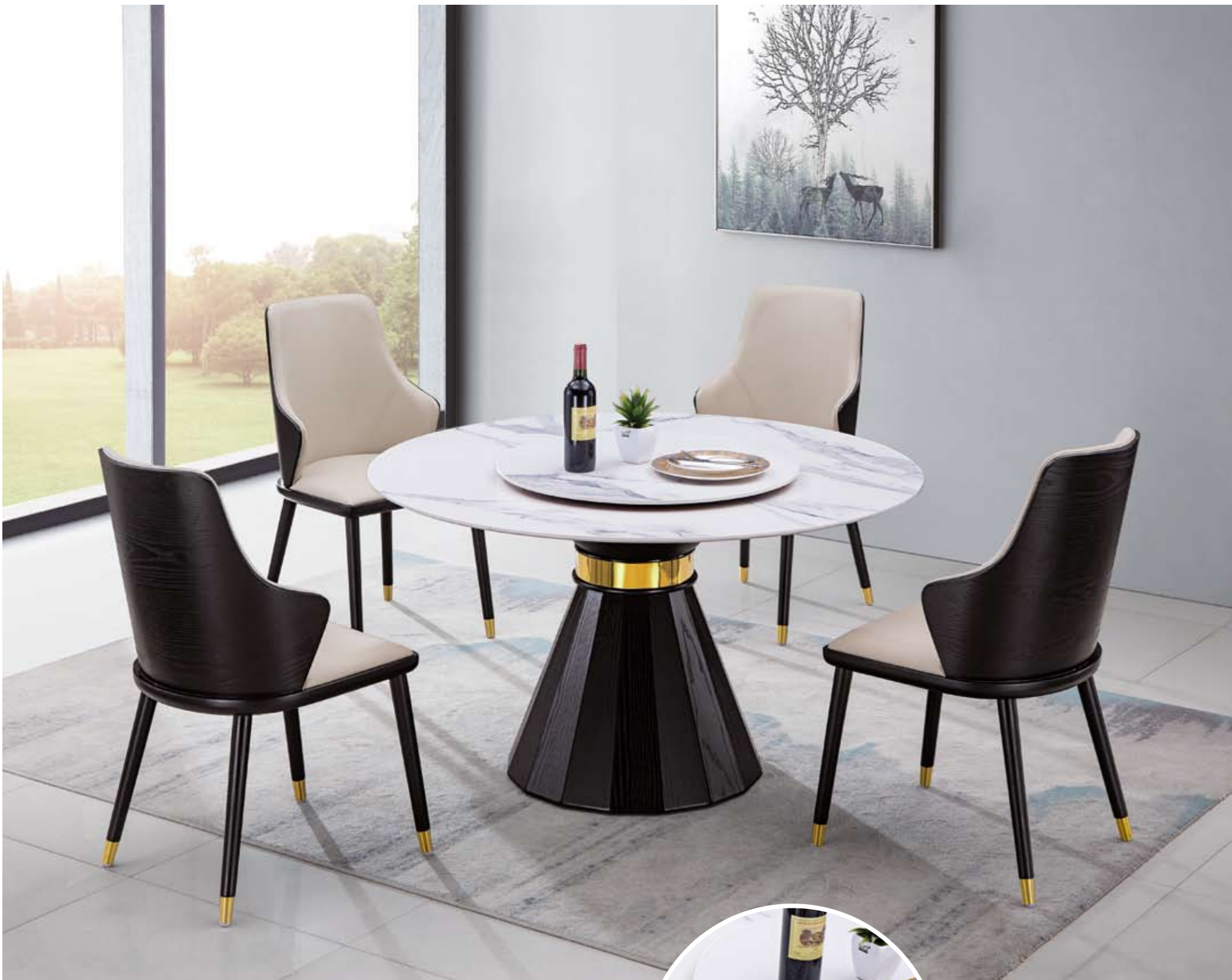
餐台(Table) : 卡白 ® (面)+320 ® (台架) 规格(Size) : 120cm+65cm 130cm+70cm 150cm+80cm 160cm+90cm 餐椅(Chair) : 219 - 2