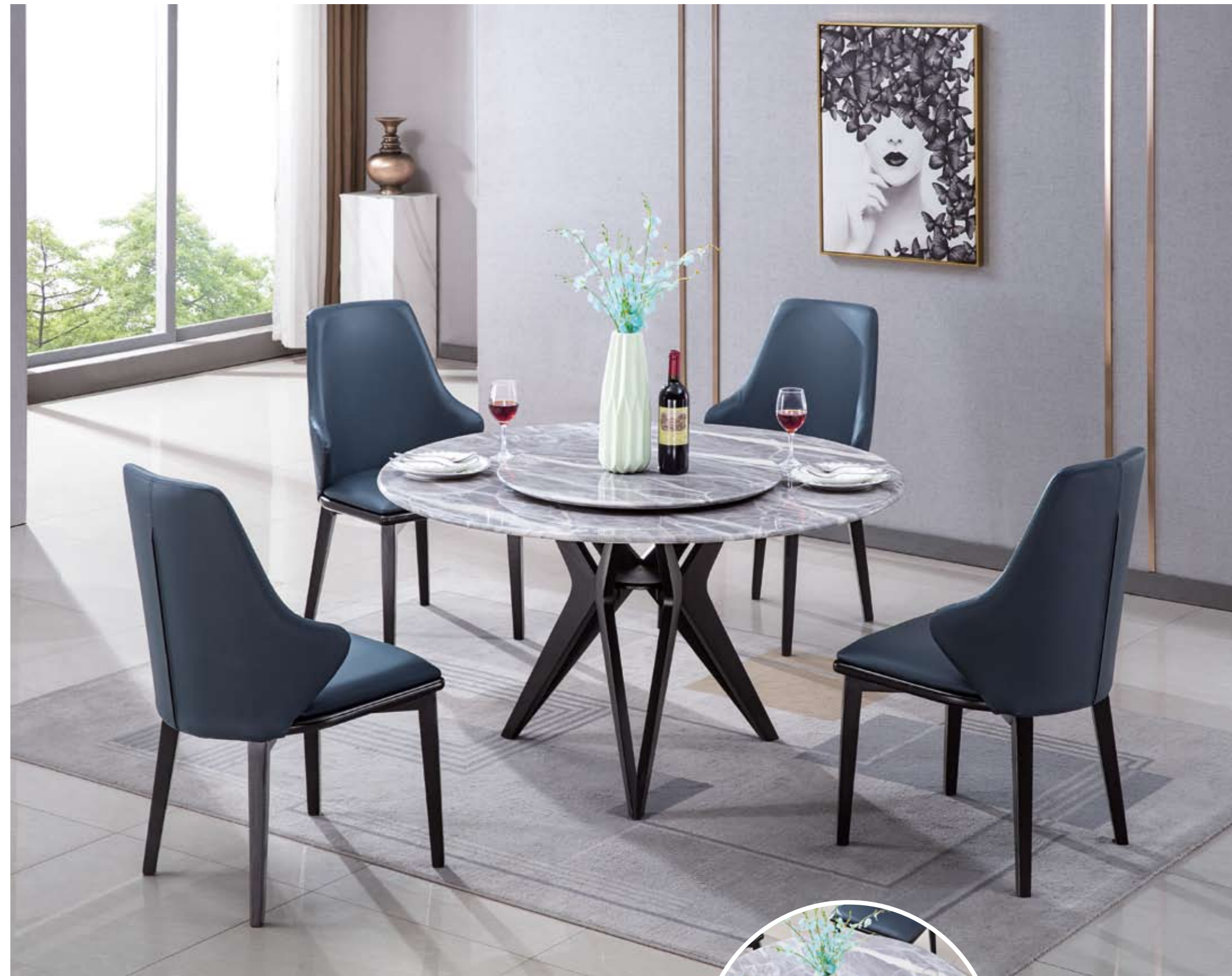
餐台(Table) : 8911 - 2"(面)+312"(台架) 规格(Size) : 120cm+65cm 130cm+70cm 150cm+80cm 160cm+90cm 餐椅(Chair) : 931#