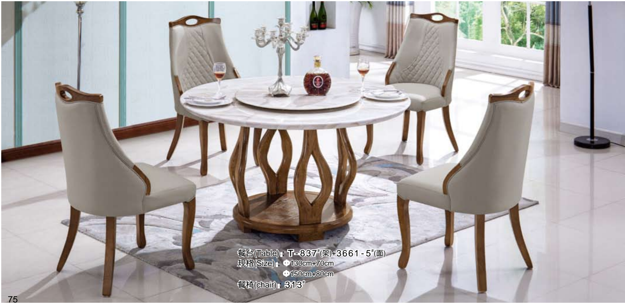
餐台(Table): T-837(架)+3661-5(面) 规格(Size): 130cm+70cm 150cm+80cm 餐椅(chair): 313