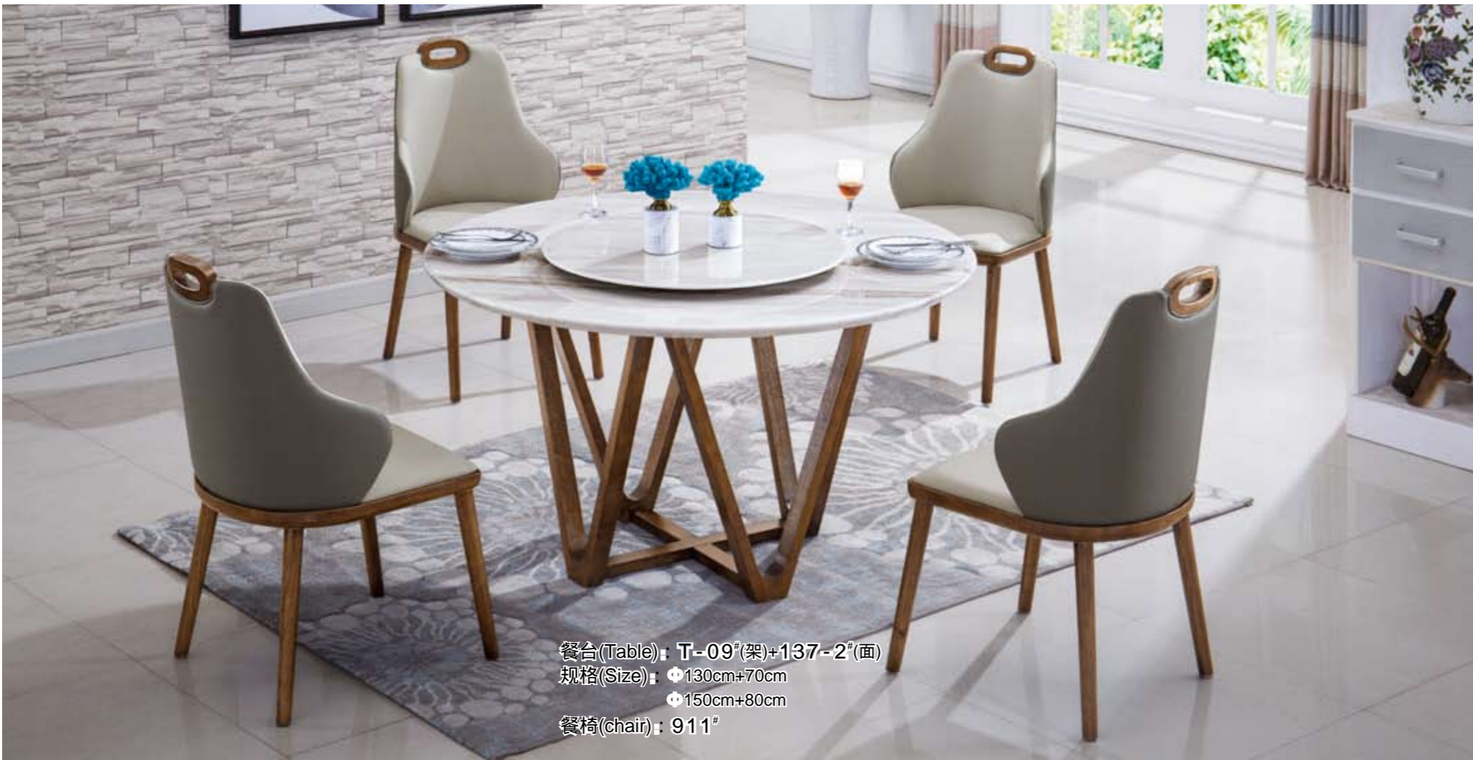
餐台(Table): T-09(架)+137-2(面) 规格(Size): 130cm+70cm 150cm+80cm 餐椅(chair): 911