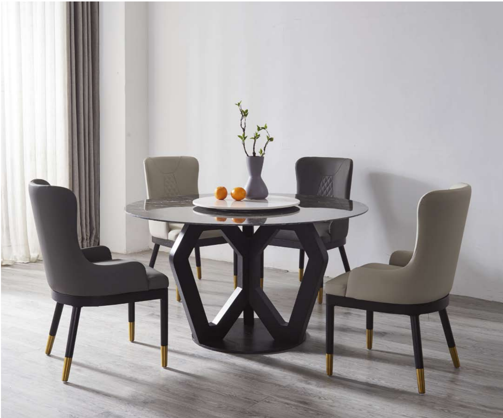
餐台(Table) : 星空黑+9802 # (台脚) 规格(Size) : 120cmx65cm 150cmx80cm 130cmx70cm (尺寸可定做) 餐椅(Chair) : 868 #