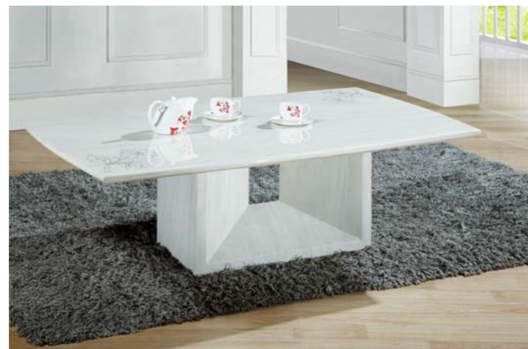
茶几(Tea Table): 1001# 石脚茶几 规格(Size): 80cm x 80cm 130cm x 80cm 140cm x 85cm 150cm x 90cm (尺寸可订做)