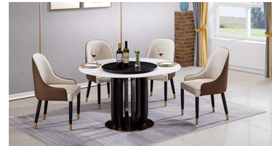
← 餐台(Table) : T13 # (架)+劳伦白金+劳伦黑金(面) 规格(Size) : 120x120x65cm 130x130x70cm 150x150x80cm 餐椅(chair) : 2009 #