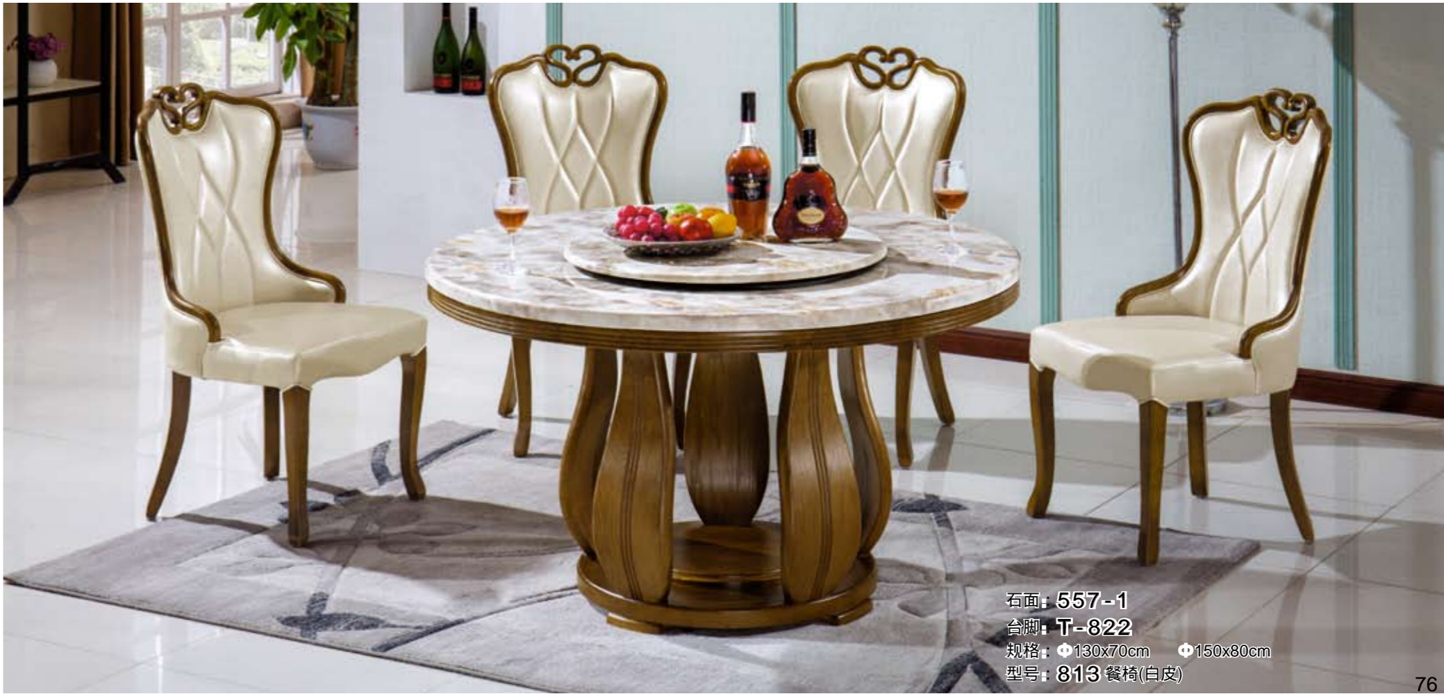
石面: 557-1 台脚: T-822 规格: 130x70cm 150x80cm 型号: 813 餐椅(白皮)