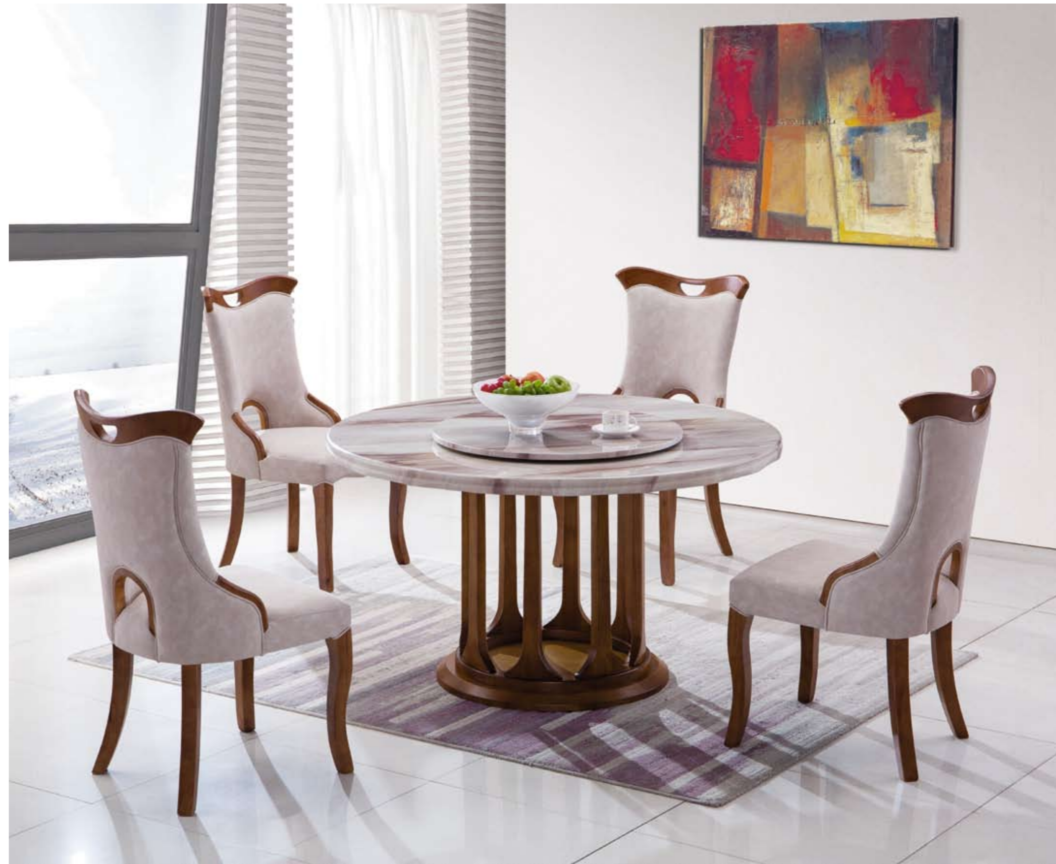
餐台(Table) : 825A # (架)+137-2 # (面) 规格(Size) : 130cm+70cm 150cm+85cm 餐椅(chair) : 601 #