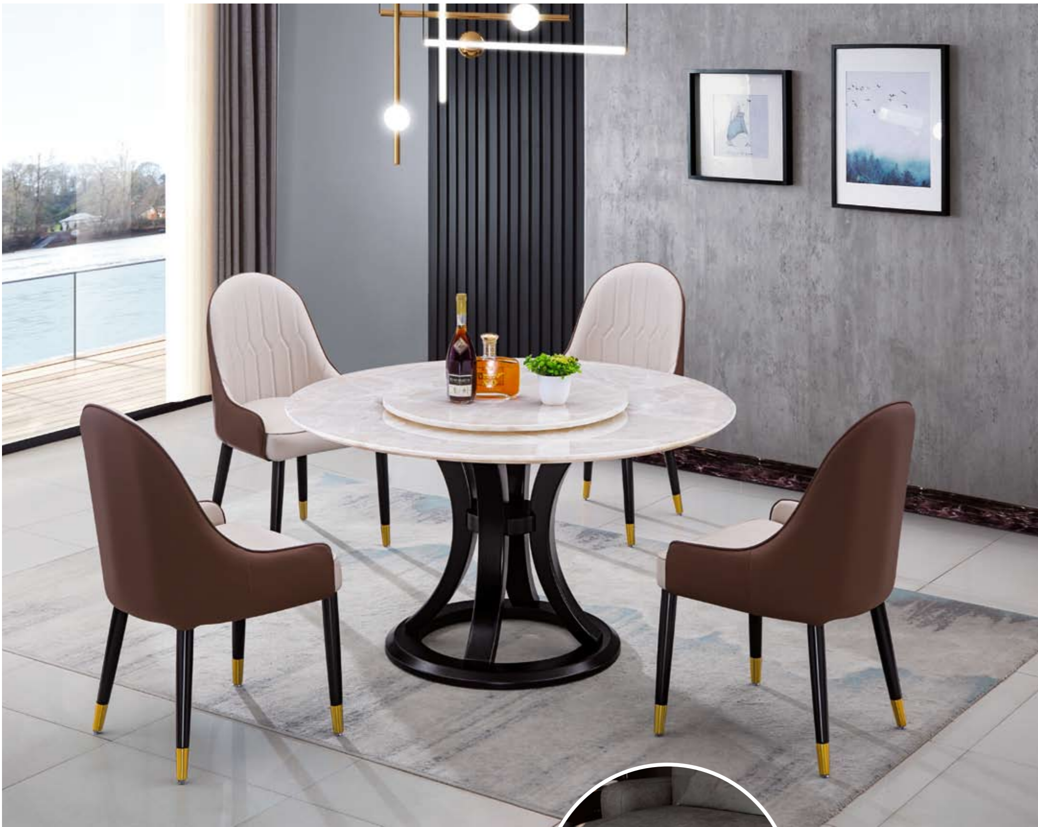
餐台(Table) : 白冰花 # (面)+B08 # (台架) 规格(Size) : 120cm+65cm 130cm+70cm 150cm+80cm 160cm+90cm 餐椅(Chair) : 2009 #