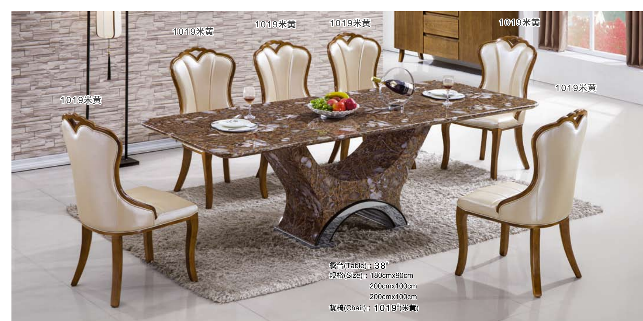
1019米黄 1019米黄 1019米黄 1019米黄 1019米黄 餐台(Table) : 38" 规格(Size) : 180cmx90cm 200cmx100cm 200cmx100cm 餐椅(Chair) : 1019"(米黄)