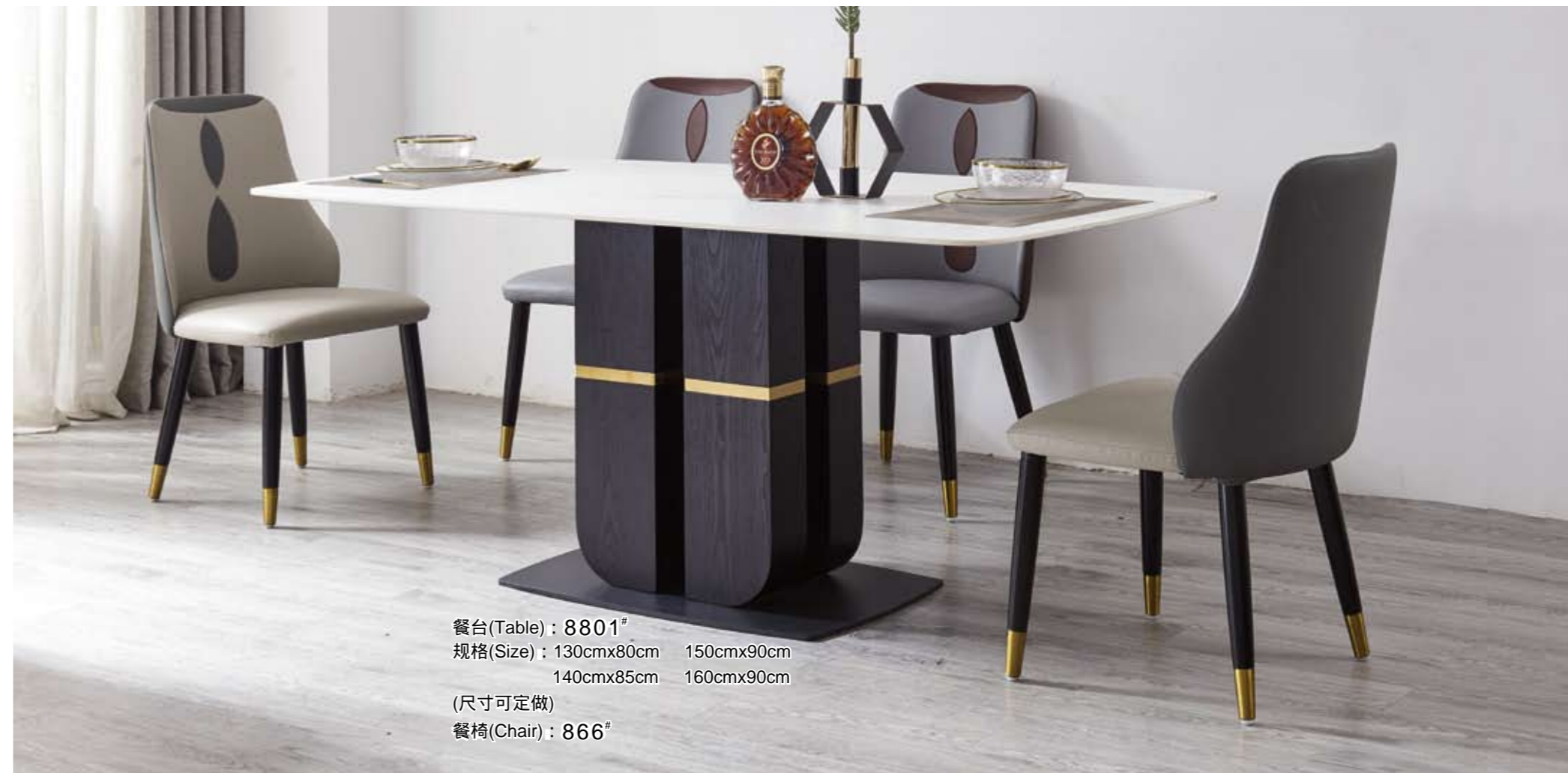
餐台(Table) : 8801 # 规格(Size) : 130cmx80cm 150cmx90cm 140cmx85cm 160cmx90cm (尺寸可定做) 餐椅(Chair) : 866 #