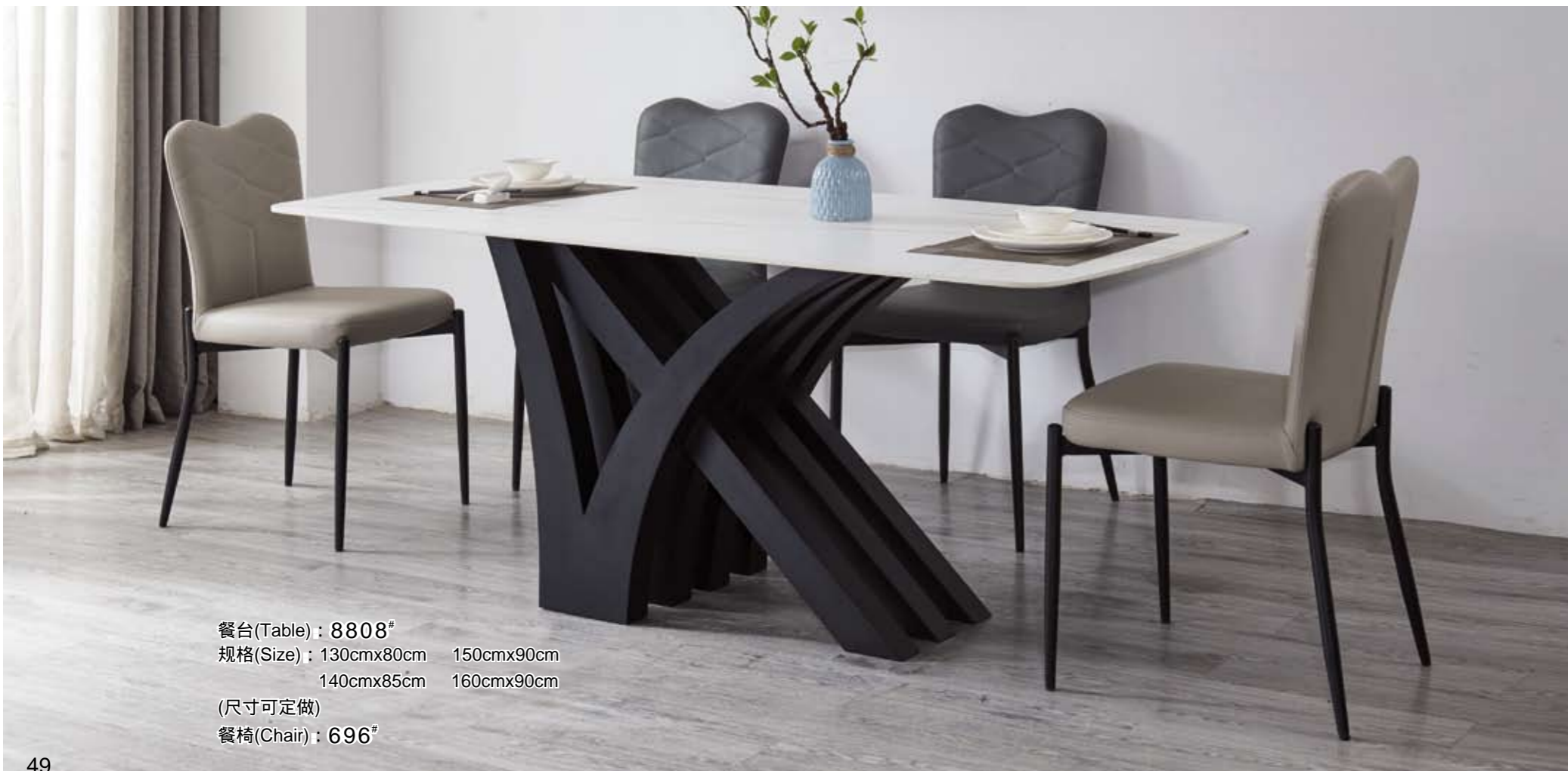
餐台(Table) : 8808 # 规格(Size) : 130cmx80cm 150cmx90cm 140cmx85cm 160cmx90cm (尺寸可定做) 餐椅(Chair) : 696 #