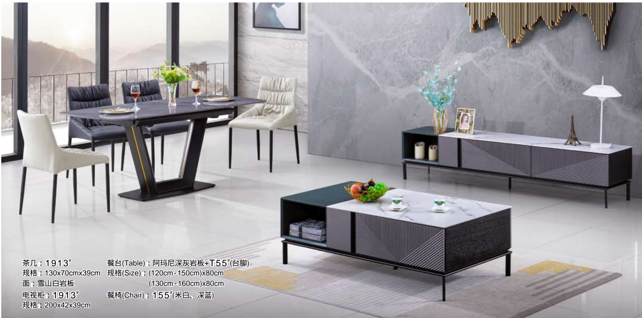
茶几：1913 # 规格：130x70cmx39cm 面：雪山白岩板 餐台(Table)：阿玛尼深灰岩板+T55 # (台脚) 规格(Size)：(120cm-150cm)x80cm (130cm-160cm)x80cm 电视柜：1913 # 规格：200x42x39cm 餐椅(Chair)：155 # (米白、深蓝)