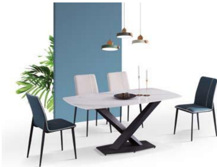
餐台(Table) : T007 # (功能台) 规格(Size) : 130x80cm 140x85cm 160x90cm 餐椅(chair) : D35 # /113 #