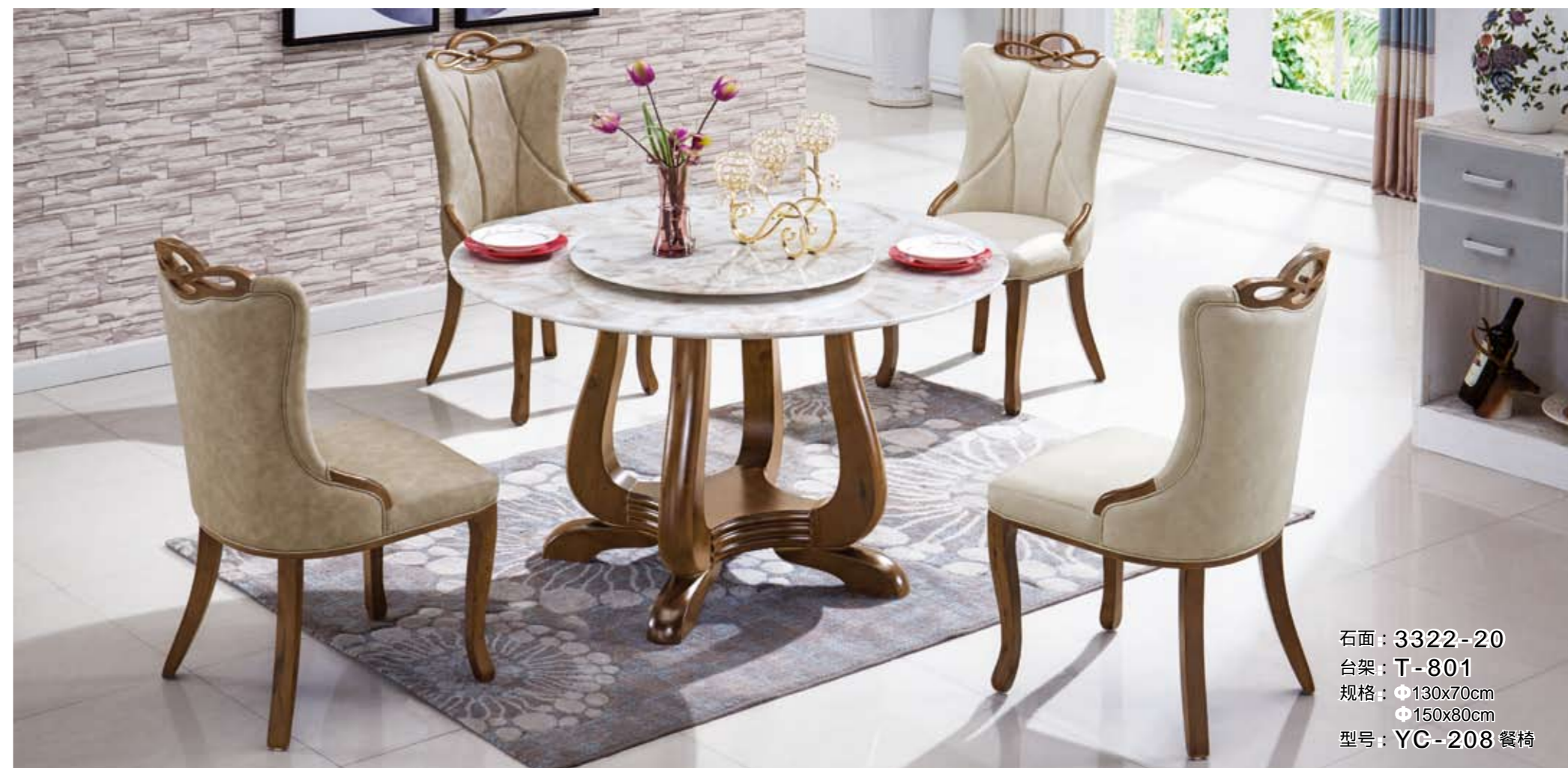
石面: 3322-20 台架: T-801 规格: 130x70cm 150x80cm 型号: YC-208 餐椅