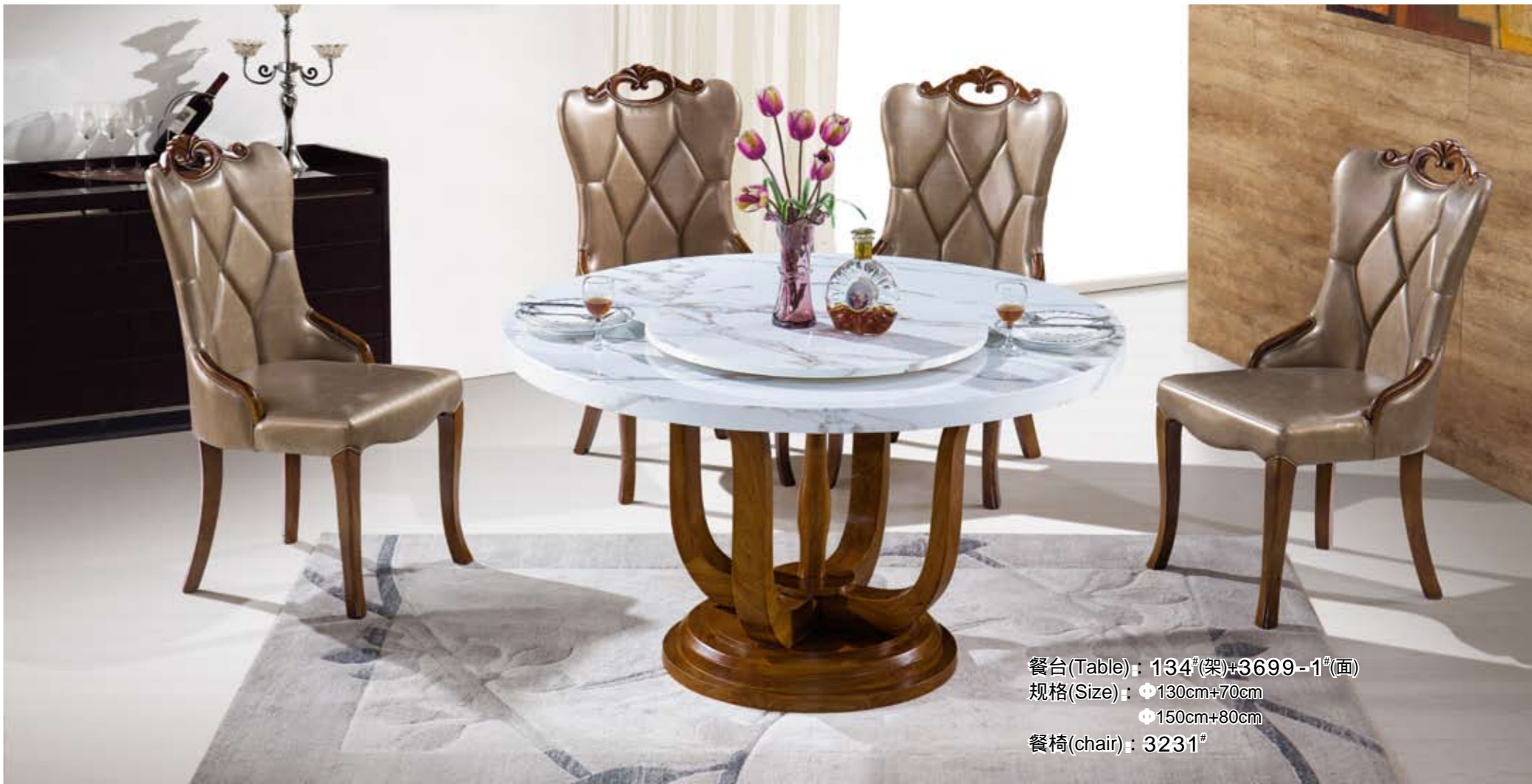
餐台(Table): 134(架)+3699-1(面) 规格(Size): 130cm+70cm 150cm+80cm 餐椅(chair): 3231