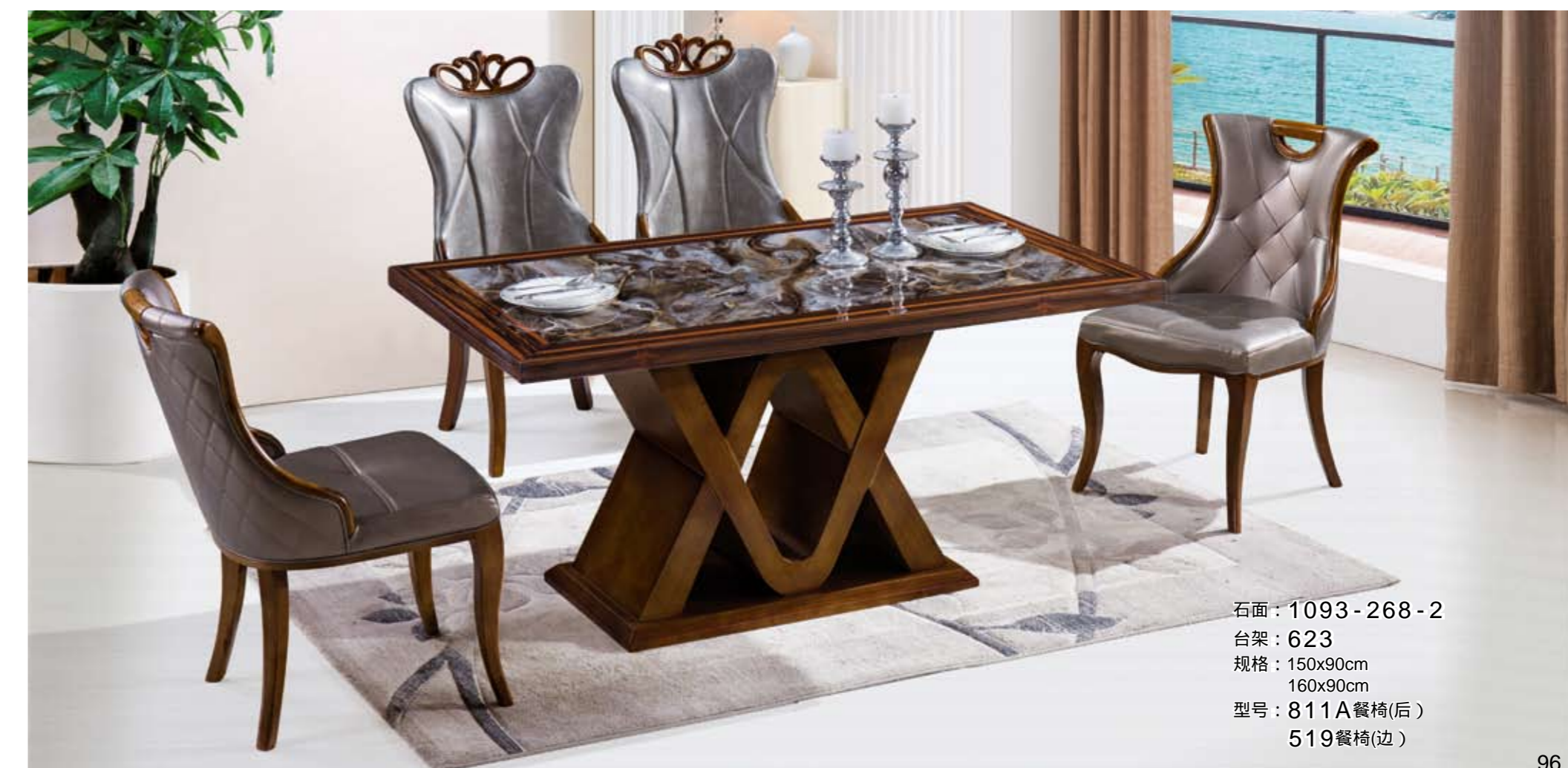
石面 : 1093 - 268 - 2 台架 : 623 规格 : 150x90cm 160x90cm 型号 : 811A餐椅(后) 519餐椅(边)