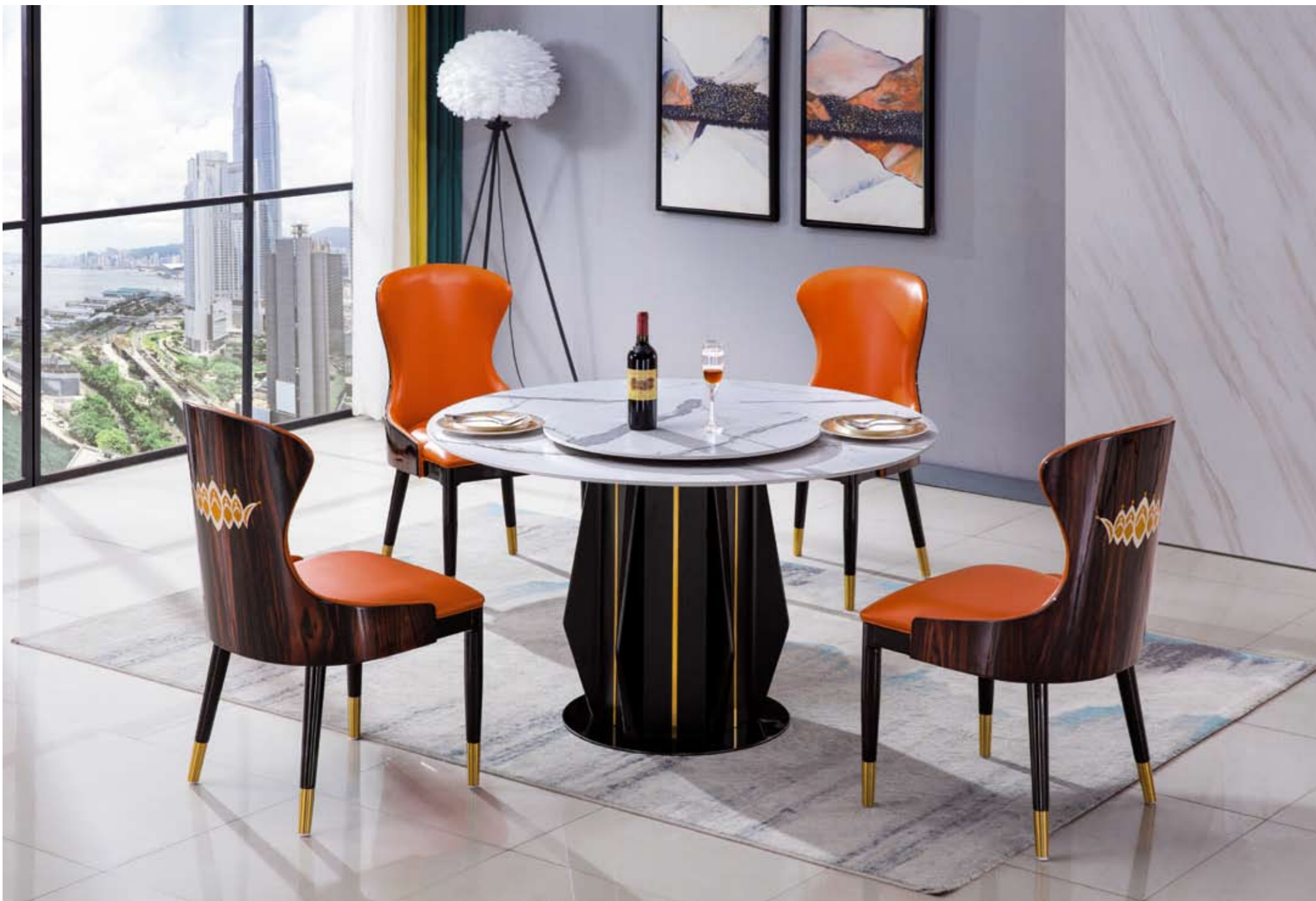
餐台(Table) : 2019 # (架)+(卡金岩板) 规格(Size) : 120x120x65cm 130x130x70cm 150x150x80cm 餐椅(chair) : 288 #