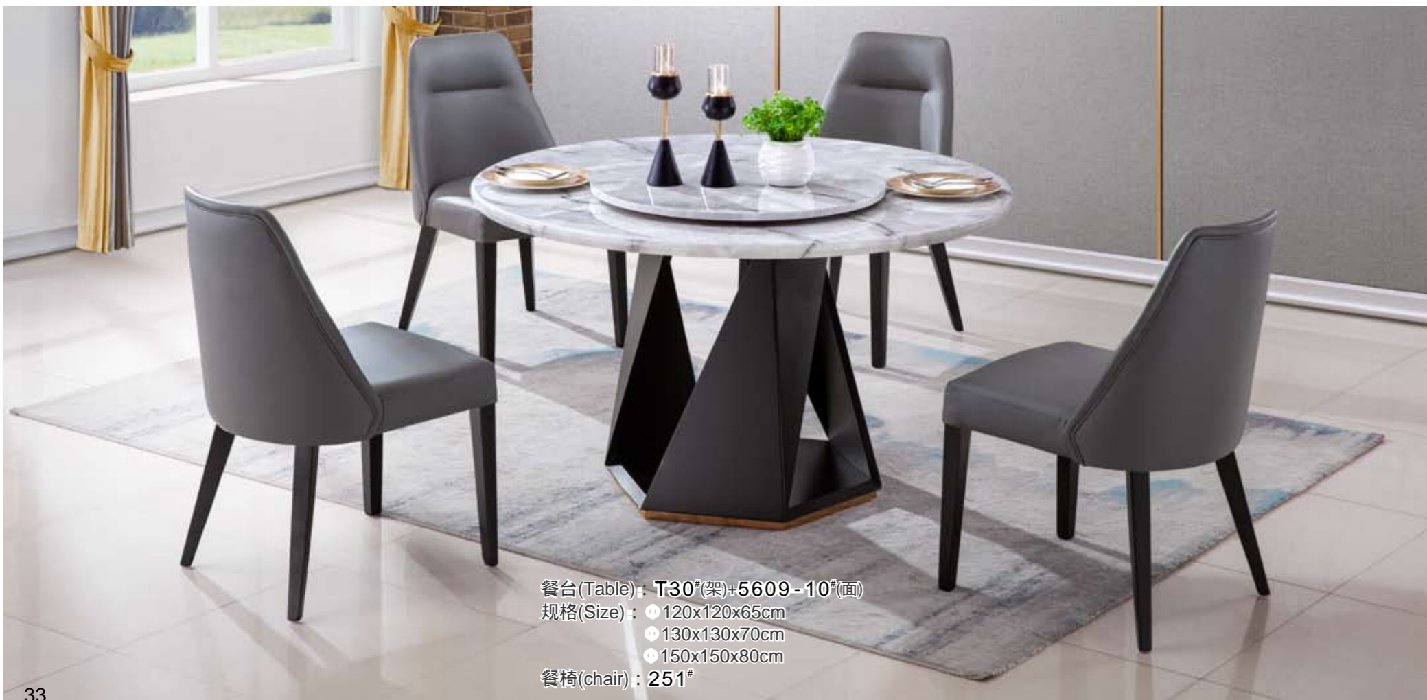
餐台(Table) : T30 # (架)+5609-10 # (面) 规格(Size) : ● 120x120x65cm ● 130x130x70cm ● 150x150x80cm 餐椅(chair) : 251 #