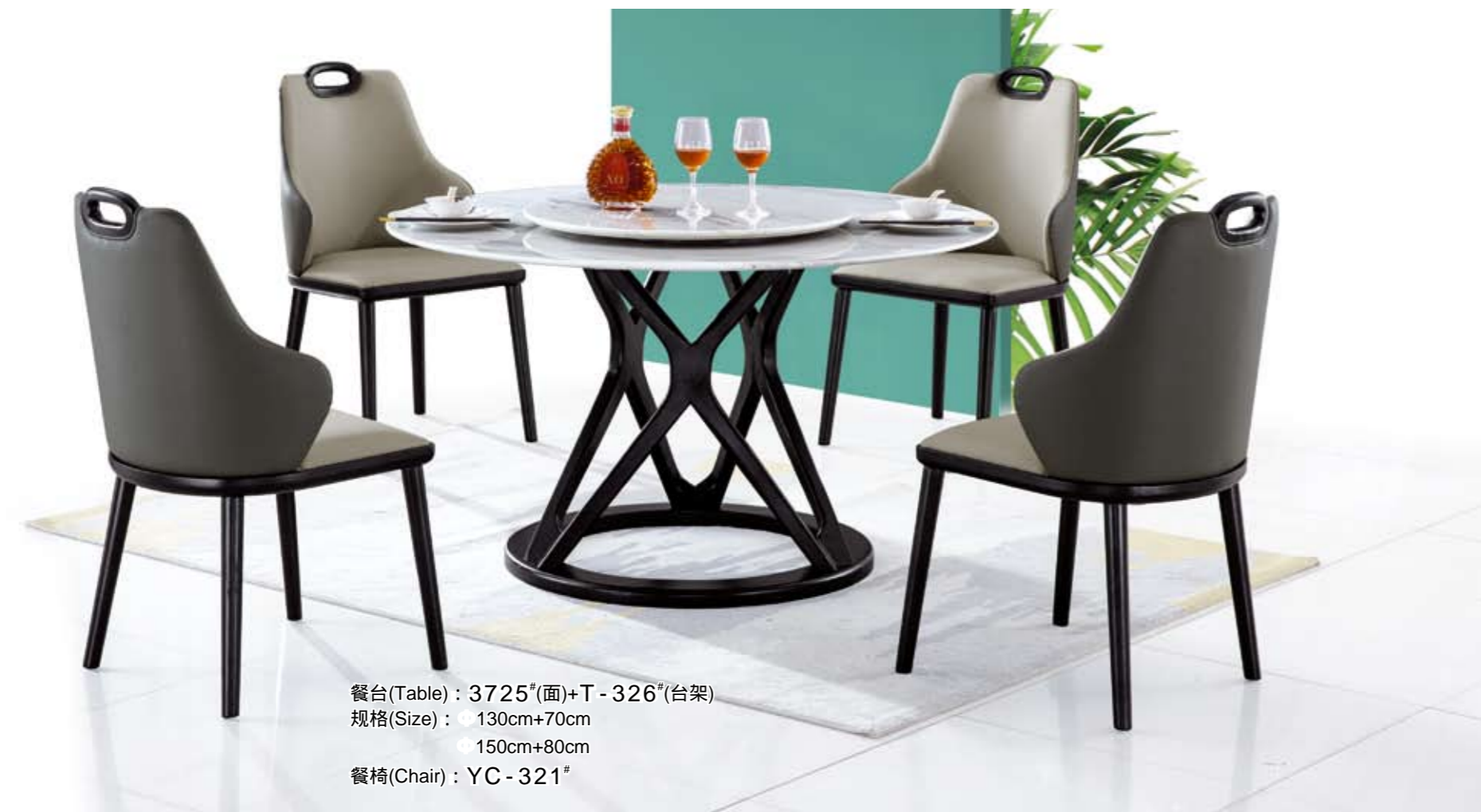
餐台(Table) : 3725 # (面)+T - 326 # (台架) 规格(Size) : \Phi 130cm+70cm \Phi 150cm+80cm 餐椅(Chair) : YC - 321 #