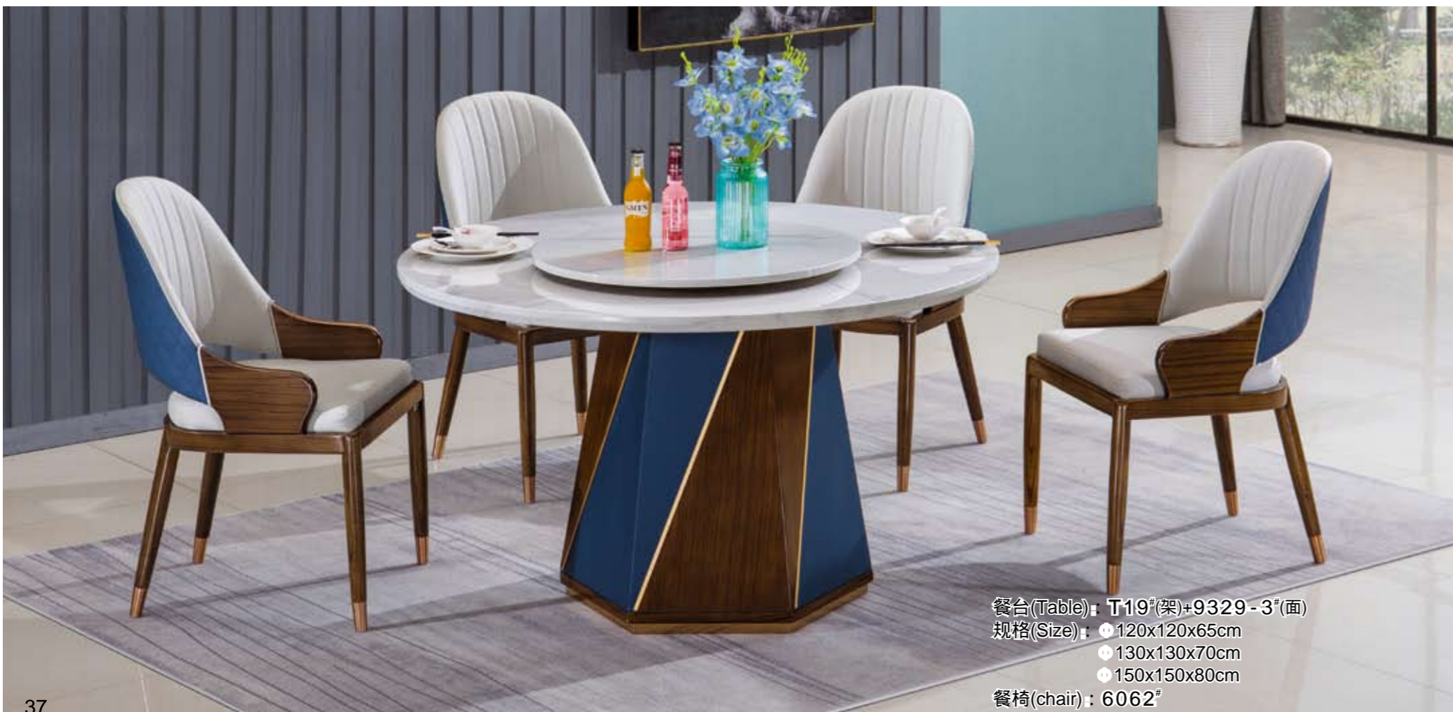
餐台(Table) : T119#(架)+9329-3#(面) 规格(Size) : \phi 120x120x65cm \phi 130x130x70cm \phi 150x150x80cm 餐椅(chair) : 6062#