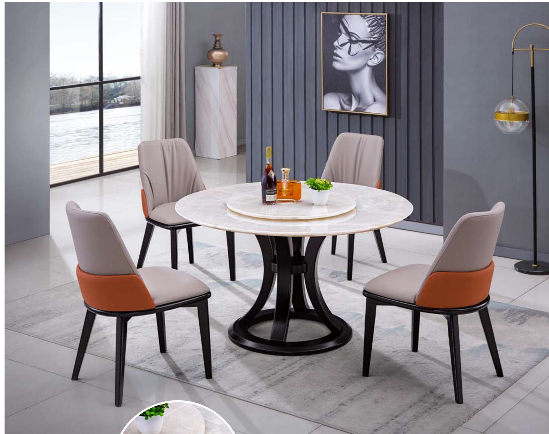
餐台(Table) : 白冰花 # (面)+B08 # (台架) 规格(Size) : 120cm+65cm 130cm+70cm 150cm+80cm 160cm+90cm 餐椅(Chair) : 938浅灰+橙 #