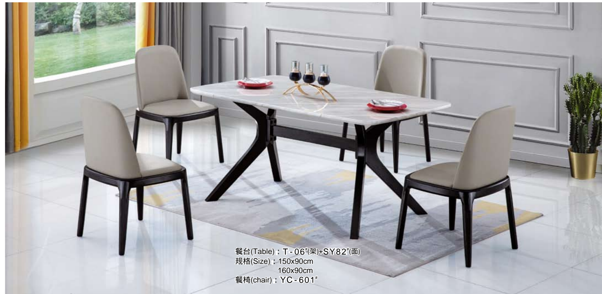
餐台(Table) : T-06 # (架)+SY82 # (面) 规格(Size) : 150x90cm 160x90cm 餐椅(chair) : YC-601 #