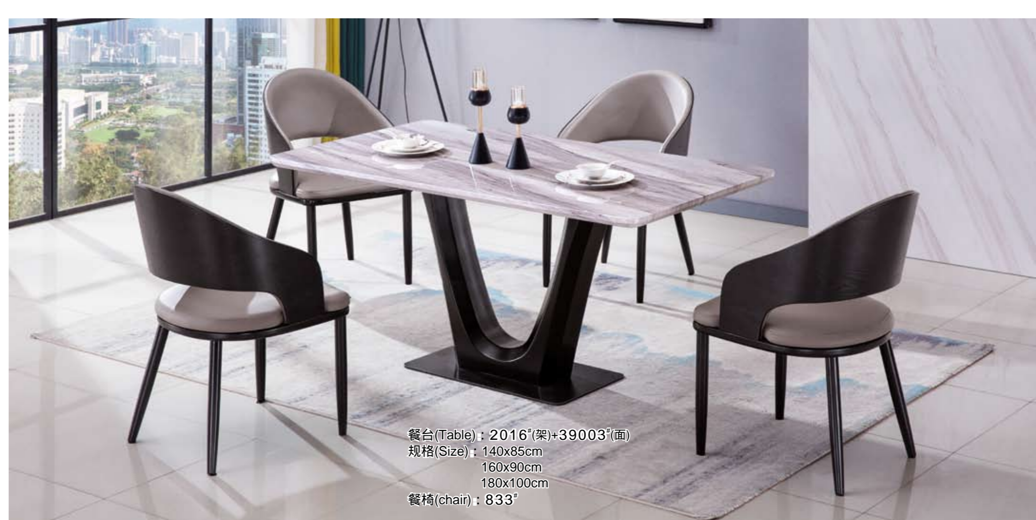
餐台(Table): 2016 # (架)+39003 # (面) 规格(Size): 140x85cm 160x90cm 180x100cm 餐椅(chair): 833 #