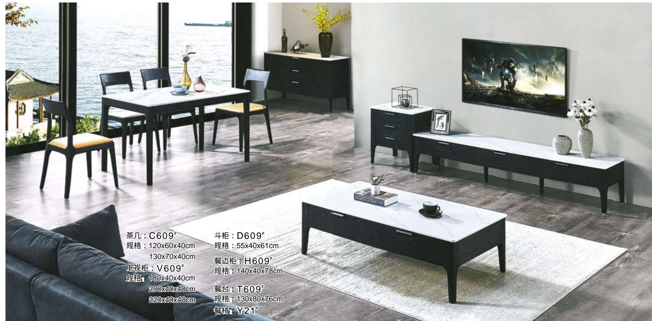
茶几：C609 # 规格：120x60x40cm 130x70x40cm 电视柜：V609 # 规格：180x40x40cm 200x40x40cm 220x40x40cm 斗柜：D609 # 规格：55x40x61cm 餐边柜：H609 # 规格：140x40x78cm 餐台：T609 # 规格：130x80x76cm 餐椅：Y21 #