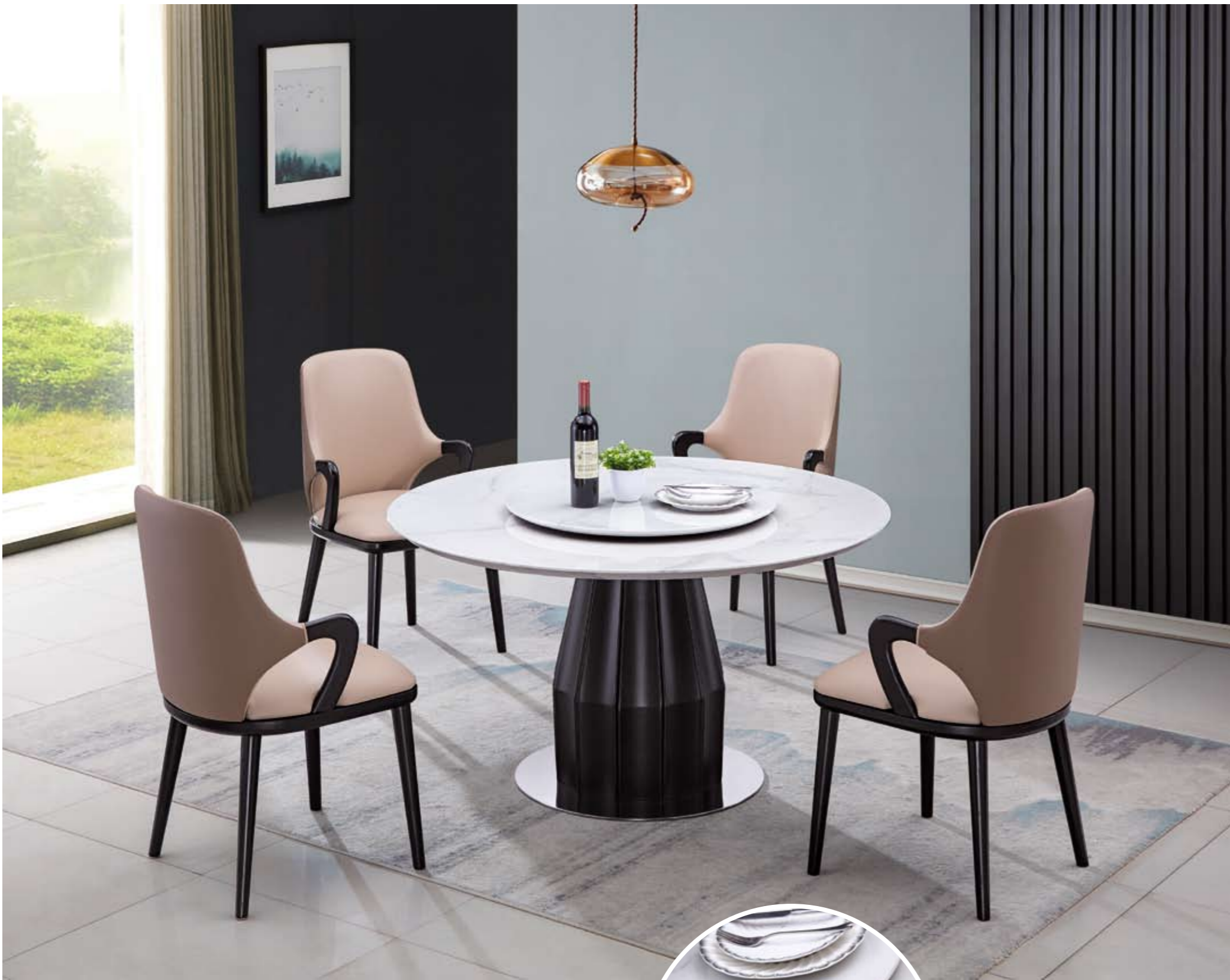
餐台(Table) : 9329 - 3#(面)+8023#(台架) 规格(Size) : 120cm+65cm 130cm+70cm 150cm+80cm 160cm+90cm 餐椅(Chair) : 823#