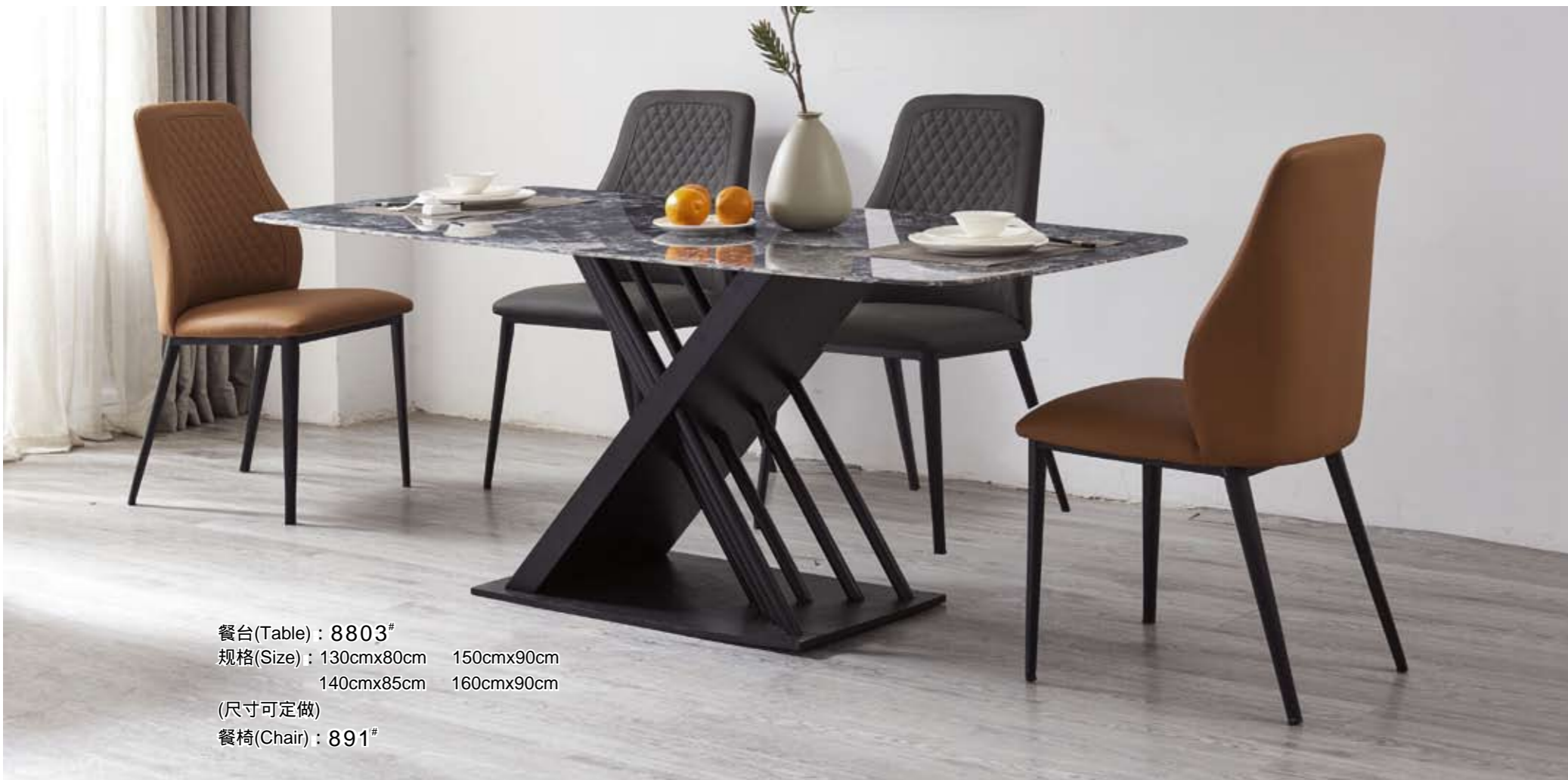
餐台(Table) : 8803 # 规格(Size) : 130cmx80cm 150cmx90cm 140cmx85cm 160cmx90cm (尺寸可定做) 餐椅(Chair) : 891 #