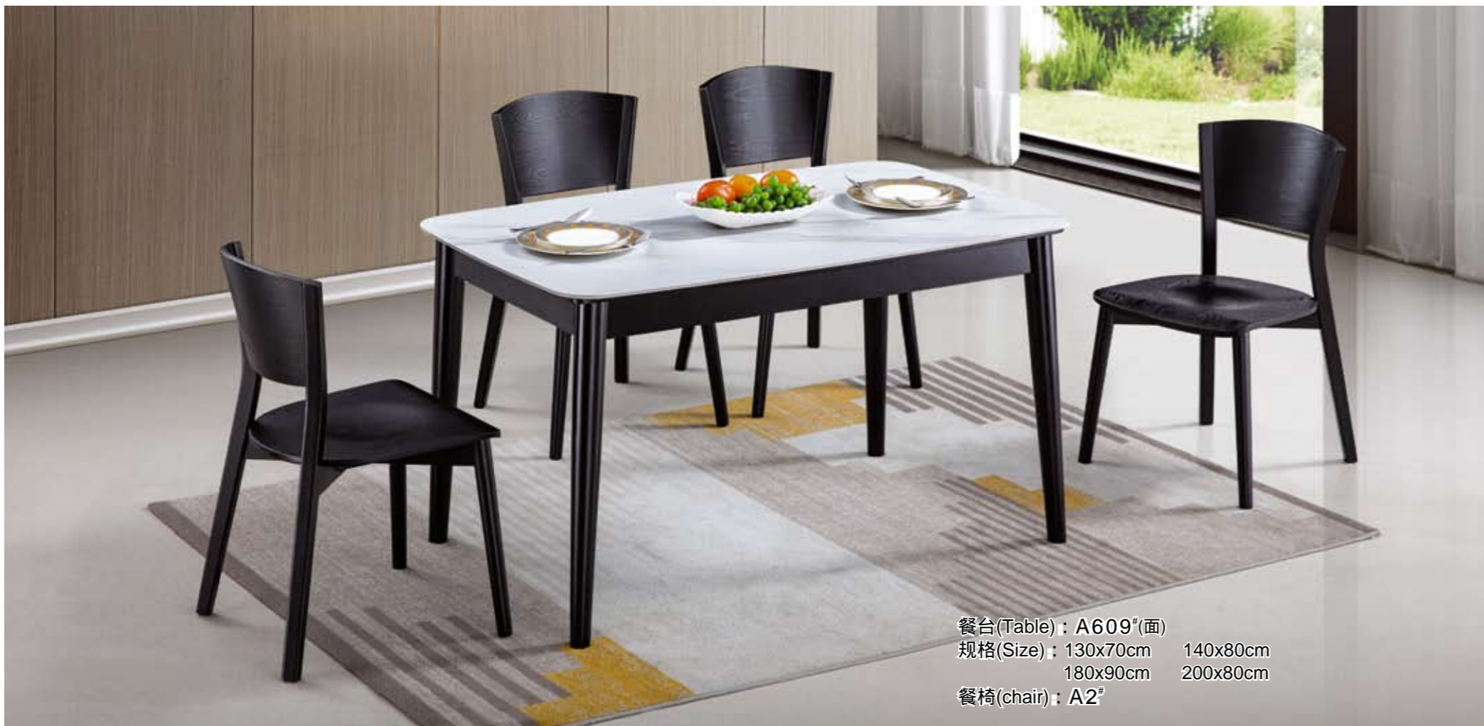
餐台(Table) : A609 # (面) 规格(Size) : 130x70cm 140x80cm 180x90cm 200x80cm 餐椅(chair) : A2 #