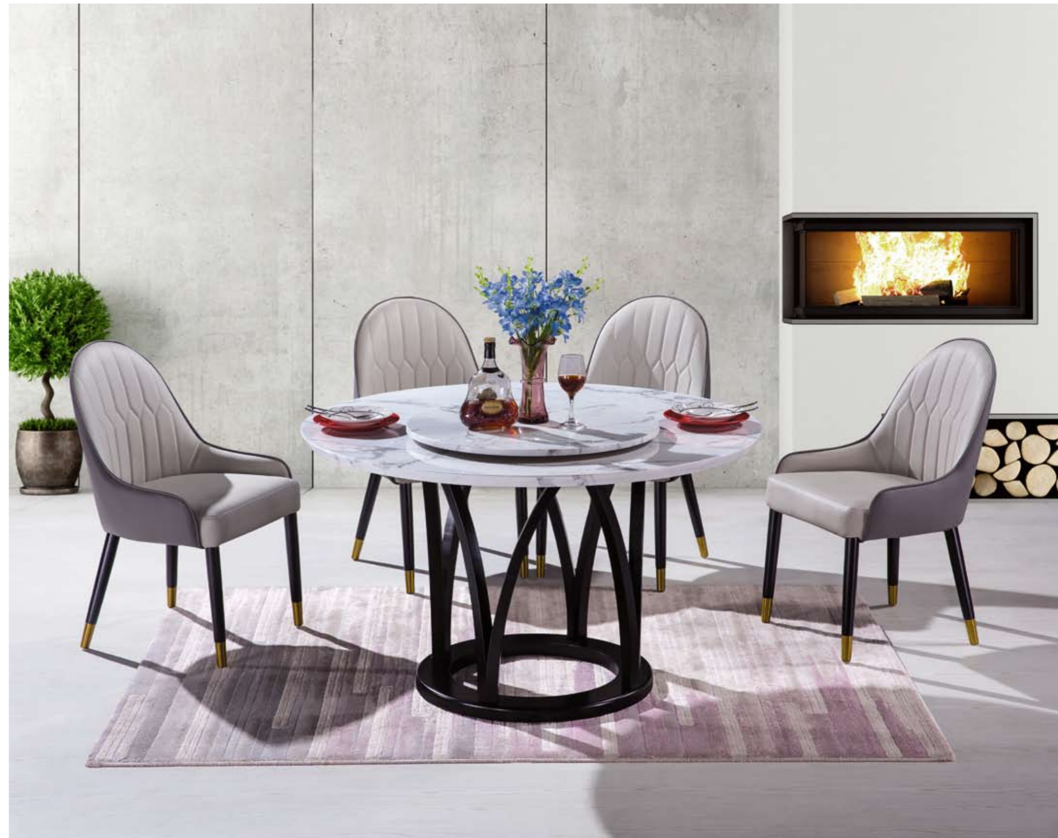
餐台(Table) : 757-1(面)+D526(台架) 规格(Size) : 120cm+65cm 130cm+70cm 150cm+80cm 餐椅(Chair) : 830"

兼具质感与美感的设计方案，最能打动人心，生活在洋溢着派纯美的空间里，与家的情感自然也就更密切了。 The design that has both quality sense and aesthetic sense is most moving. Living in such a space filled with pure beauty, we certainly have a closer passion for home.