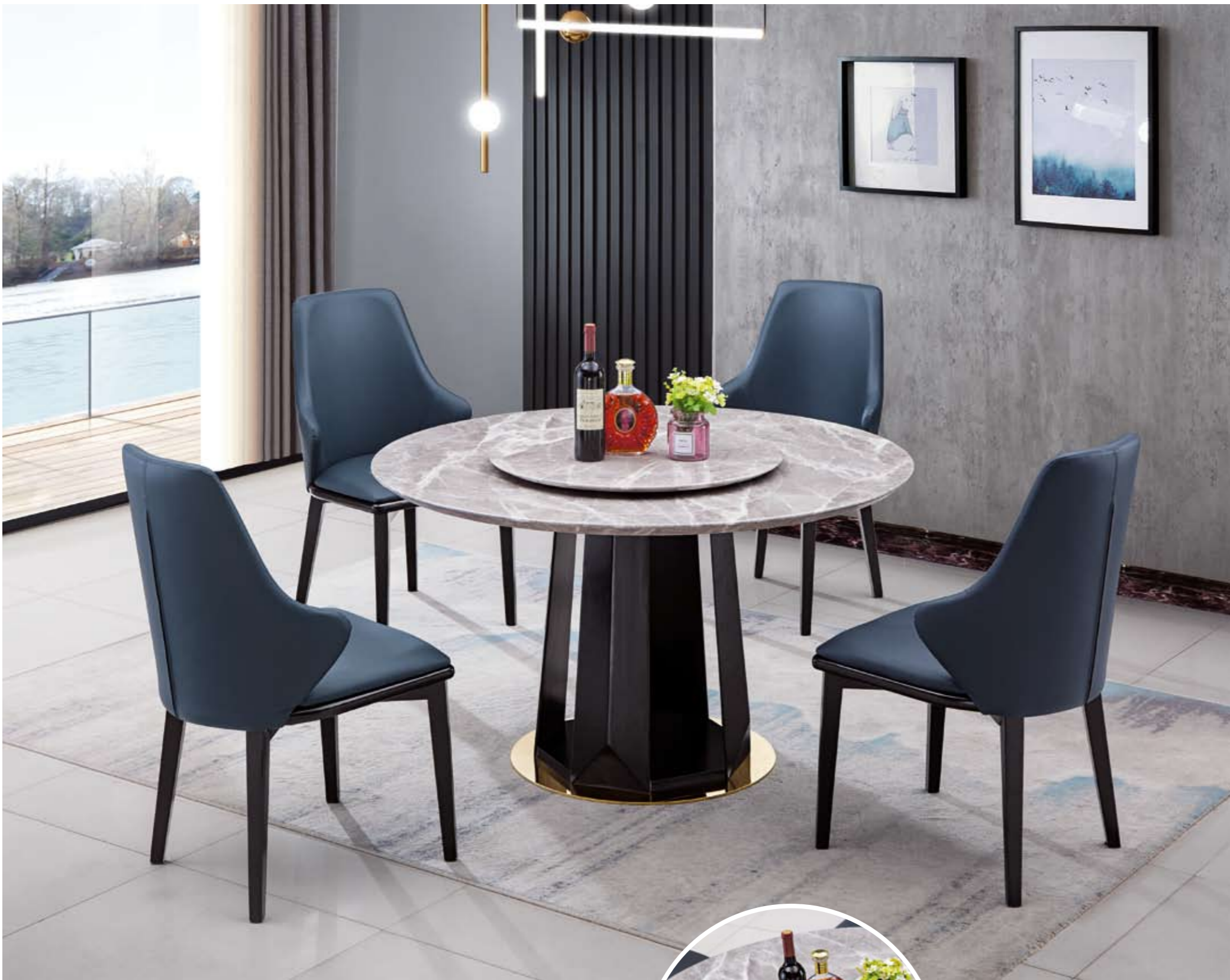
餐台(Table) : 189 - 1"(面)+852"(台架) 规格(Size) : 120cm+65cm 130cm+70cm 150cm+80cm 160cm+90cm 餐椅(Chair) : 931#