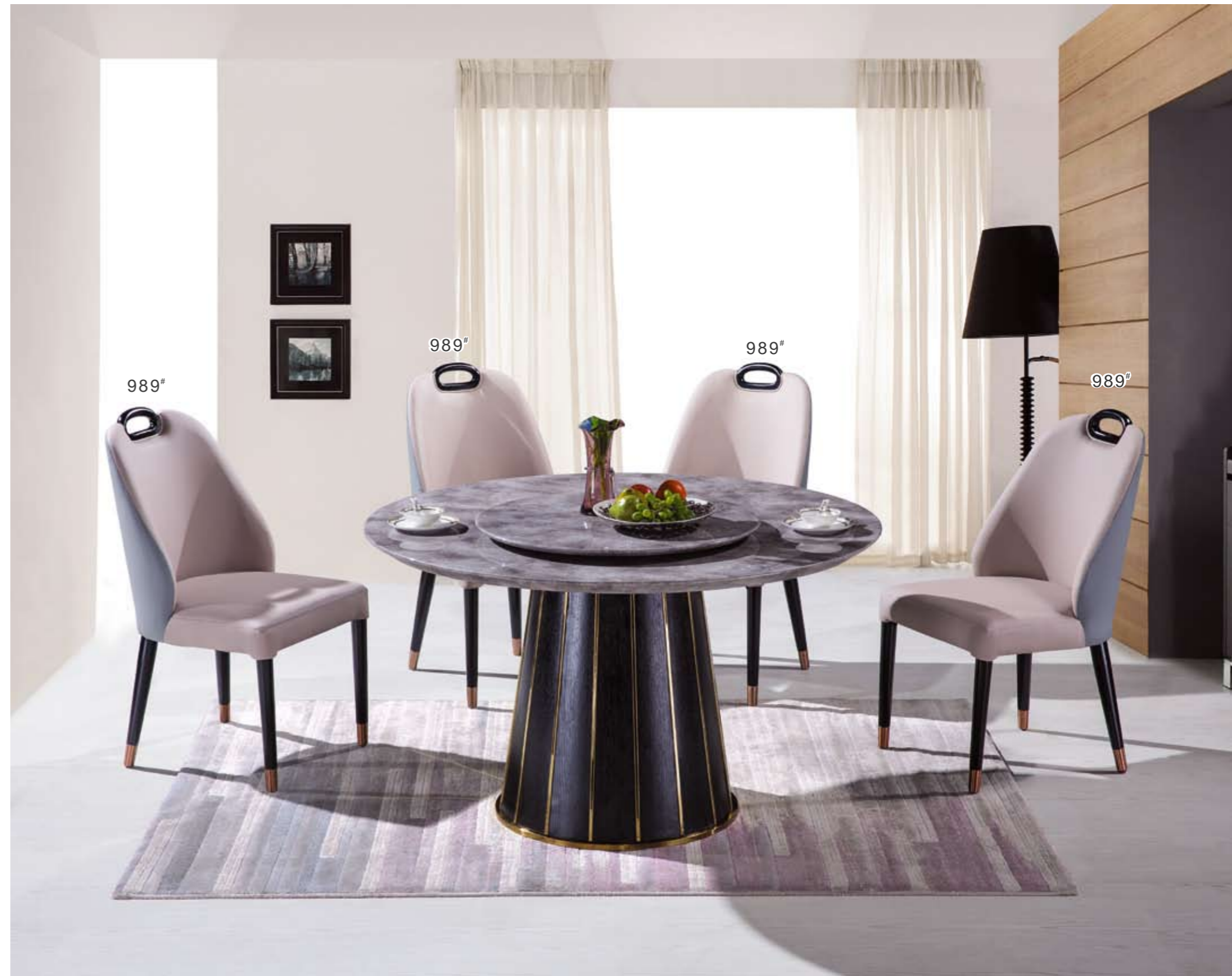
餐台(Table) : 3720"(面)+838"(台架) 规格(Size) : 120cm+65cm 130cm+70cm 150cm+80cm 餐椅(Chair) : 989"

前卫的造型设计彰显个性，既给你带来舒适与享受，又是让你赏心悦目的艺术珍品。 Trendy designs demonstrate personality, bringing you both comfort and enjoyment, giving you art treasures pleasing to both eye and mind.