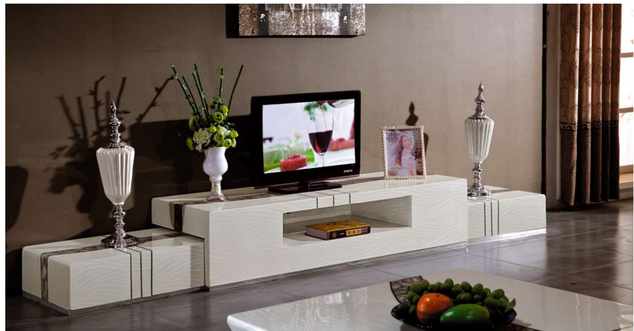
地柜(Floor Cabinet): T77# 规格(Size): 180cm x 45cm 200cm x 45cm 240cm x 45cm 280cm x 45cm 300cm x 45cm (尺寸可订做)

家是心灵停靠的港湾，在快节奏的都市生活中，加显得更为珍贵。在家具世界里为你度身配套的时尚家居设计中，用最灵巧的手法去演绎家的艺术。点点滴滴的细节都能感受到超越时尚的设计风格。