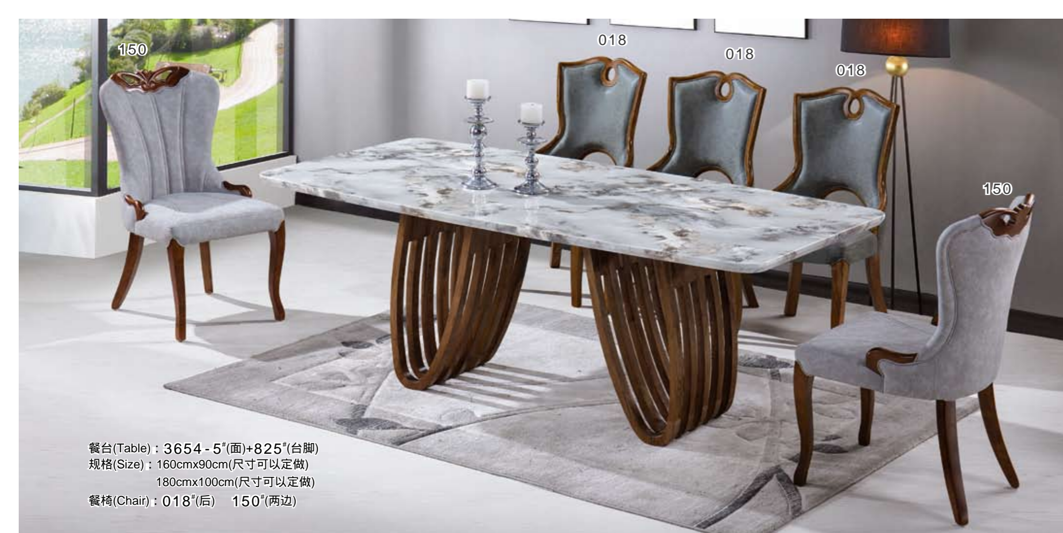
150 018 018 018 150 餐台(Table) : 3654 - 5"(面)+825"(台脚) 规格(Size) : 160cmx90cm(尺寸可以定做) 180cmx100cm(尺寸可以定做) 餐椅(Chair) : 018"(后) 150"(两边)