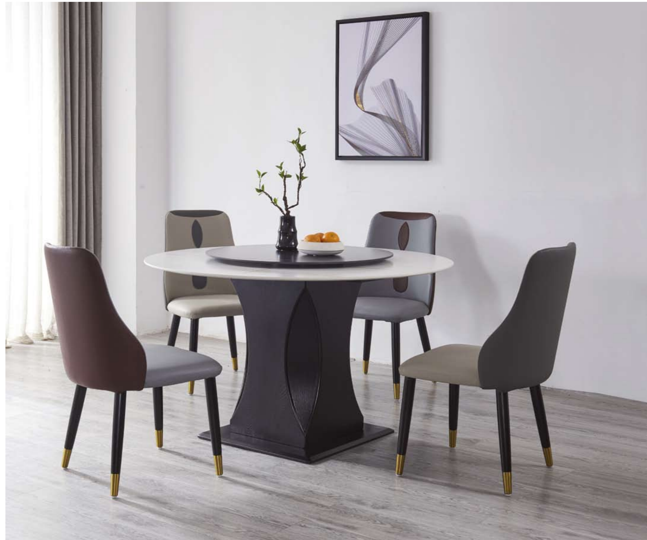
餐台(Table) : 3996-3#+9801#(台脚) 规格(Size) : 120cmx65cm 150cmx80cm 130cmx70cm (尺寸可定做) 餐椅(Chair) : 866#