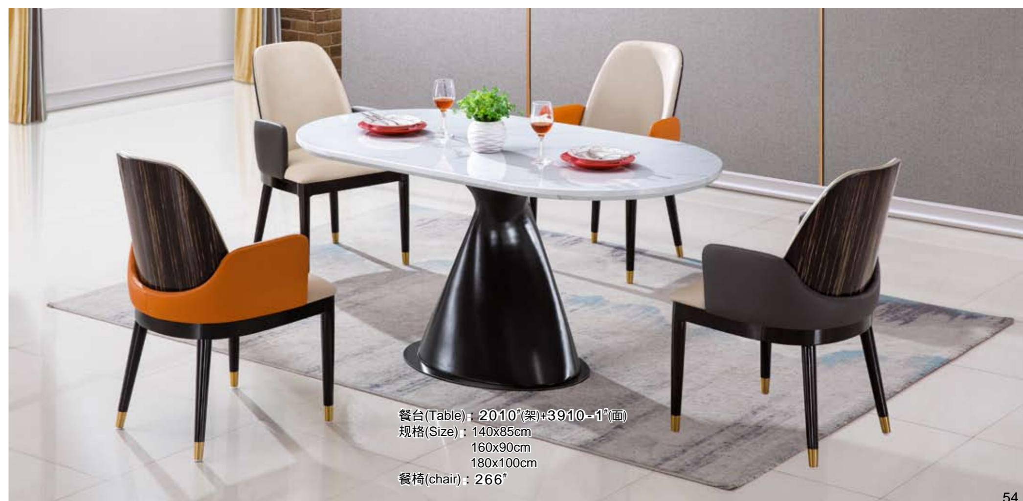
餐台(Table): 2010 # (架)+3910-1 # (面) 规格(Size): 140x85cm 160x90cm 180x100cm 餐椅(chair): 266 #