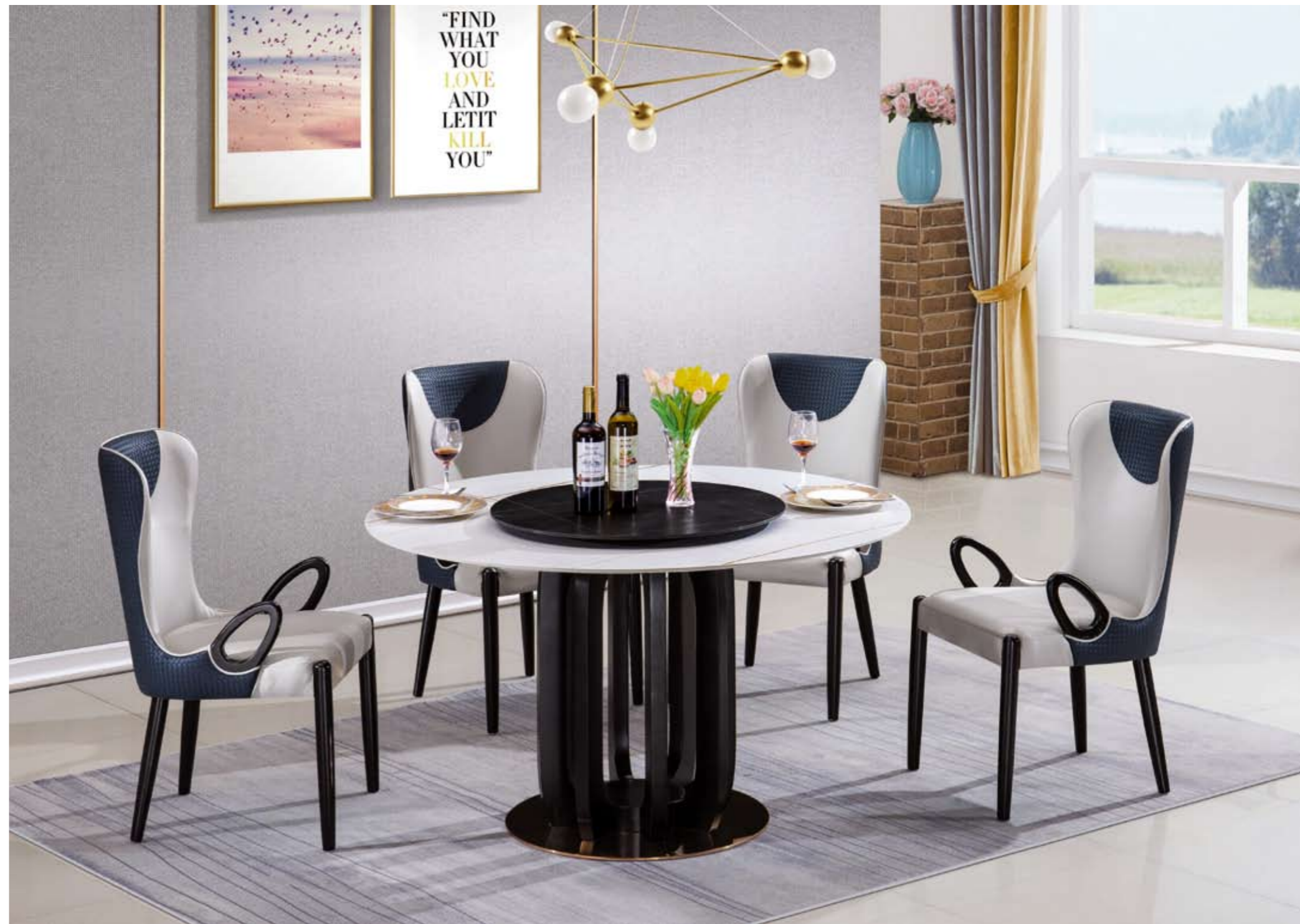
↑ 餐台(Table) : T13 # (架)+劳伦白金+劳伦黑金(面) 规格(Size) : 120x120x65cm 130x130x70cm 150x150x80cm 餐椅(chair) : 249 #