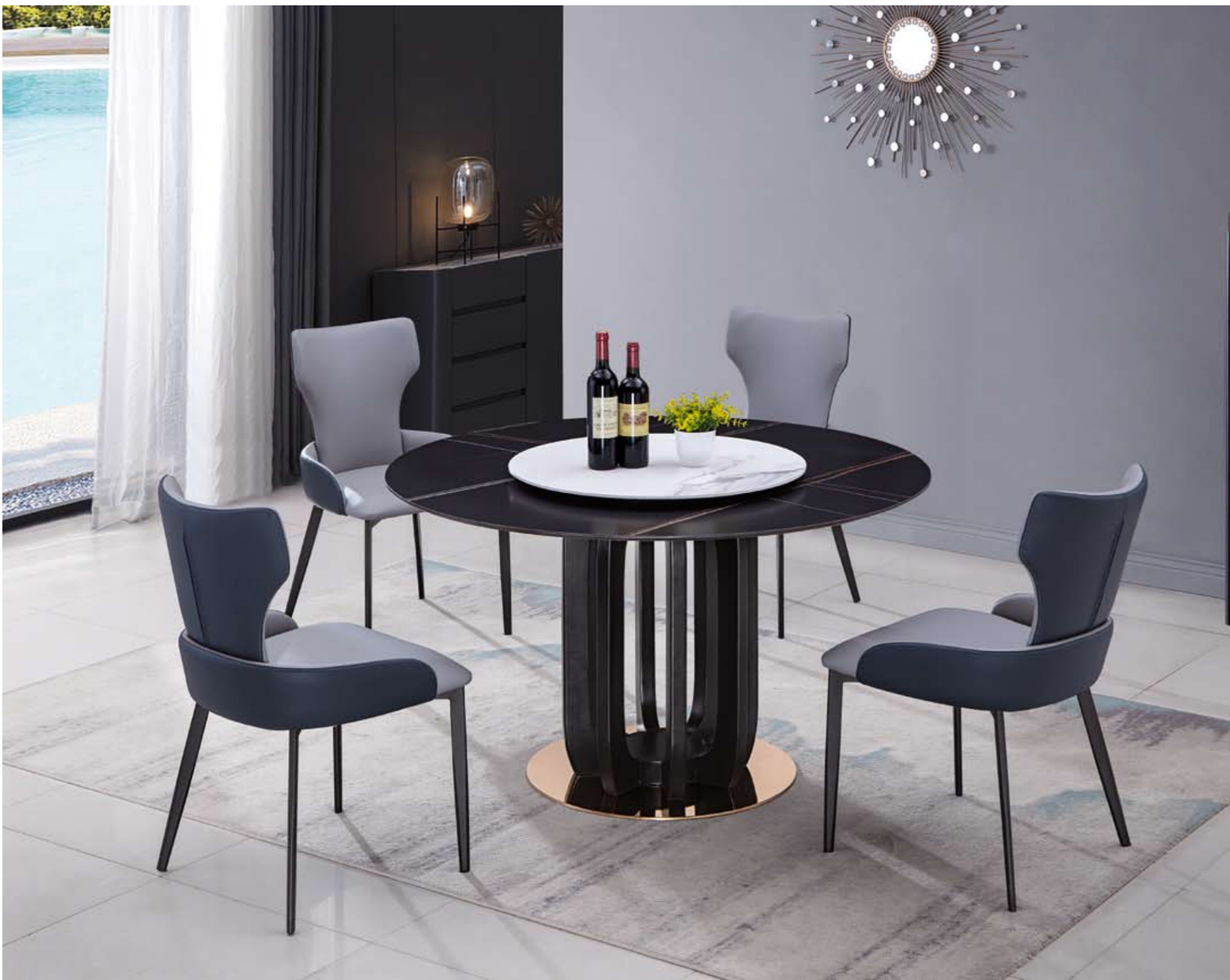
餐台(Table) : 劳黑+劳白 # (面)+B02 # (台架) 规格(Size) : 120cm+65cm 130cm+70cm 150cm+80cm 160cm+90cm 餐椅(Chair) : 658 #