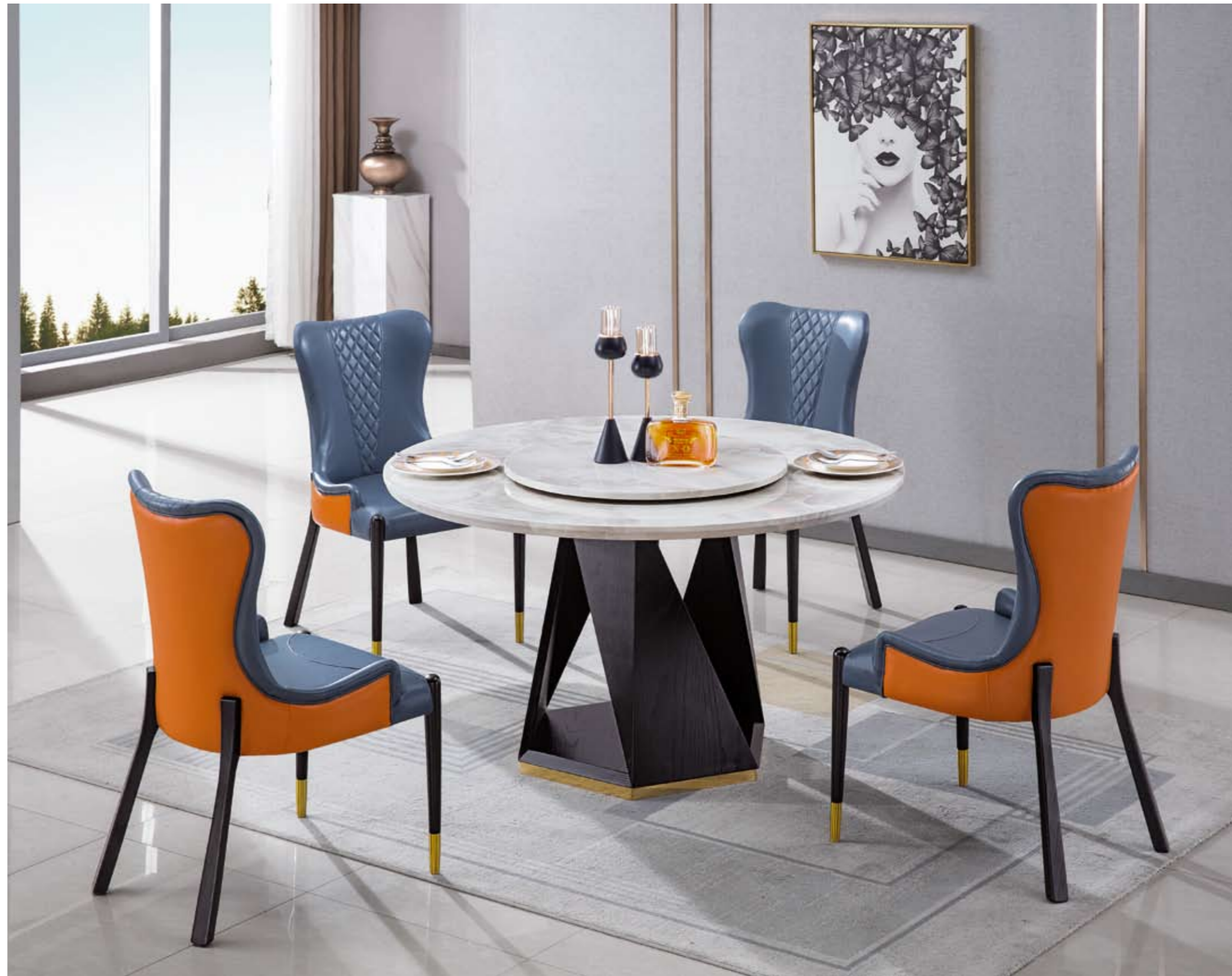
餐台(Table) : 62087 - 1 ® (面)+318 ® (台架) 规格(Size) : 120cm+65cm 130cm+70cm 150cm+80cm 160cm+90cm 餐椅(Chair) : 1011 ®