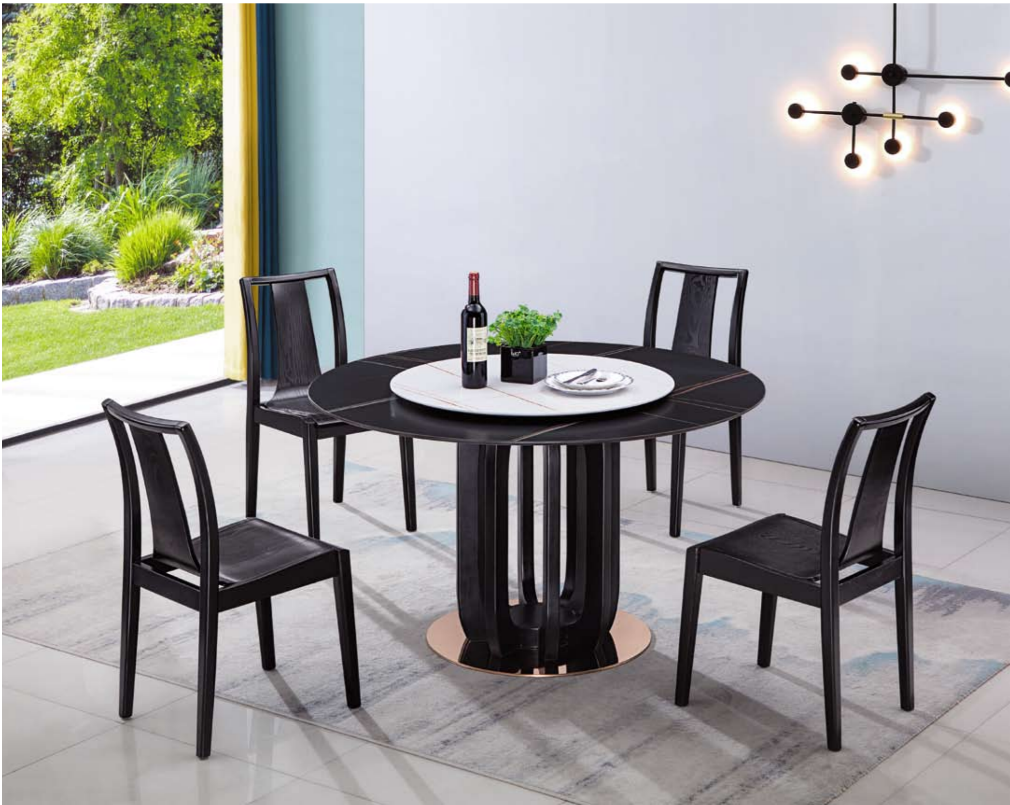
餐台(Table) : 劳黑+劳白 # (面)+B02 # (台架) 规格(Size) : 120cm+65cm 130cm+70cm 150cm+80cm 160cm+90cm 餐椅(Chair) : 000000 #