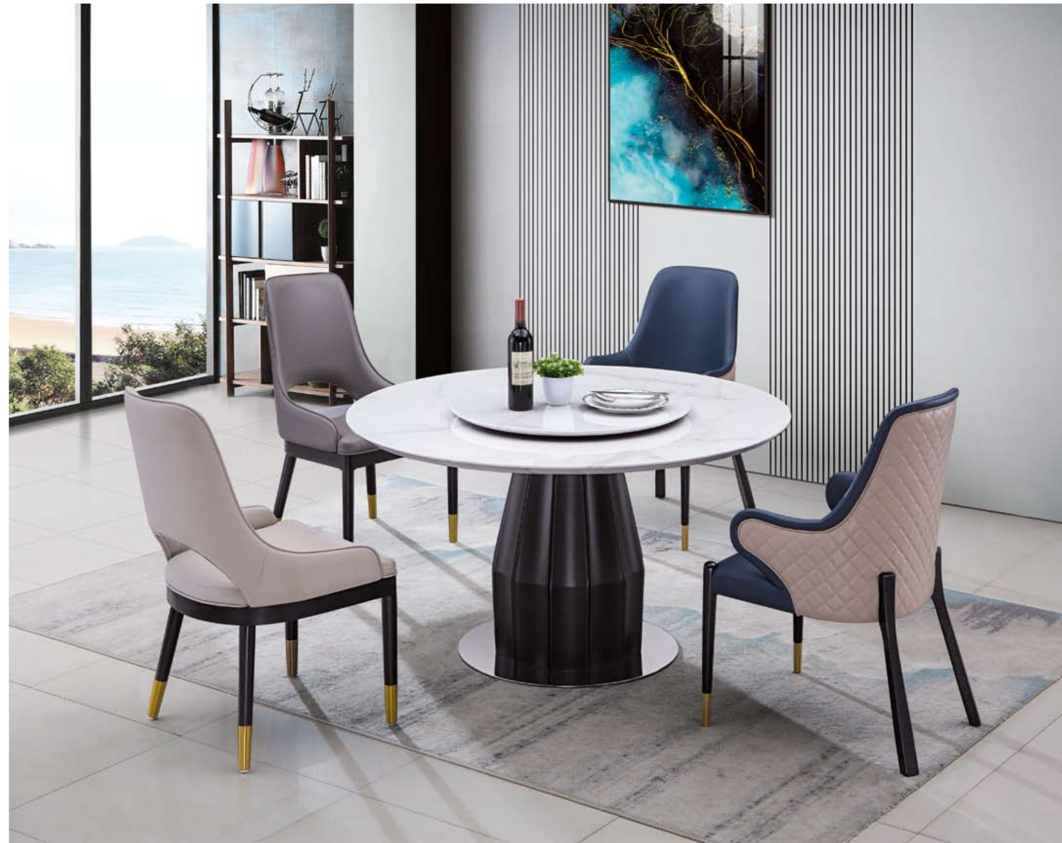
餐台(Table) : 9329 - 3#(面)+8023#(台架) 规格(Size) : 120cm+65cm 130cm+70cm 150cm+80cm 160cm+90cm 餐椅(Chair) : 1009#

Simple Shapes 造型简洁、线条流畅，大方中渗透着灵气，自然中蕴藏珍贵。 and smooth lines, elegant and spirited, natural and precious