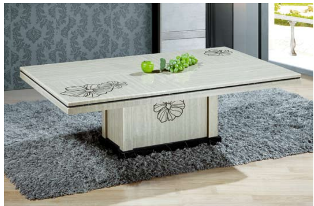
茶几(Tea Table): B75# 印花石脚茶几 规格(Size): 80cm x 80cm 130cm x 80cm 140cm x 85cm 150cm x 90cm (尺寸可订做)