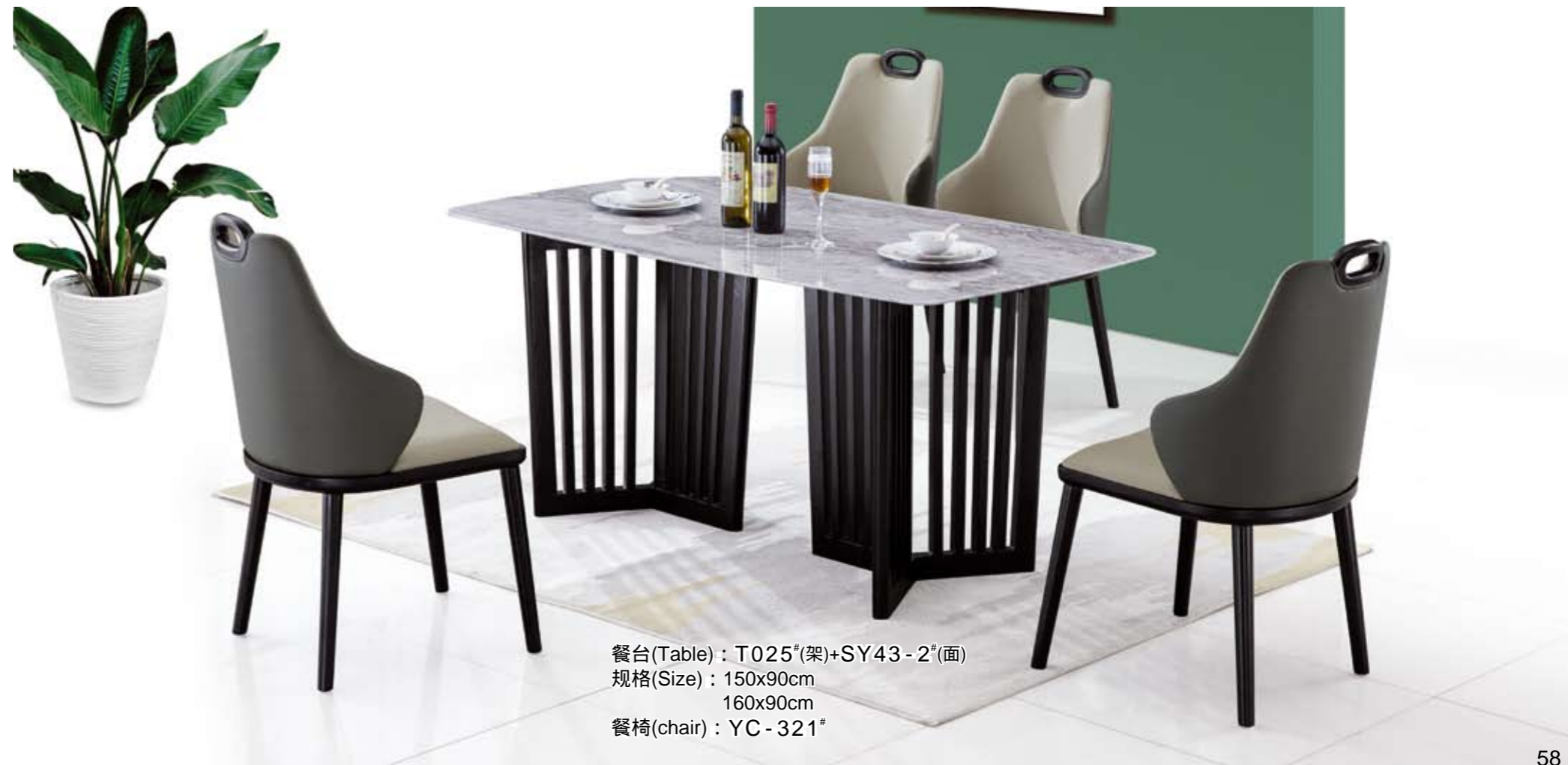
餐台(Table) : T025 # (架)+SY43-2 # (面) 规格(Size) : 150x90cm 160x90cm 餐椅(chair) : YC-321 #