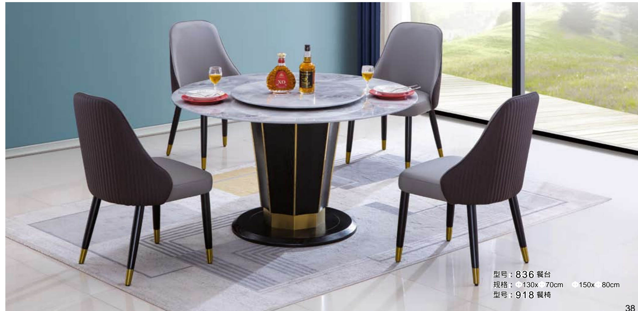
型号 : 836 餐台 规格 : \phi 130x \phi 70cm \phi 150x 80cm 型号 : 918 餐椅