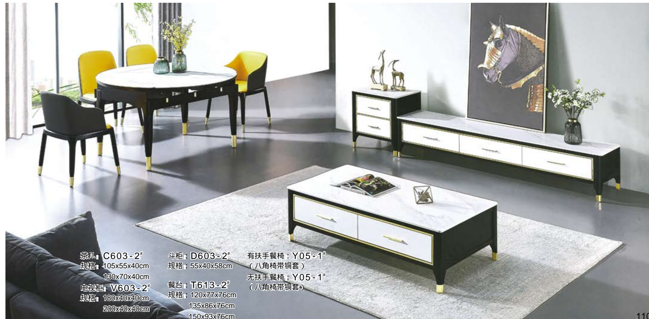
茶几：C603-2 # 规格：105x55x40cm 130x70x40cm 电视柜：V603-2 # 规格：180x40x40cm 200x40x40cm 斗柜：D603-2 # 规格：55x40x58cm 餐台：T613-2 # 规格：120x77x76cm 135x86x76cm 150x93x76cm 有扶手餐椅：Y05-1 # (八角椅带铜套) 无扶手餐椅：Y05-1 # (八角椅带铜套)