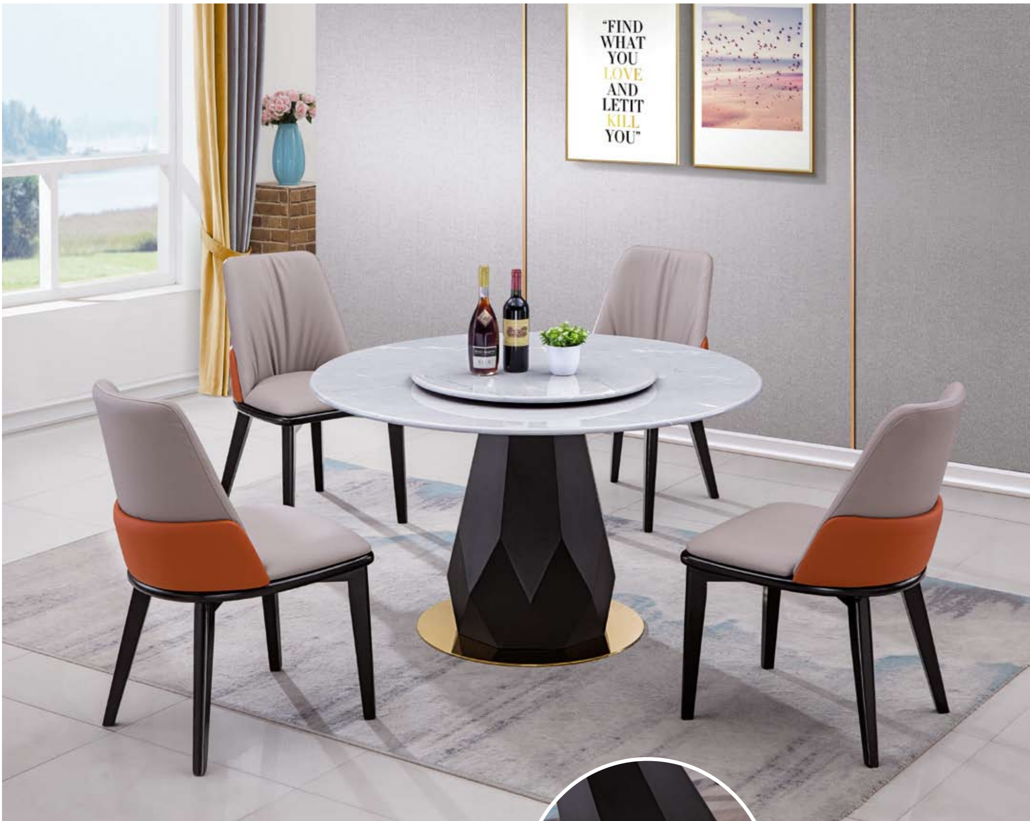
餐台(Table) : 3920 # (面)+8050 # (台架) 规格(Size) : 120cm+65cm 130cm+70cm 150cm+80cm 160cm+90cm 餐椅(Chair) : 938浅灰+橙 #