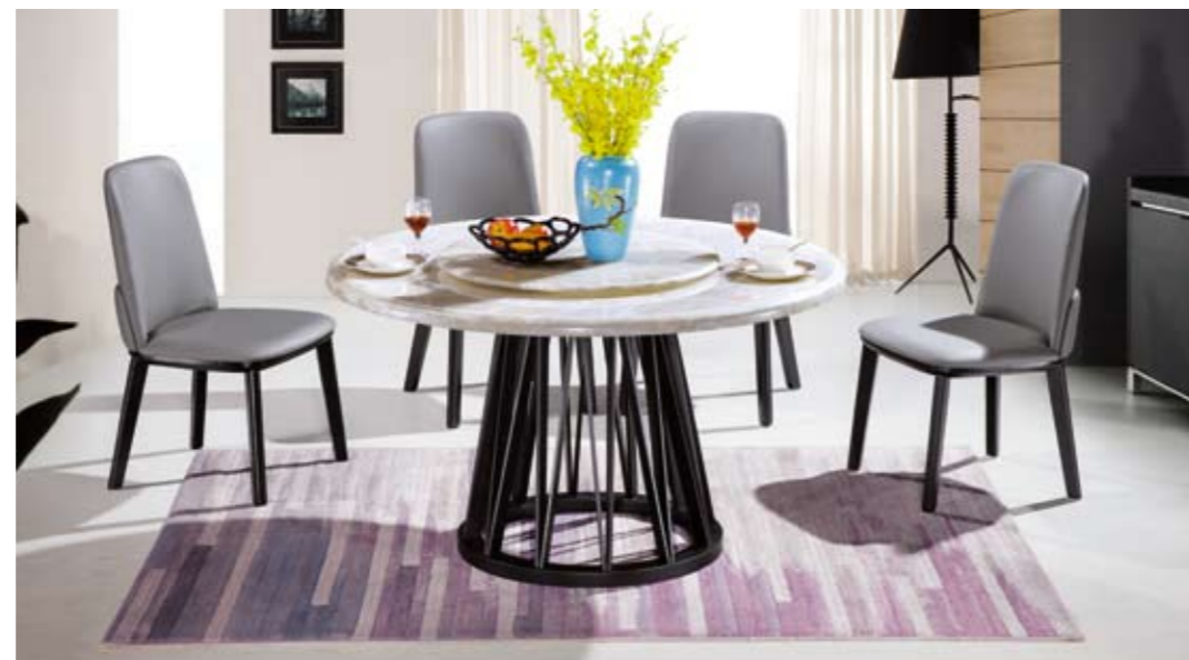
餐台(Table) : T08 # (架)+A # 白玉(面) → 规格(Size) : 120x120x65cm 130x130x70cm 150x150x80cm 餐椅(chair) : 226 #