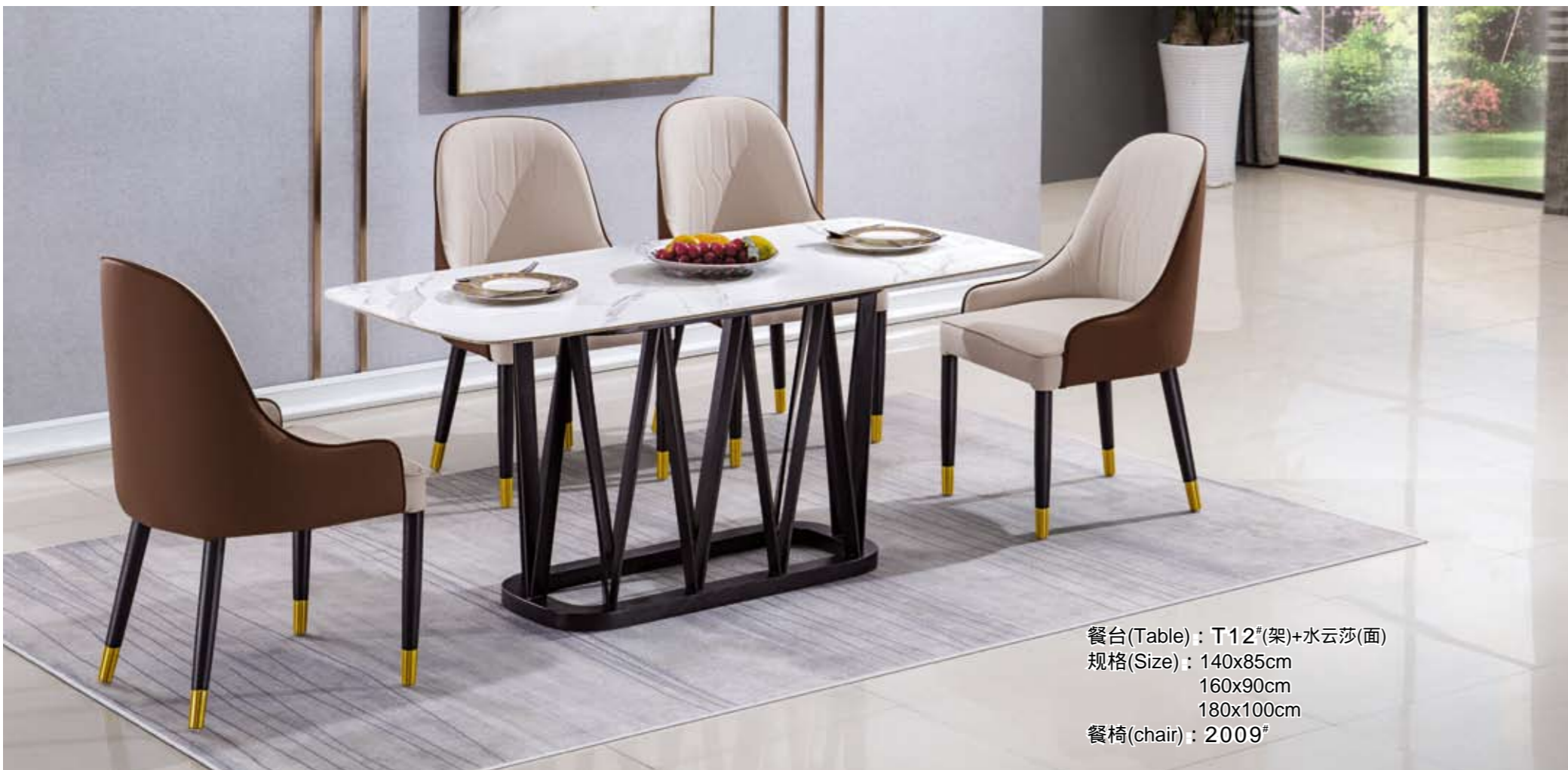
餐台(Table) : T12 # (架)+水云莎(面) 规格(Size) : 140x85cm 160x90cm 180x100cm 餐椅(chair) : 2009 #