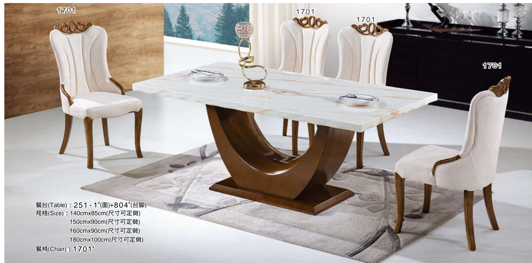
1701 1701 1701 1701 餐台(Table) : 251 - 1"(面)+804"(台脚) 规格(Size) : 140cmx85cm(尺寸可定做) 150cmx90cm(尺寸可定做) 160cmx90cm(尺寸可定做) 180cmx100cm(尺寸可定做) 餐椅(Chair) : 1701"