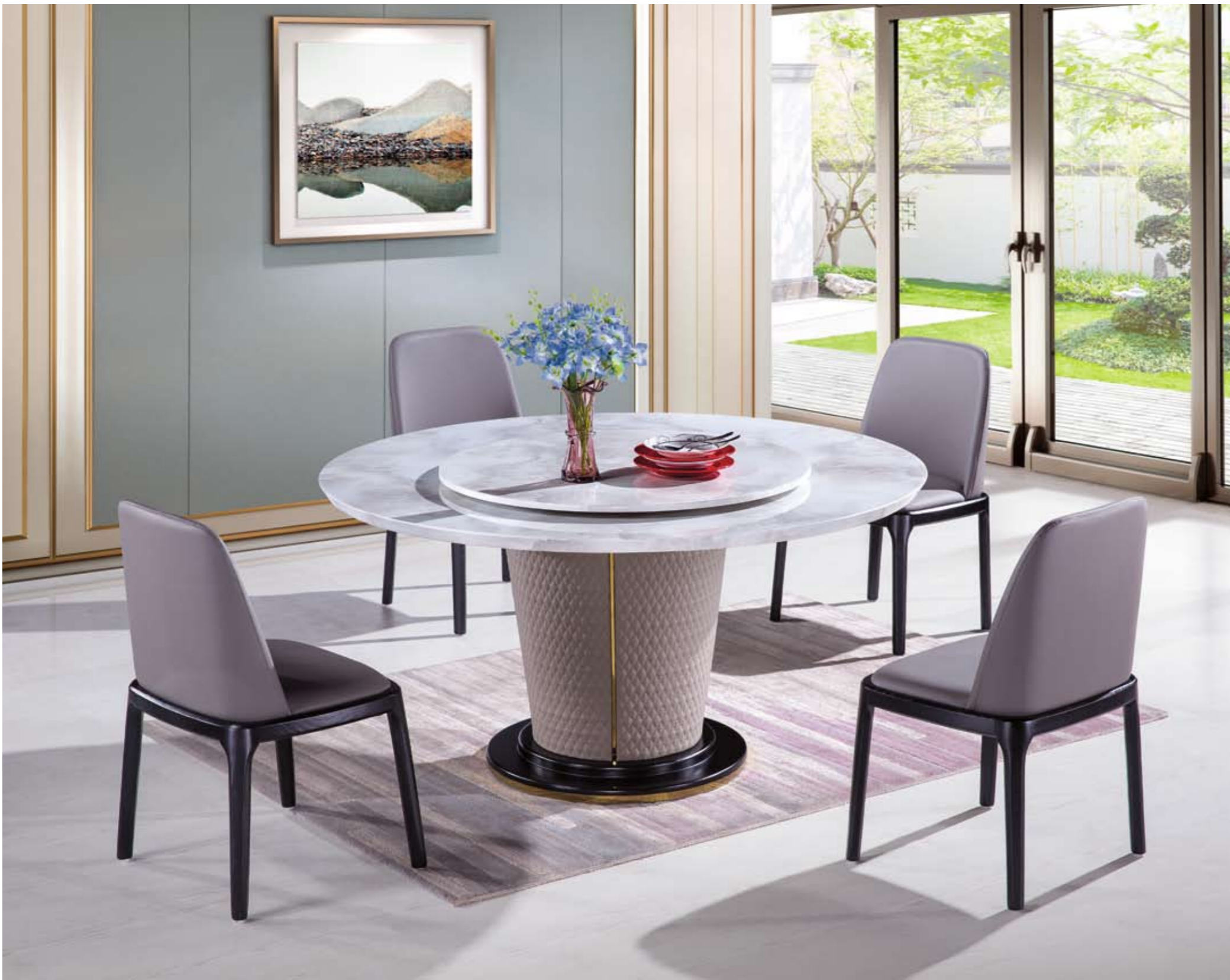
餐台(Table) : 62087 - 1"(面)+N05"(台架) 规格(Size) : 120cm+65cm 130cm+70cm 150cm+80cm 餐椅(Chair) : 1005"(无扶手)

前卫的造型设计彰显个性，既给你带来舒适与享受，又是让你赏心悦目的艺术珍品。 Trendy designs demonstrate personality, bringing you both comfort and enjoyment, giving you art treasures pleasing to both eye and mind.