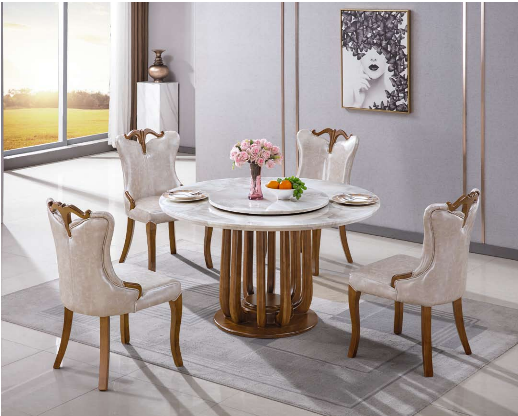
餐台(Table) : 8号 # (架)+62087-1 # (面) 规格(Size) : 120cm+65cm 130cm+70cm 150cm+80cm 160cm+90cm 餐椅(chair) : 6040 #