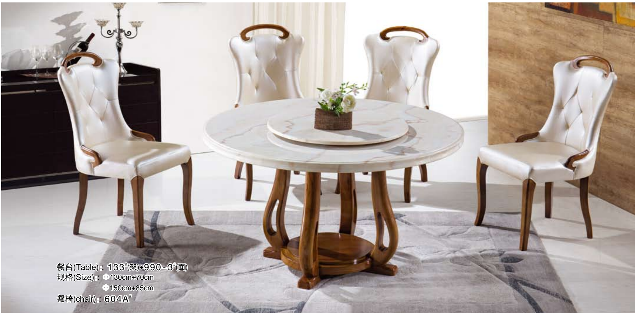
餐台(Table) : 133 # (架)+990-3 # (面) 规格(Size) : ● 130cm+70cm ● 150cm+85cm 餐椅(chair) : 604A #