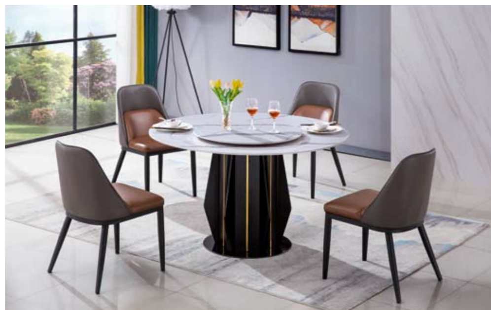
餐台(Table) : 2019 # (架)+(卡金岩板) 规格(Size) : 120x120x65cm 130x130x70cm 150x150x80cm 餐椅(chair) : D35 #