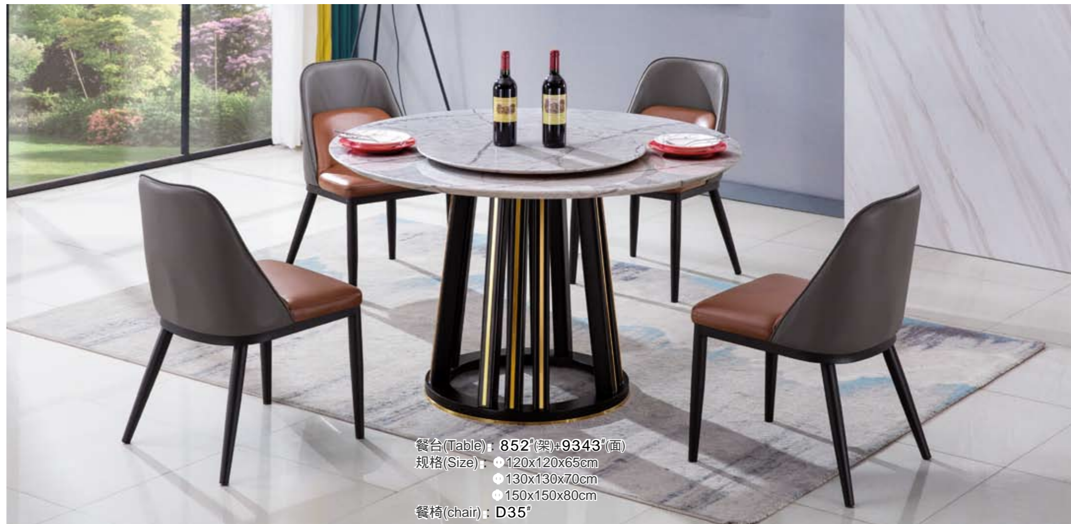
餐台(Table) : 852 # (架)+9343 # (面) 规格(Size) : 120x120x65cm 130x130x70cm 150x150x80cm 餐椅(chair) : D35 #