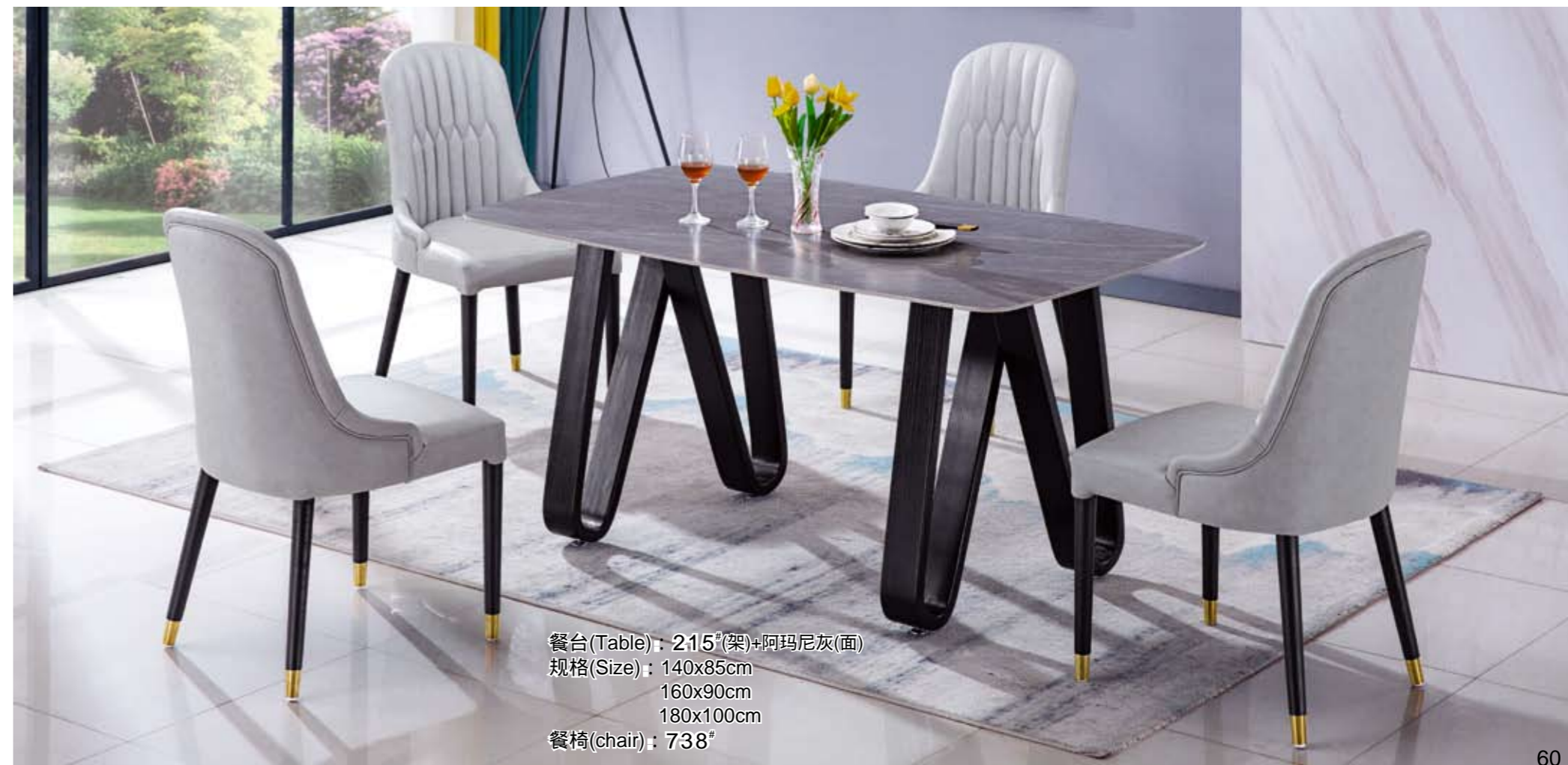
餐台(Table) : 215 # (架)+阿玛尼灰(面) 规格(Size) : 140x85cm 160x90cm 180x100cm 餐椅(chair) : 738 #