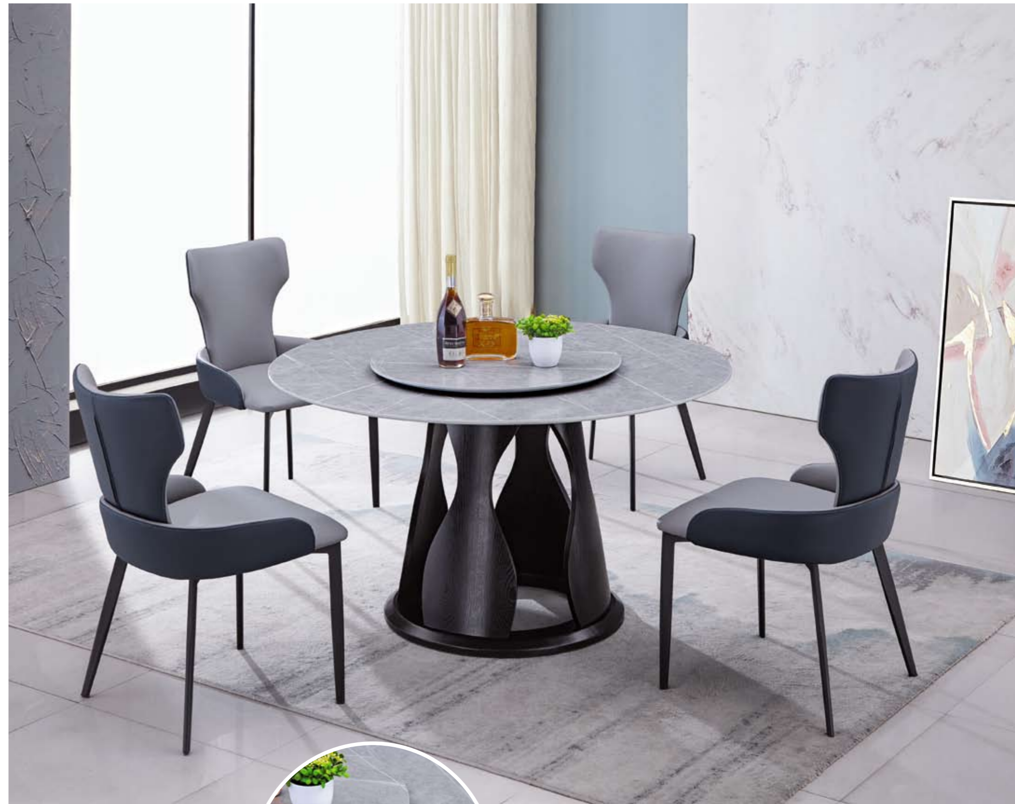
餐台(Table) : 阿玛尼灰 ® (面)+B05 ® (台架) 规格(Size) : 120cm+65cm 130cm+70cm 150cm+80cm 160cm+90cm 餐椅(Chair) : 658 ®