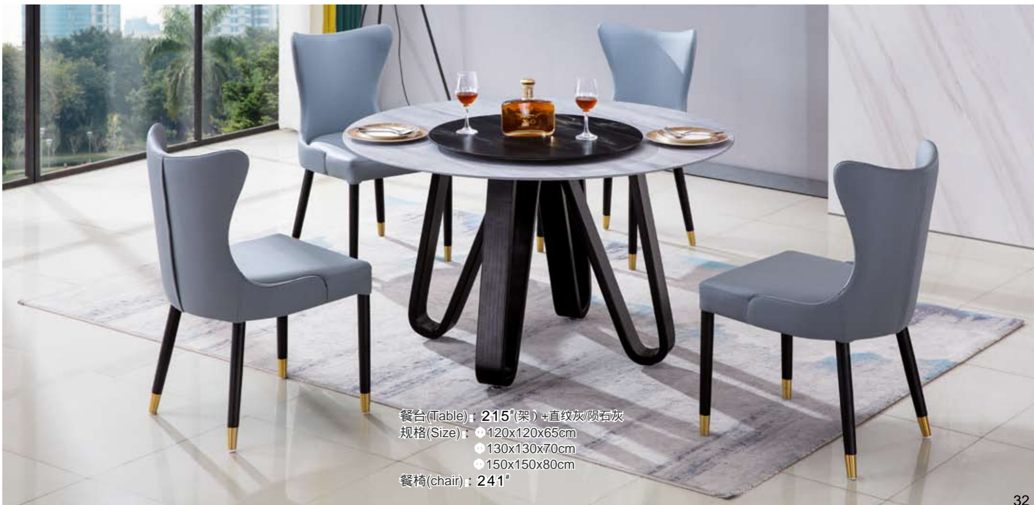
餐台(Table) : 215 # (架)+直纹灰/陨石灰 规格(Size) : 120x120x65cm 130x130x70cm 150x150x80cm 餐椅(chair) : 241 #