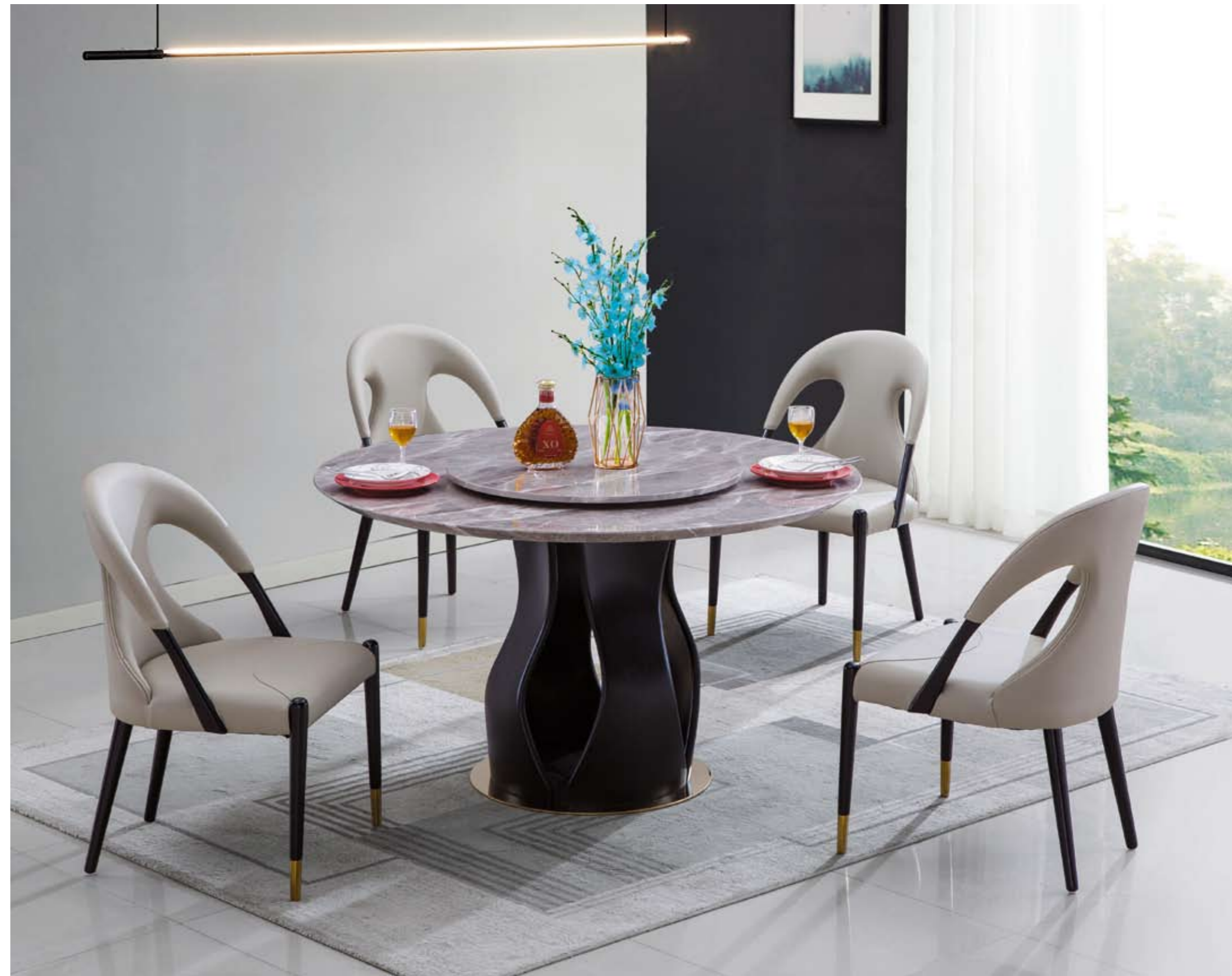
餐台(Table) : 189-1 # (面)+688 # (台架) 规格(Size) : 120cm+65cm 130cm+70cm 150cm+80cm 餐椅(Chair) : 1016 #

前卫的造型设计彰显个性，既给你带来舒适与享受，又是让你赏心悦目的艺术珍品。 Trendy designs demonstrate personality, bringing you both comfort and enjoyment, giving you art treasures pleasing to both eye and mind.