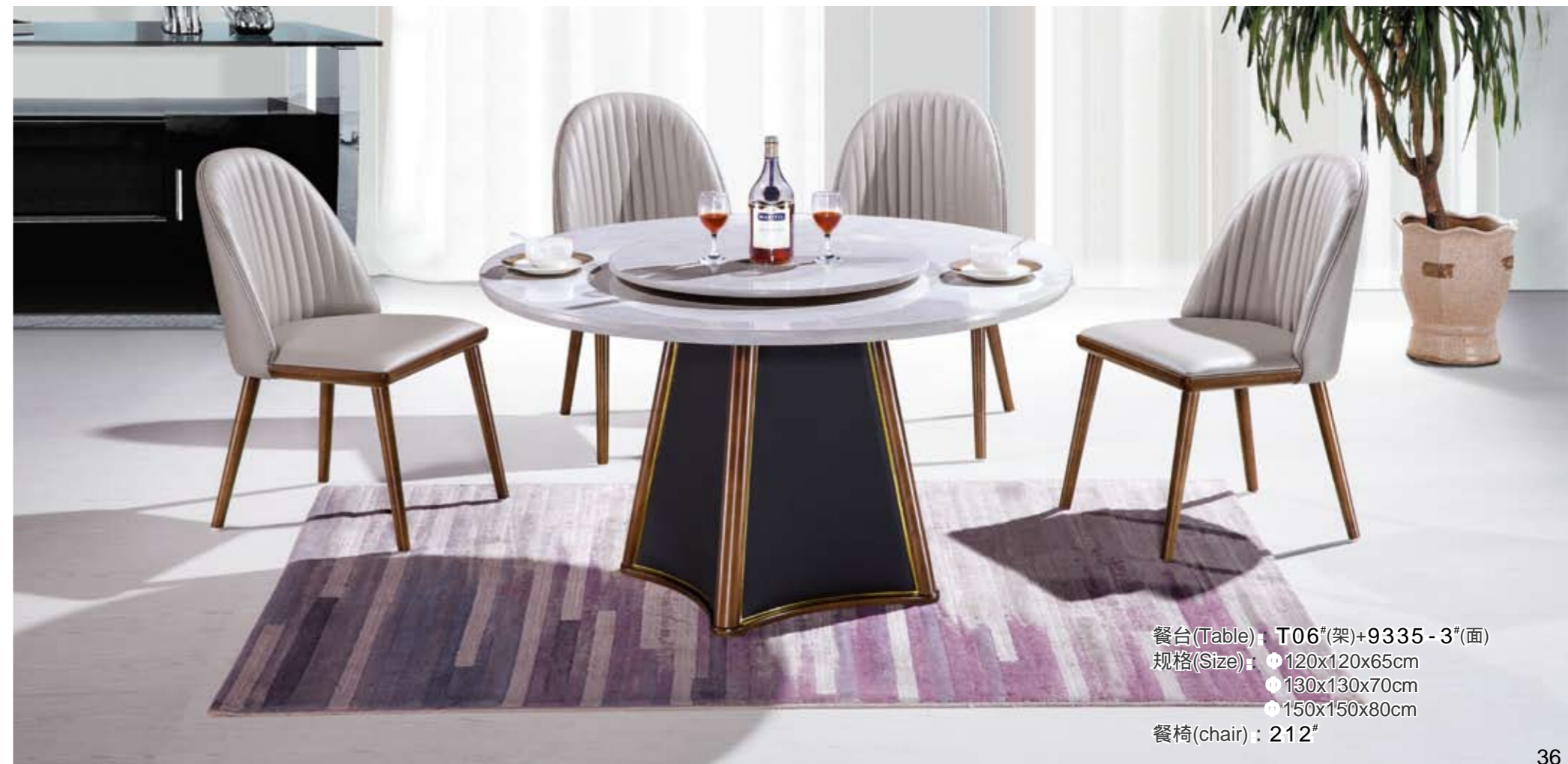
餐台(Table) : T06 # (架)+9335-3 # (面) 规格(Size) : ● 120x120x65cm ● 130x130x70cm ● 150x150x80cm 餐椅(chair) : 212 #