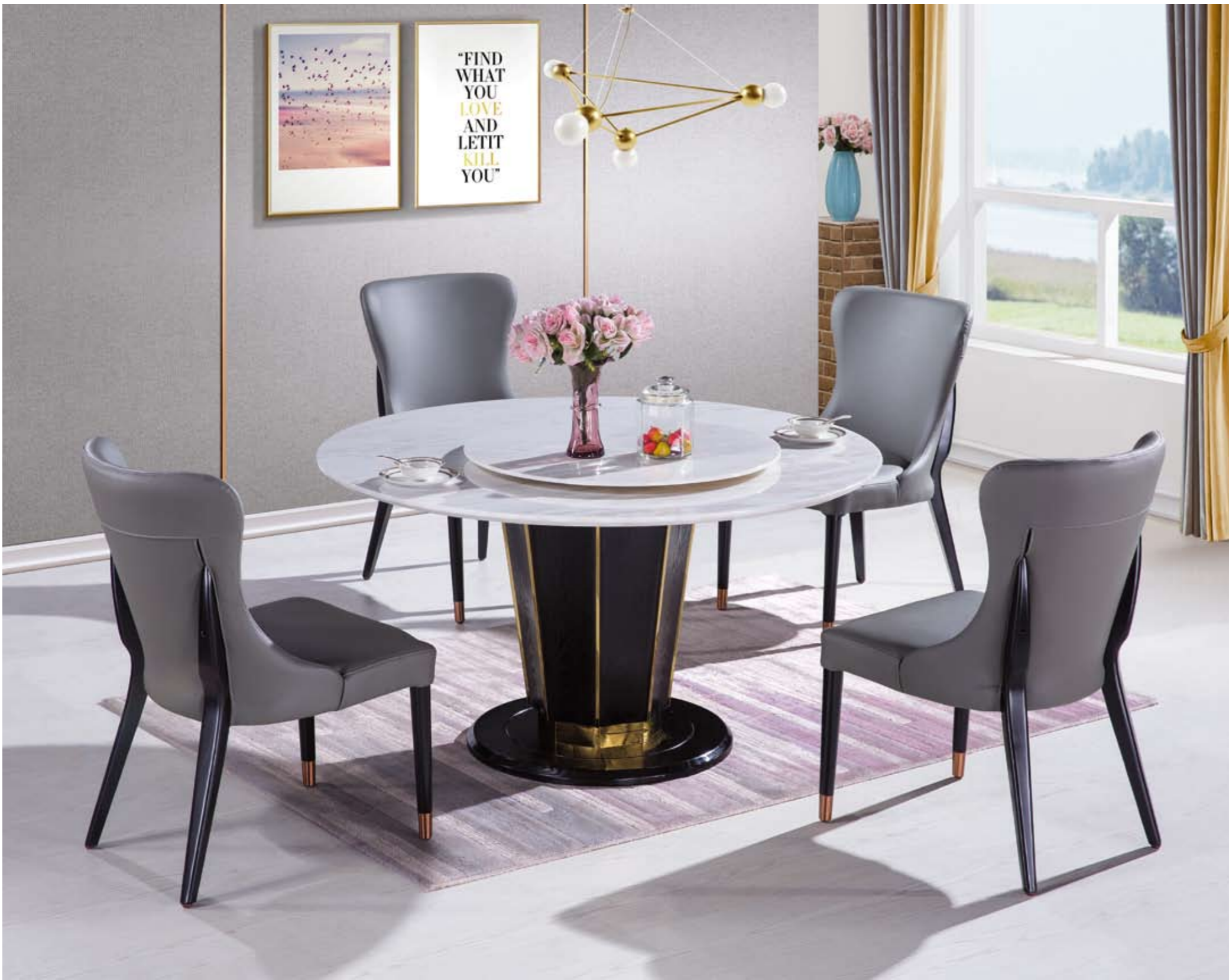
餐台(Table) : 天然玫瑰冰玉面(面)+ F836(台架) 规格(Size) : 120cm+65cm 130cm+70cm 150cm+80cm 餐椅(Chair) : 985"