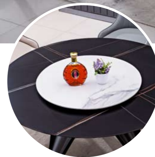
餐台(Table) : 劳黑+卡白 # (面)+08-3 # (台架) 规格(Size) : 120cm+65cm 130cm+70cm 150cm+80cm 160cm+90cm 餐椅(Chair) : 830+830 (56皮) #