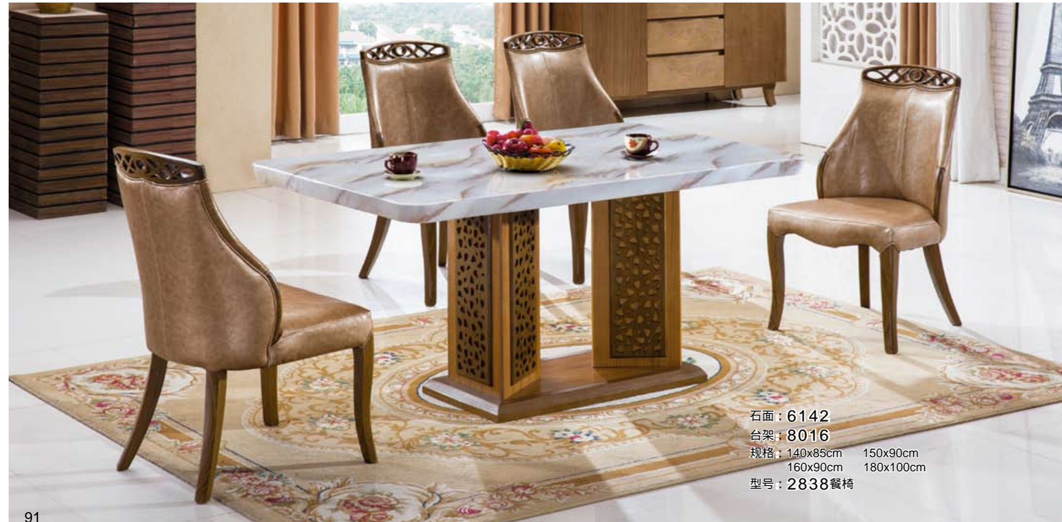
石面 : 6142 台架 : 8016 规格 : 140x85cm 150x90cm 160x90cm 180x100cm 型号 : 2838餐椅