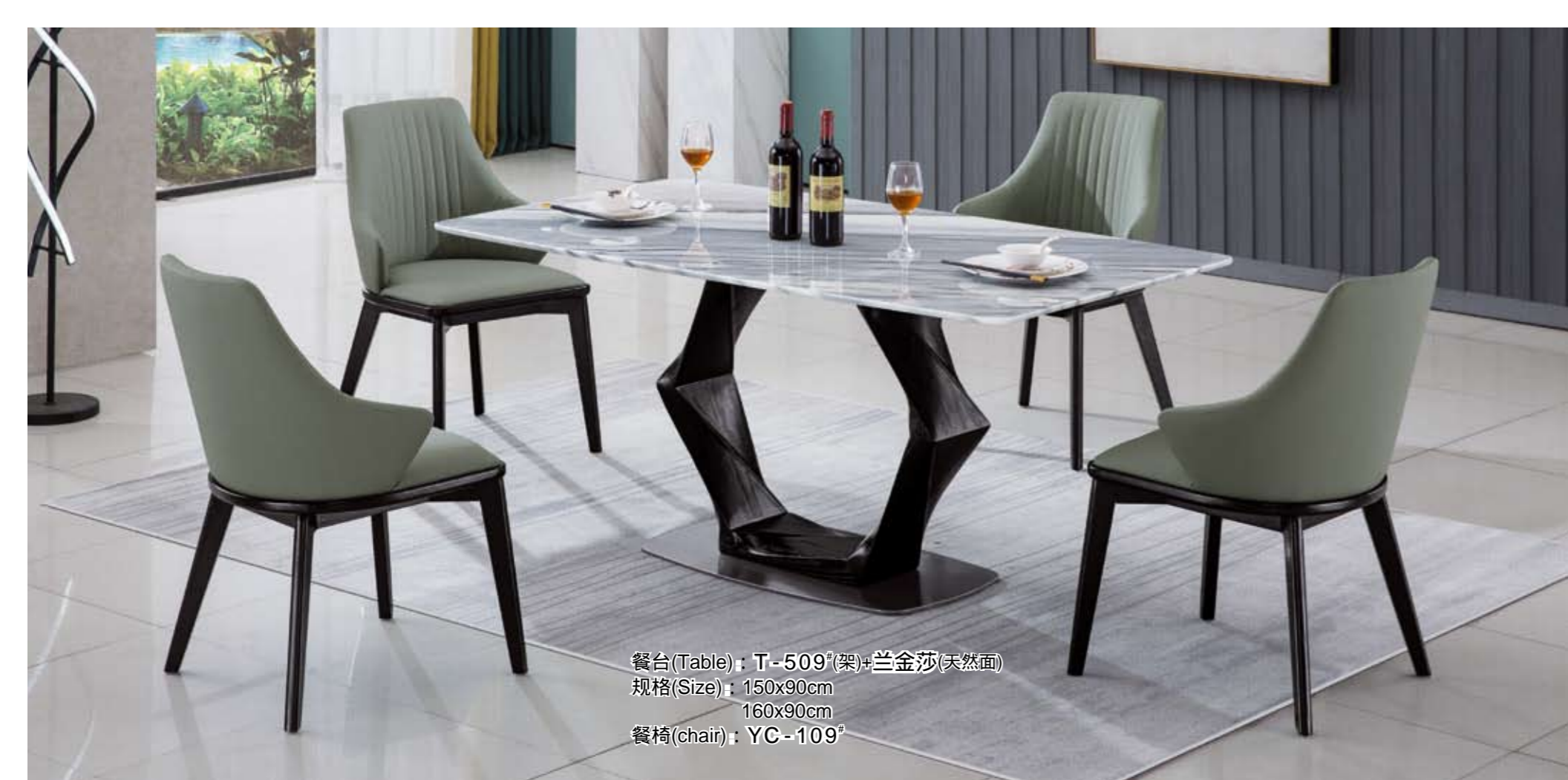
餐台(Table): T-509 # (架)+兰金沙(天然面) 规格(Size): 150x90cm 160x90cm 餐椅(chair): YC-109 #