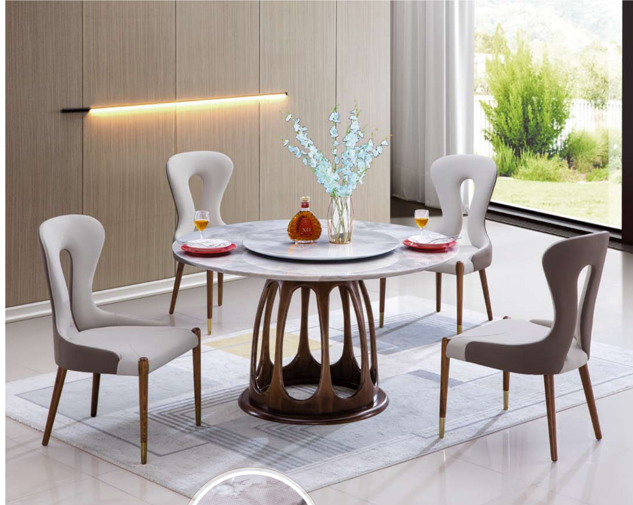
餐台(Table) : 62087 # (面)+602 # (台脚) 规格(Size) : 120cm+65cm 130cm+70cm 150cm+80cm 餐椅(Chair) : 1015 #