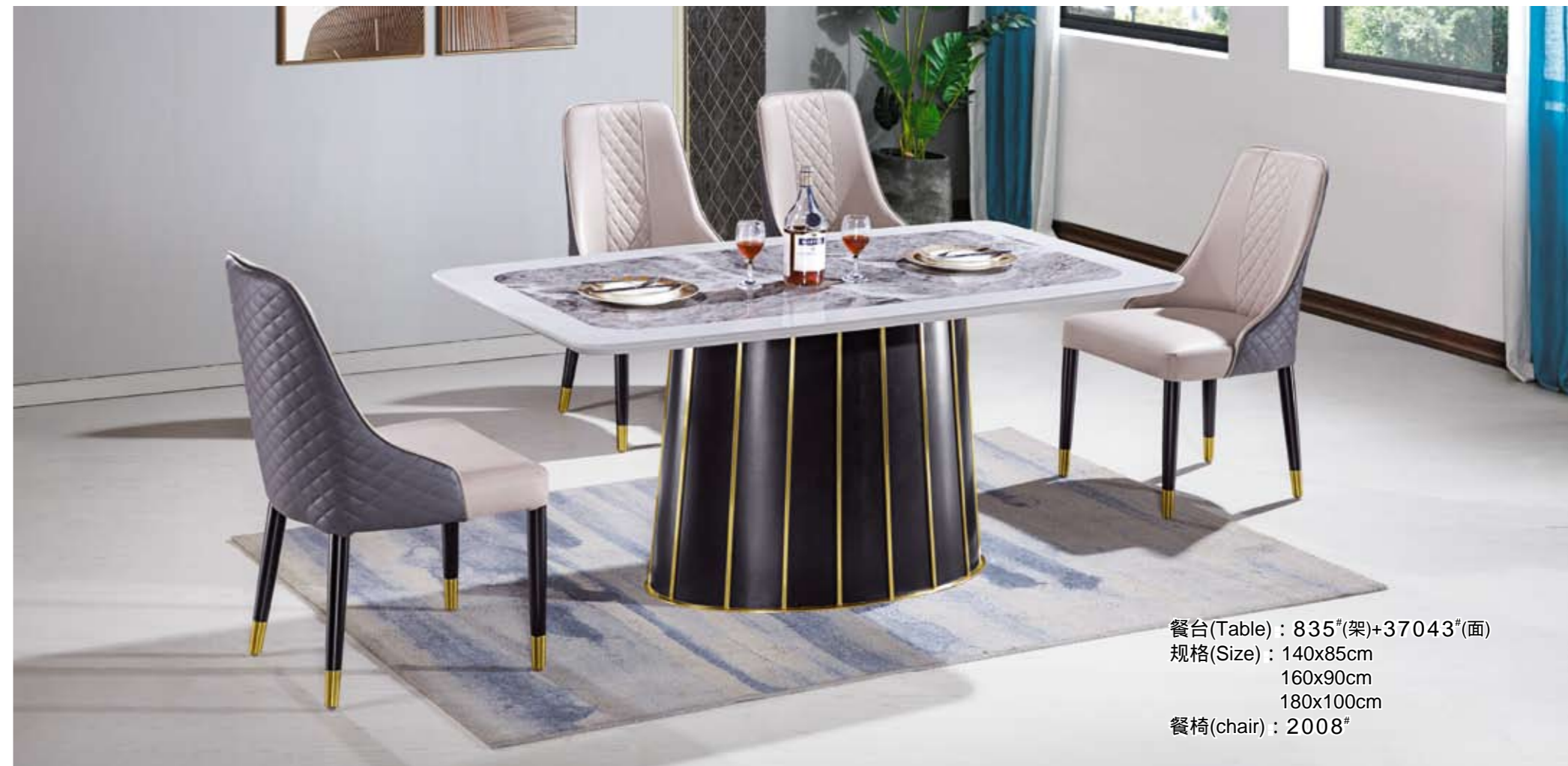
餐台(Table) : 835 # (架)+37043 # (面) 规格(Size) : 140x85cm 160x90cm 180x100cm 餐椅(chair) : 2008 #