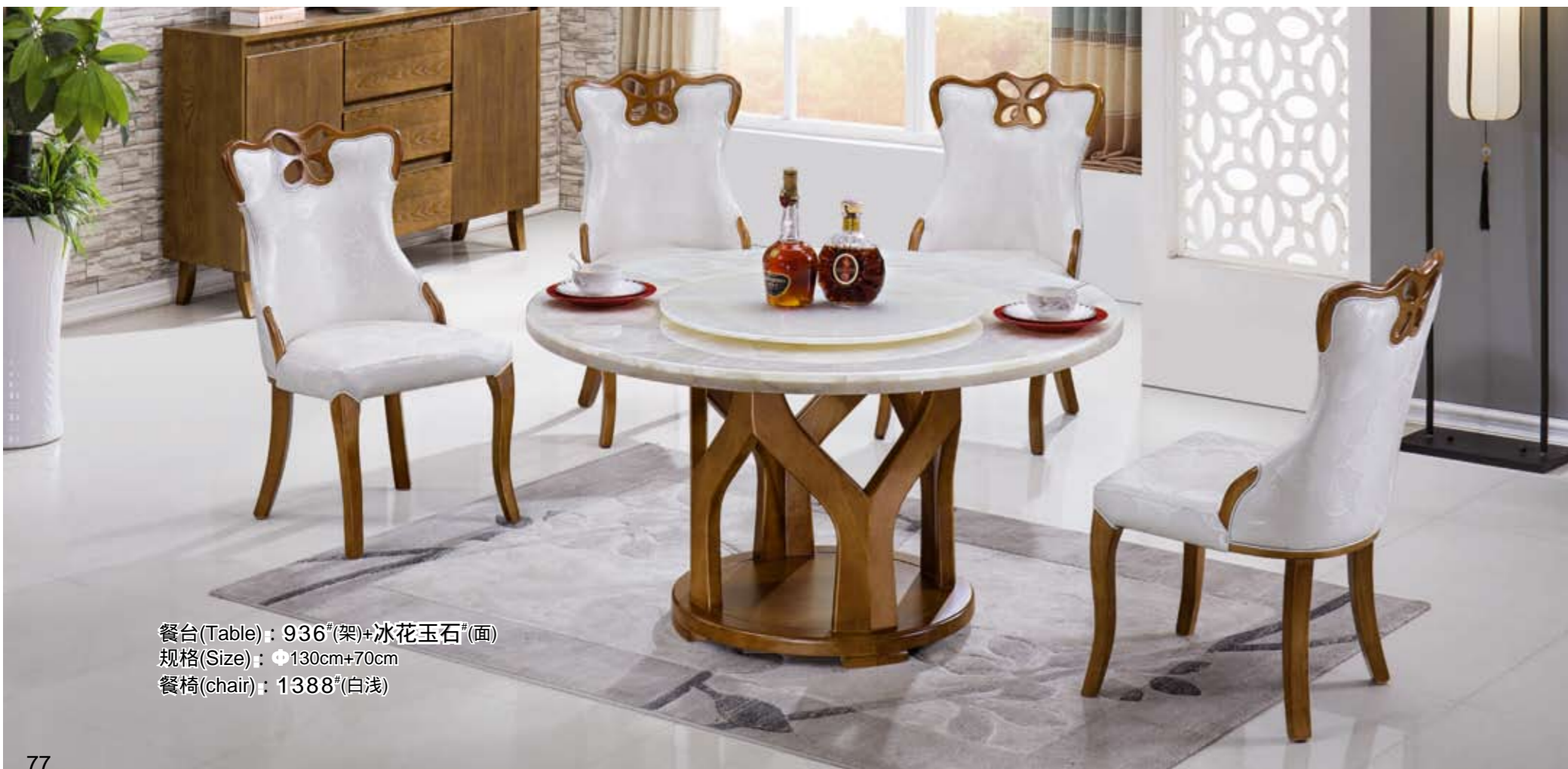
餐台(Table) : 936 # (架)+冰花玉石 # (面) 规格(Size) : ● 130cm+70cm 餐椅(chair) : 1388 # (白浅)