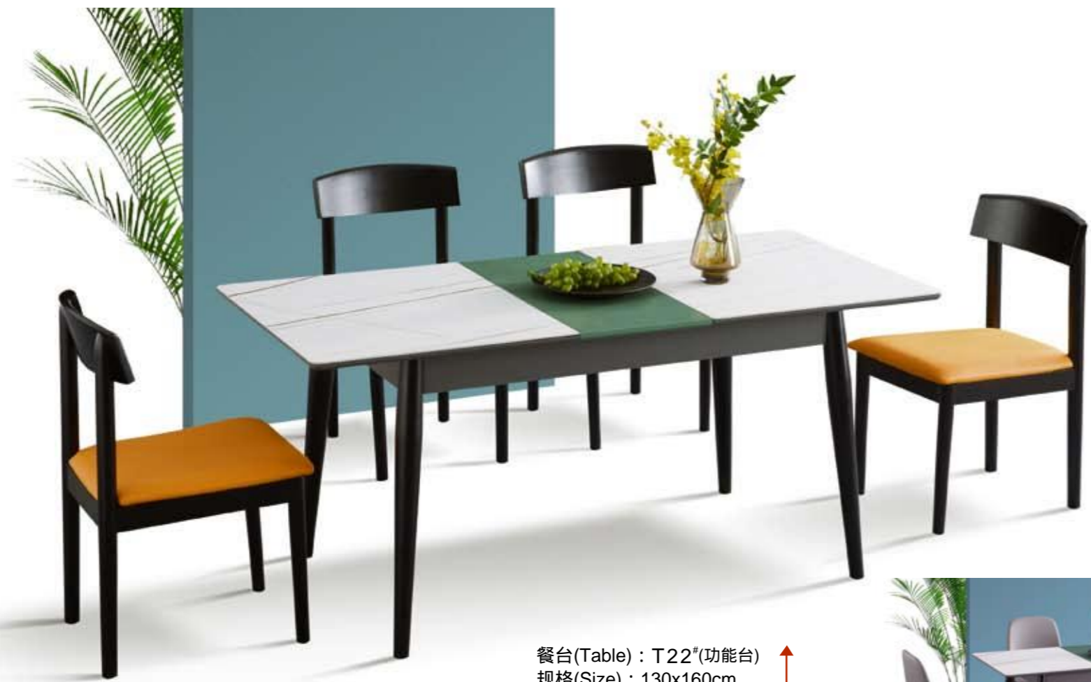
餐台(Table) : T22 # (功能台) 规格(Size) : 130x160cm 餐椅(chair) : 102 #