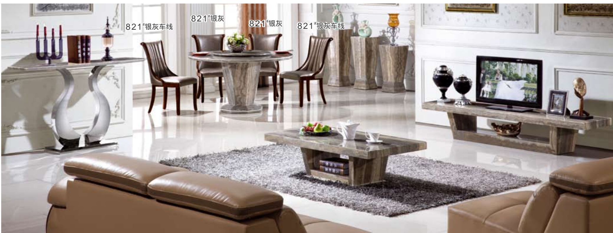
餐台(Table) : 0713# 规格(Size) : 120cm x 65cm 130cm x 70cm 150cm x 80cm 餐椅(Chair) : 821#(银灰) 821#(银灰车线) 茶几(Table) : 0713# 规格(Size) : 120cm x 65cm 130cm x 80cm 140cm x 85cm 150cm x 90cm 160cm x 90cm 180cm x 100cm