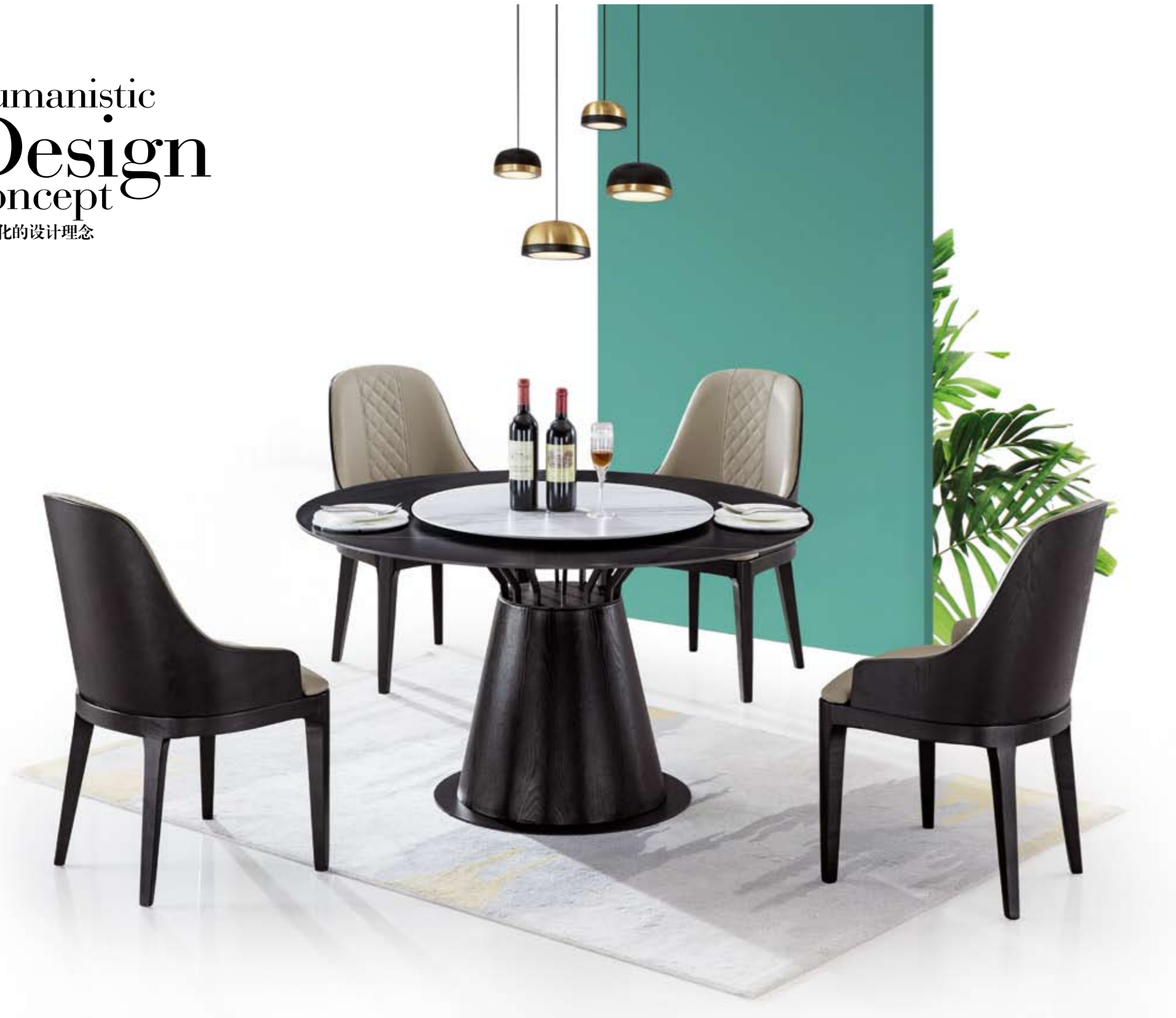
石面(Stone Surface) : 劳伦黑金 (岩板) 水云沙 ® (面) 台架(Table rack) : T - 031 ® 规格(Size) : 130cm+70cm 150cm+80cm 餐椅(Chair) : YC - 319 ® (黑)