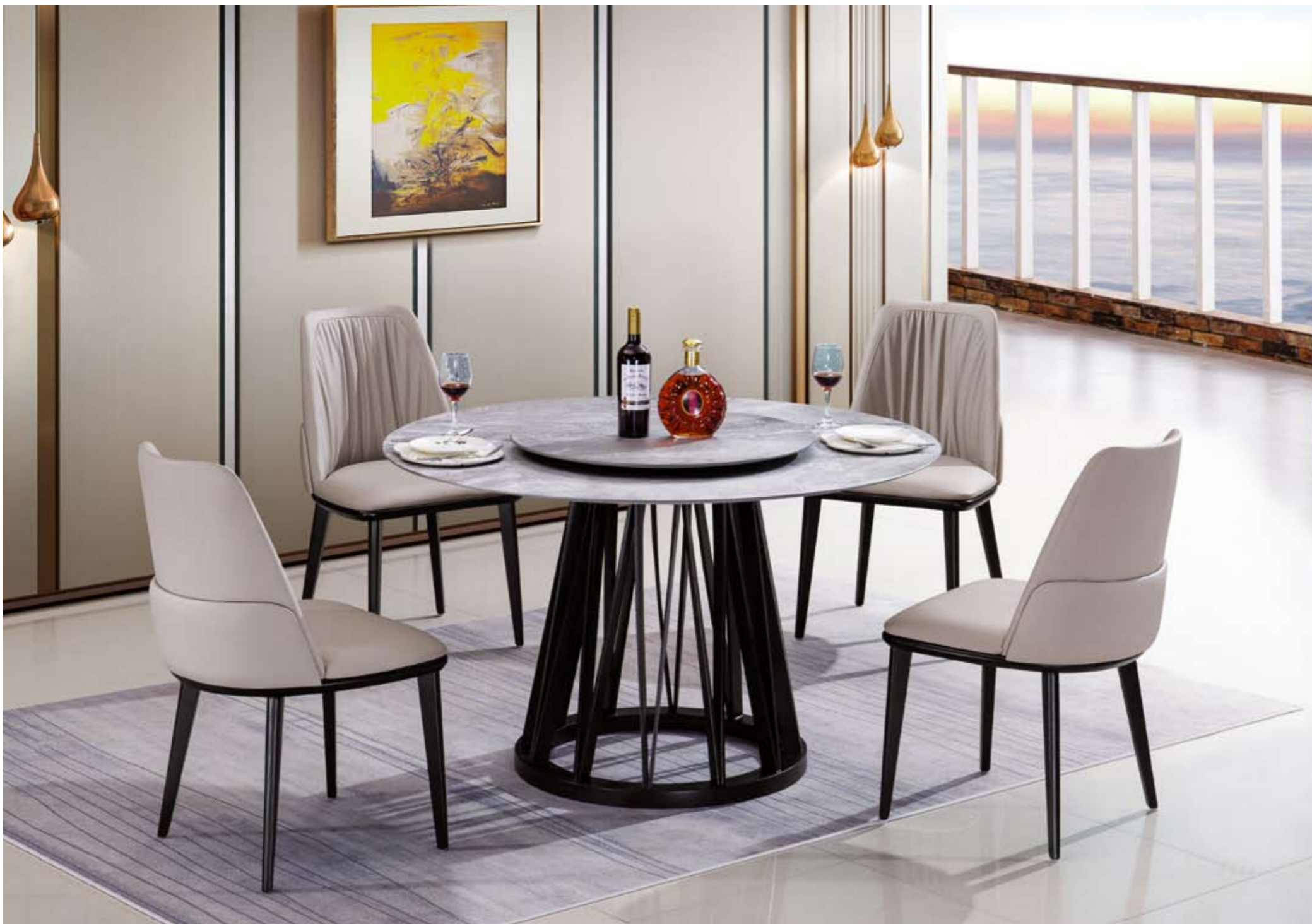
餐台(Table) : T08 # (架)+雅典娜灰(面) ↑ 规格(Size) : 120x120x65cm 130x130x70cm 150x150x80cm 餐椅(chair) : 390 #