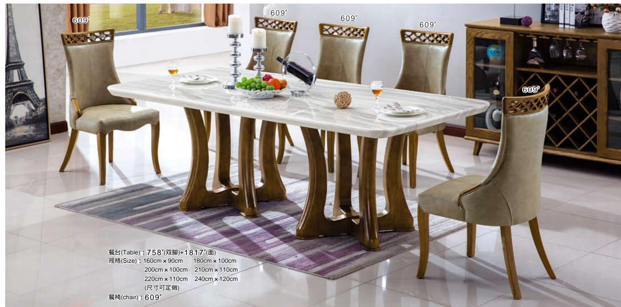
609° 609° 609° 609° 609° 餐台(Table) : 758"(双脚)+1817"(面) 规格(Size) : 160cm x 90cm 180cm x 100cm 200cm x 100cm 210cm x 110cm 220cm x 110cm 240cm x 120cm (尺寸可定做) 餐椅(chair) : 609°