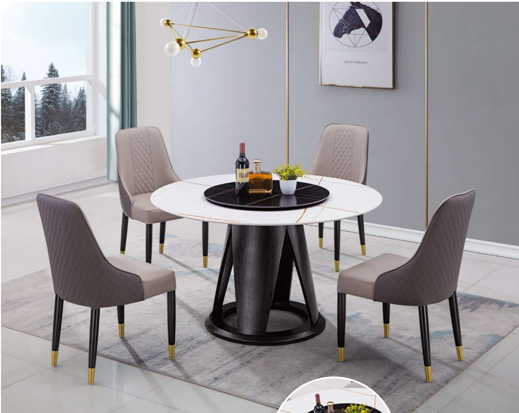
餐台(Table) : 劳黑+劳白 ® (面)+B07 ® (台架) 规格(Size) : 120cm+65cm 130cm+70cm 150cm+80cm 160cm+90cm 餐椅(Chair) : 2008 ®