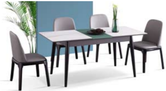
餐台(Table) : T22 # (功能台) 规格(Size) : 130x160cm 餐椅(chair) : 八角