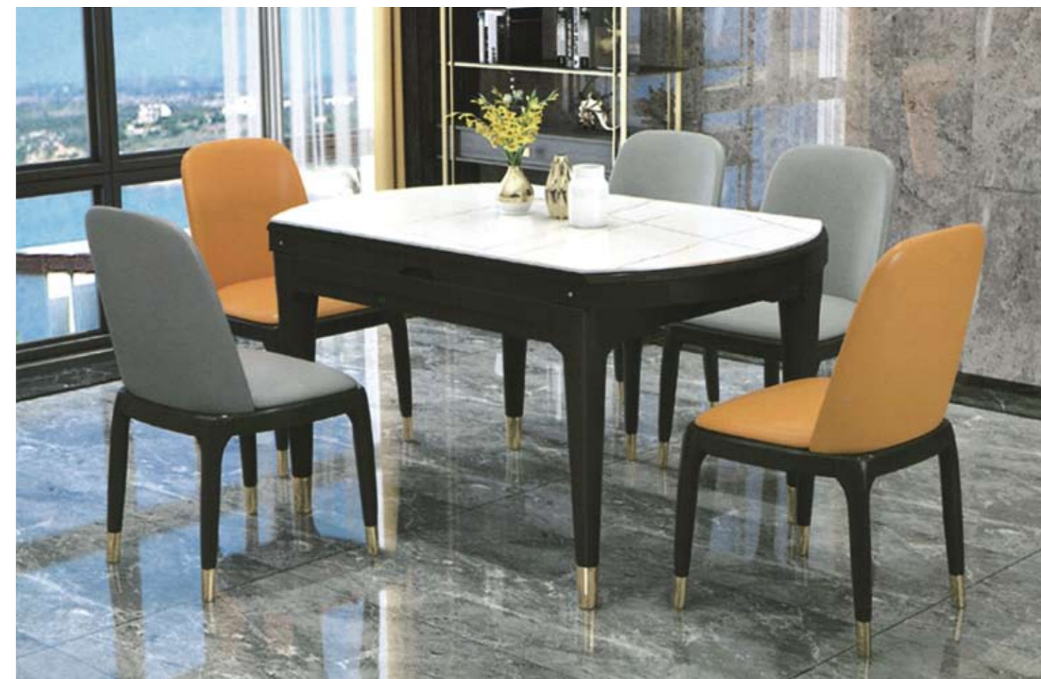
餐台(Table) : 1801 # 规格(Size) : 130cm 135cm 150cm 餐椅(Chair) : 八角椅