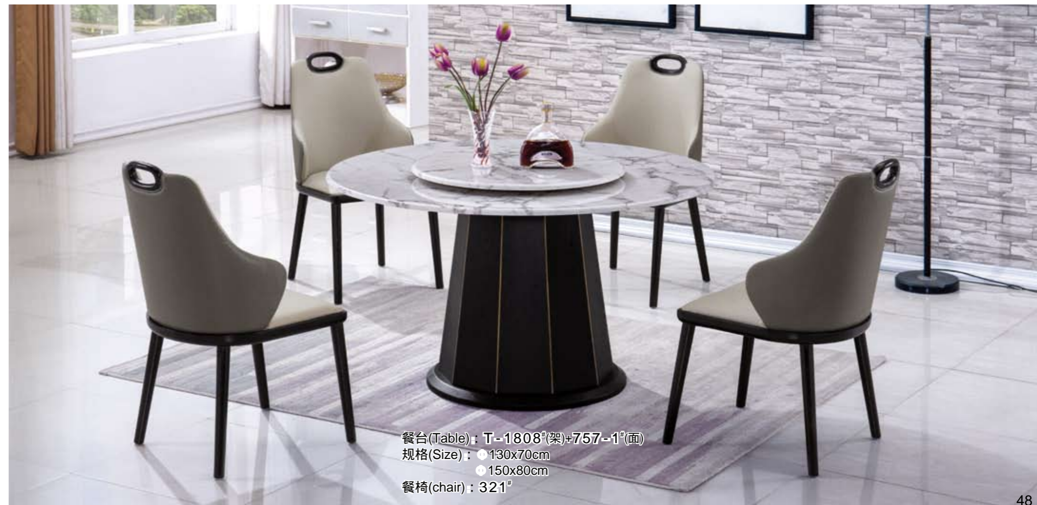
餐台(Table) : T-1808 # (架)+757-1 # (面) 规格(Size) : ● 130x70cm ● 150x80cm 餐椅(chair) : 321 #