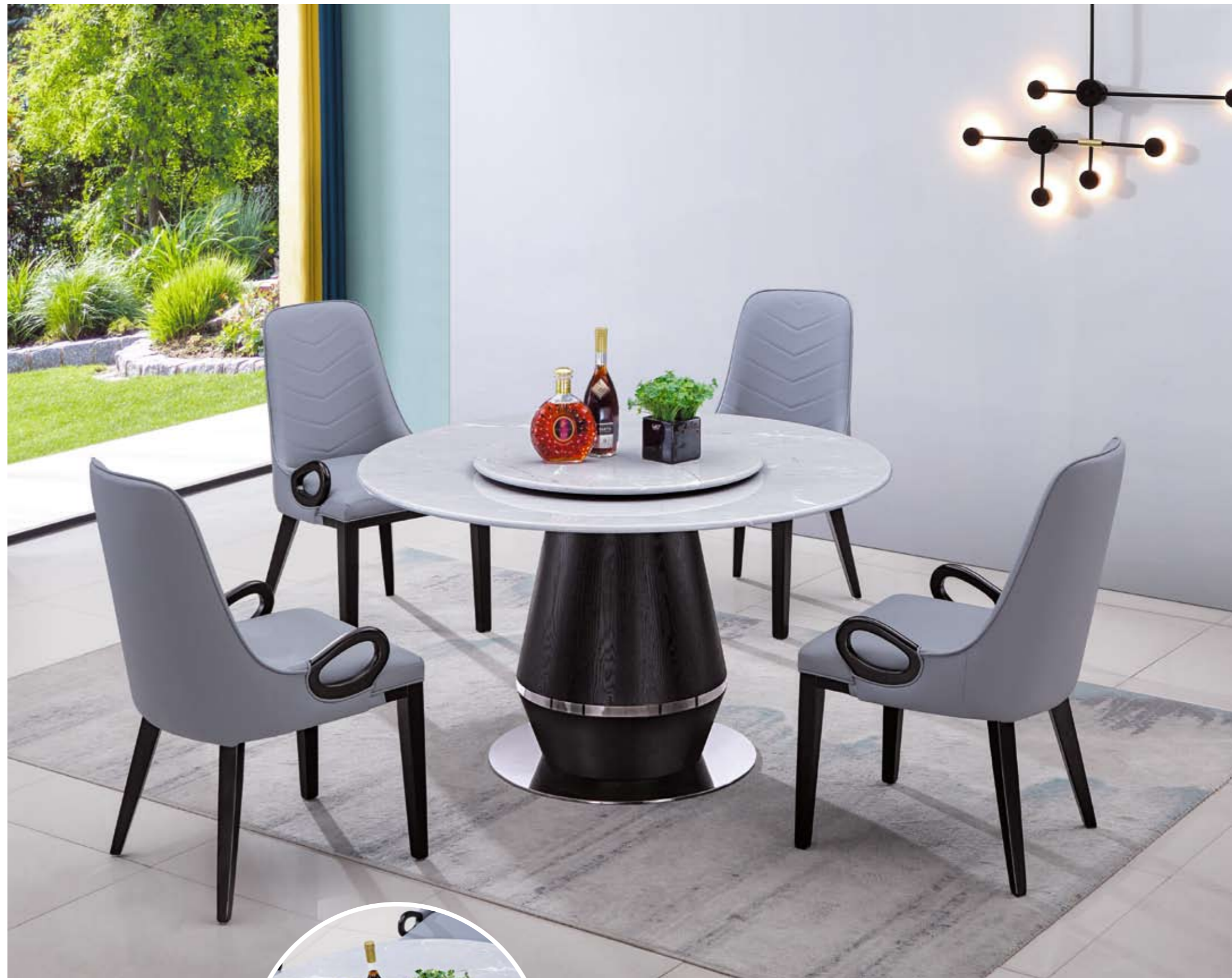
餐台(Table) : 3920 # (面)+8029 # (台架) 规格(Size) : 120cm+65cm 130cm+70cm 150cm+80cm 160cm+90cm 餐椅(Chair) : 938浅灰+橙 #