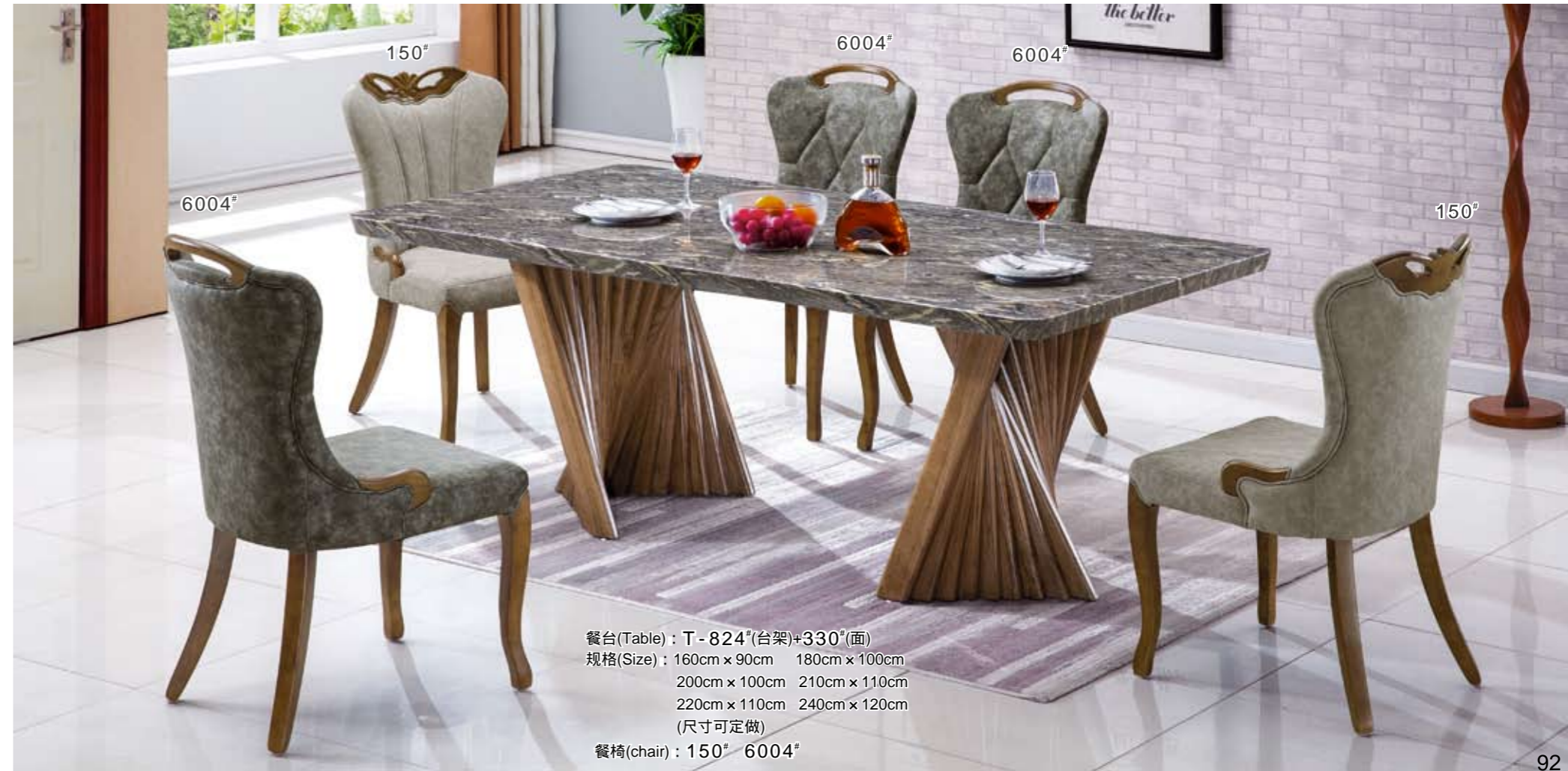
150° 6004° 6004° 150° 餐台(Table) : T - 824"(台架)+330"(面) 规格(Size) : 160cm x 90cm 180cm x 100cm 200cm x 100cm 210cm x 110cm 220cm x 110cm 240cm x 120cm (尺寸可定做) 餐椅(chair) : 150° 6004°