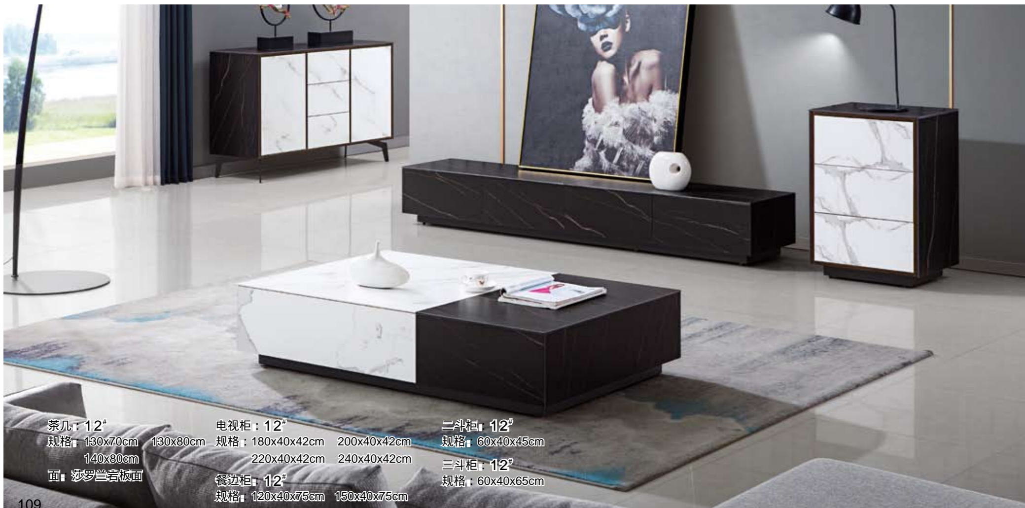
茶几：12 # 规格：130x70cm 140x80cm 面：莎罗岩岩板 电视柜：12 # 规格：180x40x42cm 220x40x42cm 240x40x42cm 餐边柜：12 # 规格：120x40x75cm 150x40x75cm 三斗柜：12 # 规格：60x40x45cm 三斗柜：12 # 规格：60x40x65cm