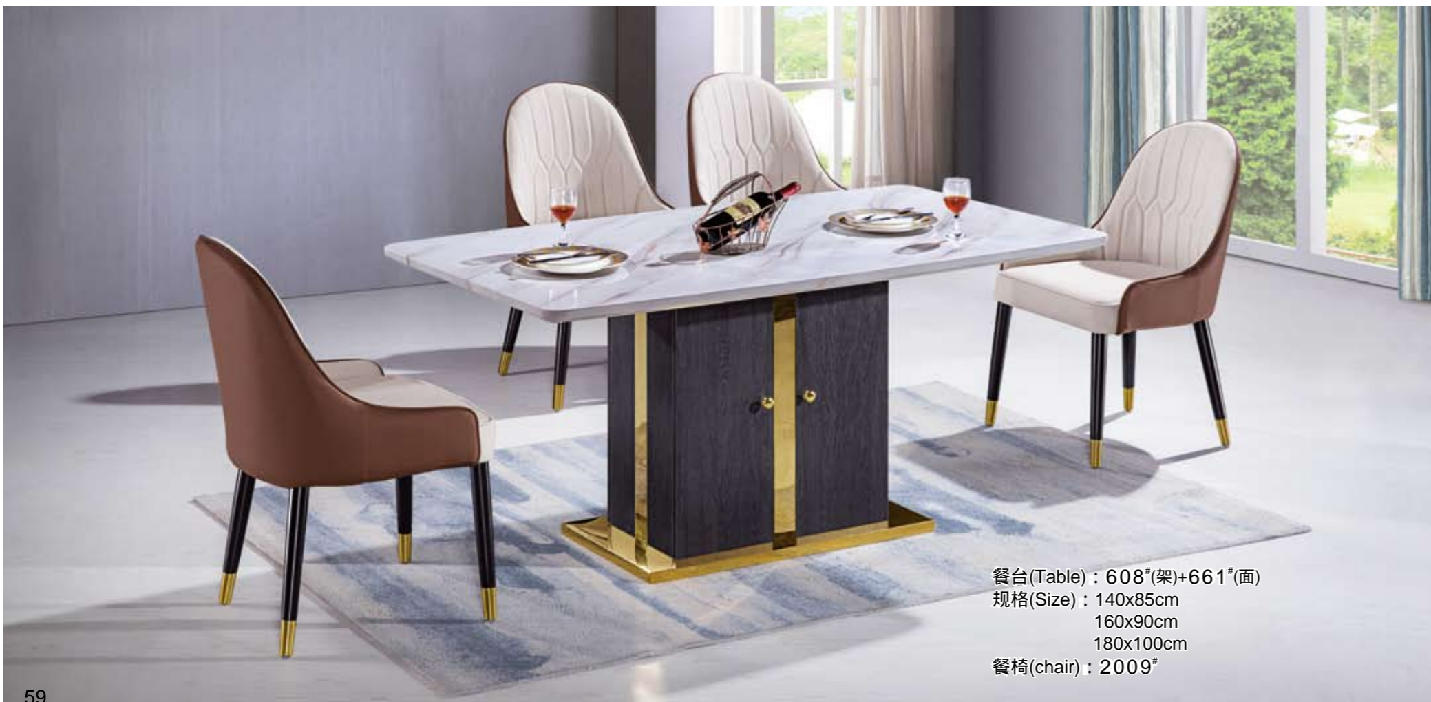
餐台(Table) : 608 # (架)+661 # (面) 规格(Size) : 140x85cm 160x90cm 180x100cm 餐椅(chair) : 2009 #