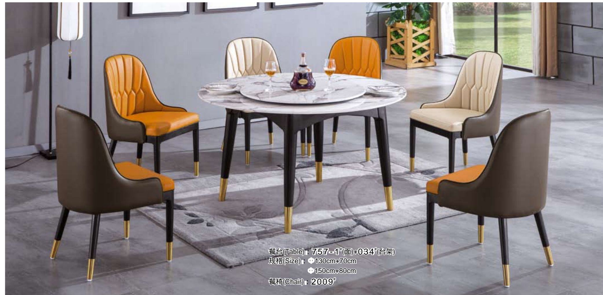
餐台(Table) : 757 - 1 # (面)+034 # (台架) 规格(Size) : \Phi 130cm+70cm \Phi 150cm+80cm 餐椅(Chair) : 2009 #